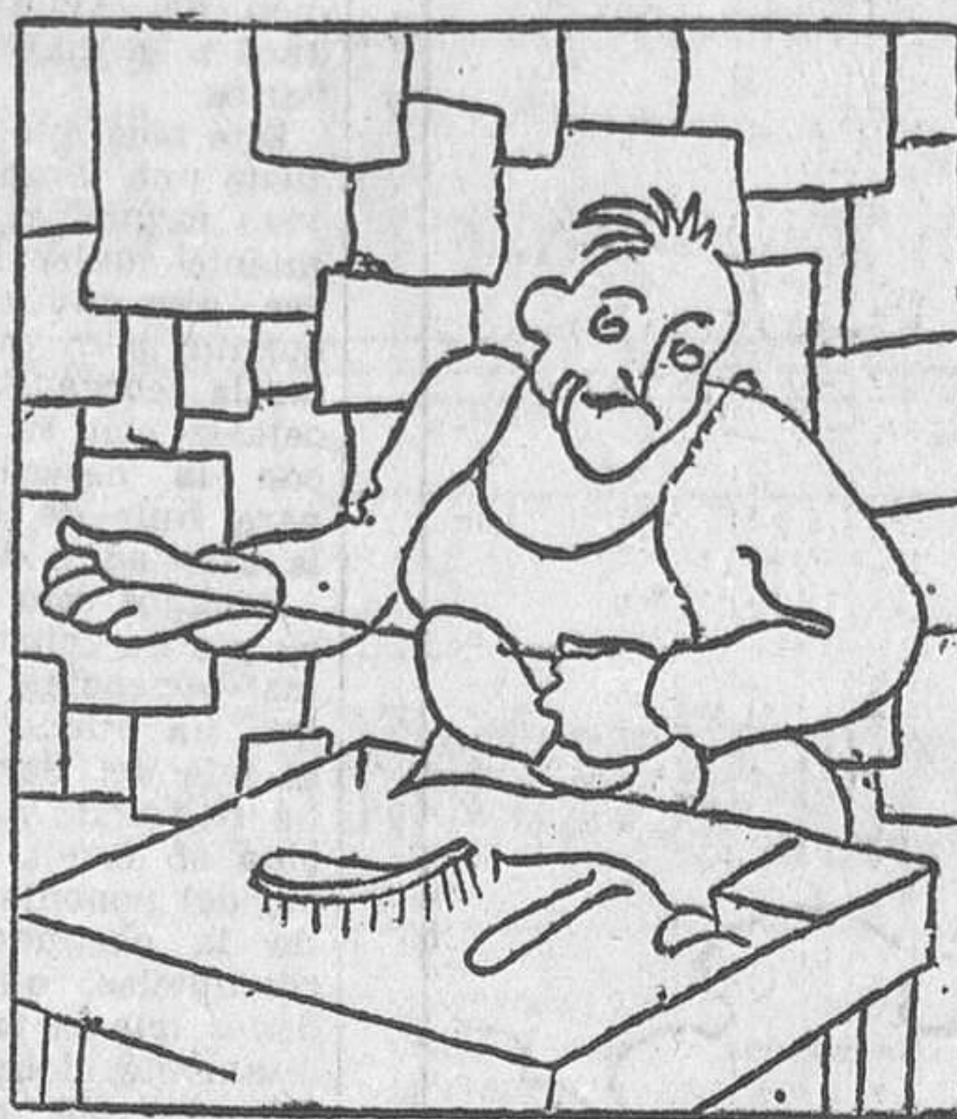
Virgilio era un zapateiro moi chistoso e moi amigo do viño branco.