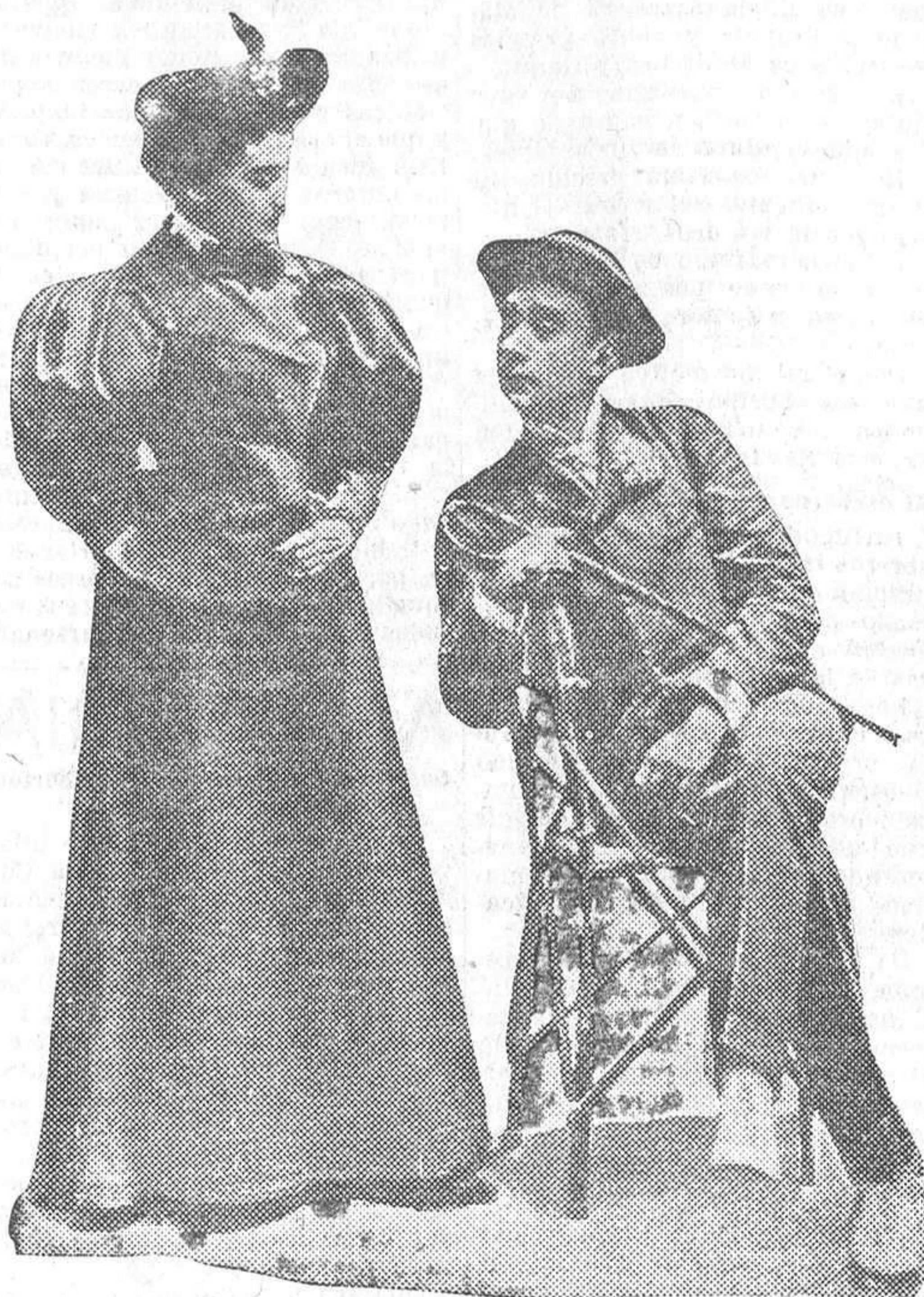
María Guerrero y Fernando Díaz de Mendoza cuando contrajeron matrimonio

Los Gobiernos del Reich y de Prusia han enviado cada uno al Consejo municipal de Alsdorf la cantidad de 150.000 marcos para socorrer a las familias de las víctimas. El presidente Hindenburg ha enviado 100.000 marcos.