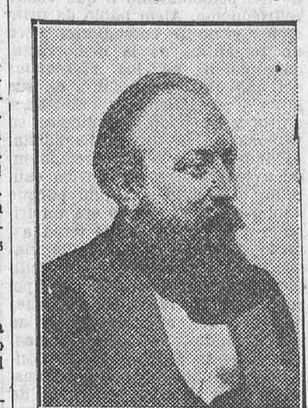
César de Paepe, fundador del sindicalismo belga