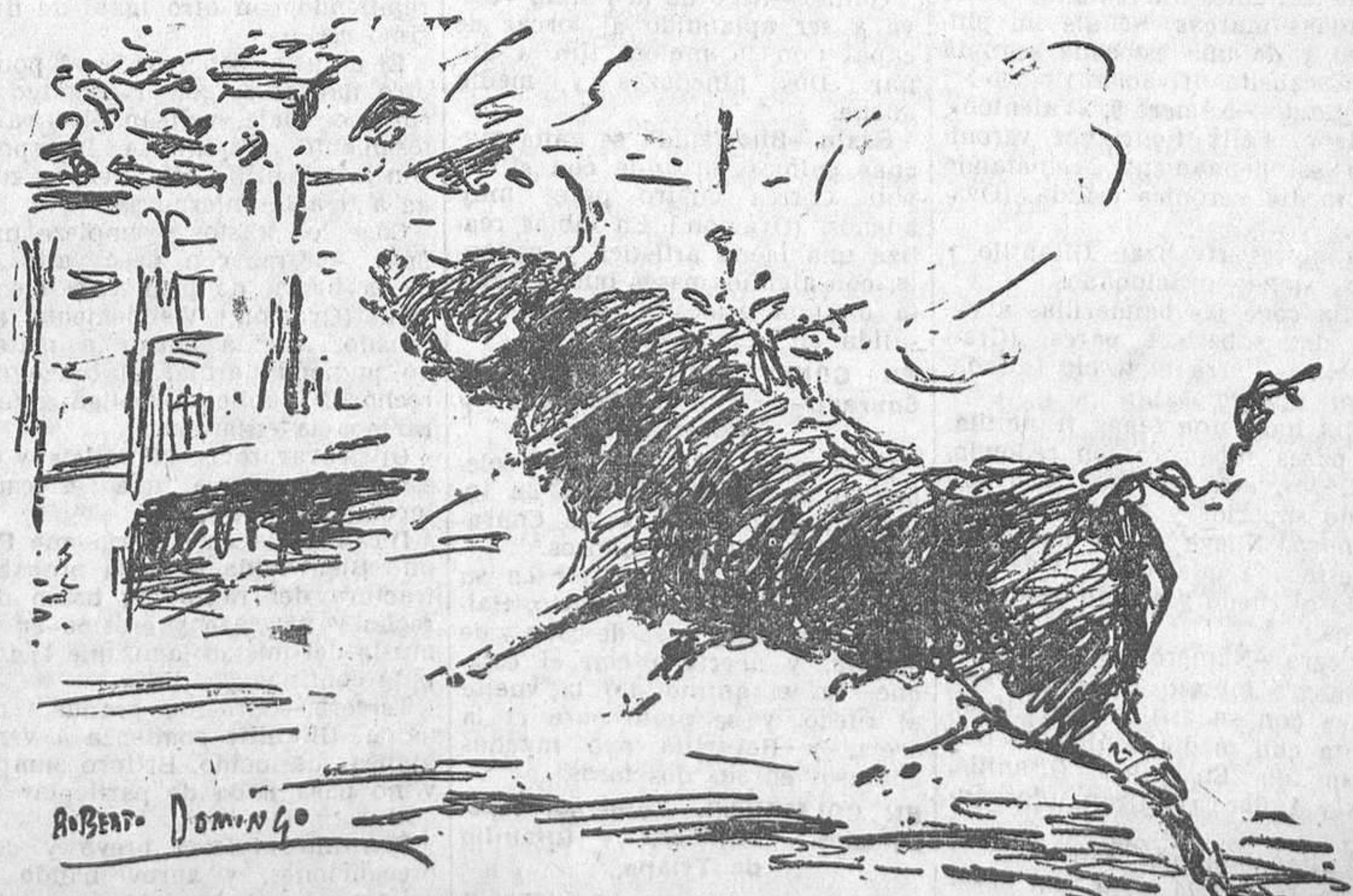
EL DOMINGO, EN MADRID.—Reparición de las banderillas de fuego en el sexto toro (Apuntes del natural por Roberto Domingo)