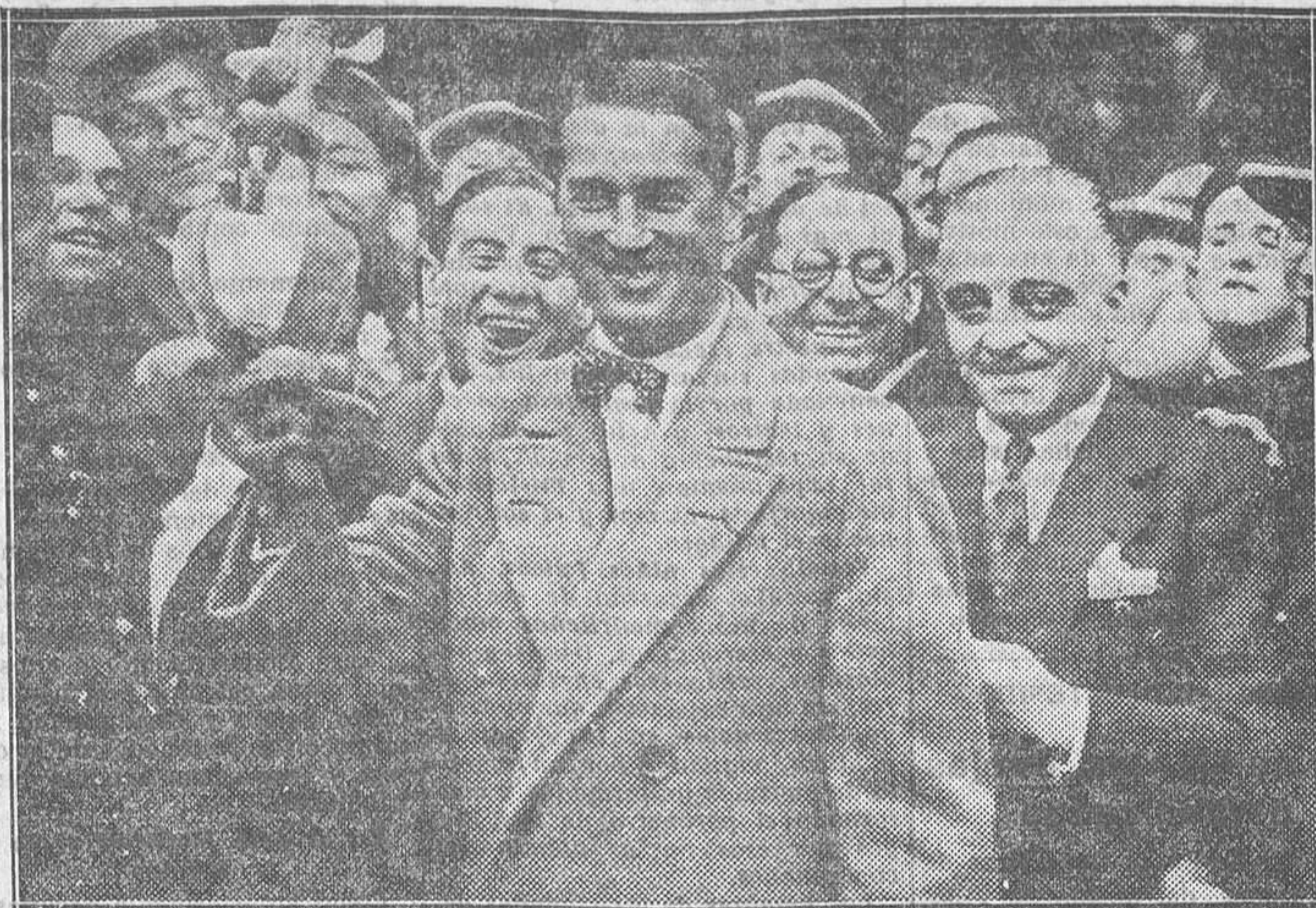
El famoso cantante y cineasta de la eterna sonrisa, Maurice Chevalier, es recibido en la estación de San Lázaro, de París...