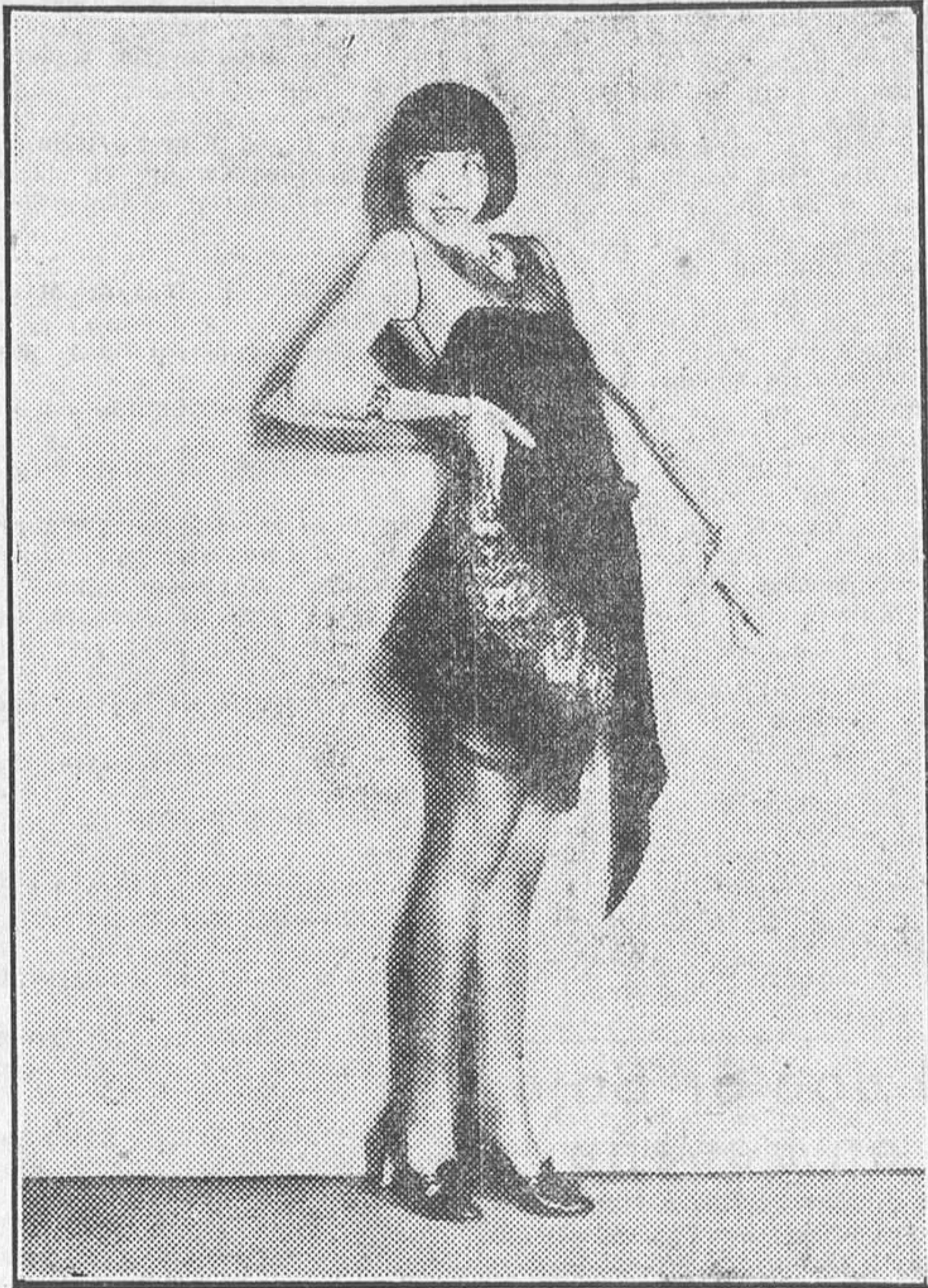
COLLEEN MOORE, LA VIVARACHA Y GENTIL ARTISTA DE LA FIRST NATIONAL

Esta bellísima comedia pertenece al grupo de producciones frías de la renombrada marca U. F. A. Como las ya admiradas por nuestro público, «Vacaciones» es un modelo de cintas sugestivas, limpias y elegantes, y en ellas Lillian Harvey, la actriz a