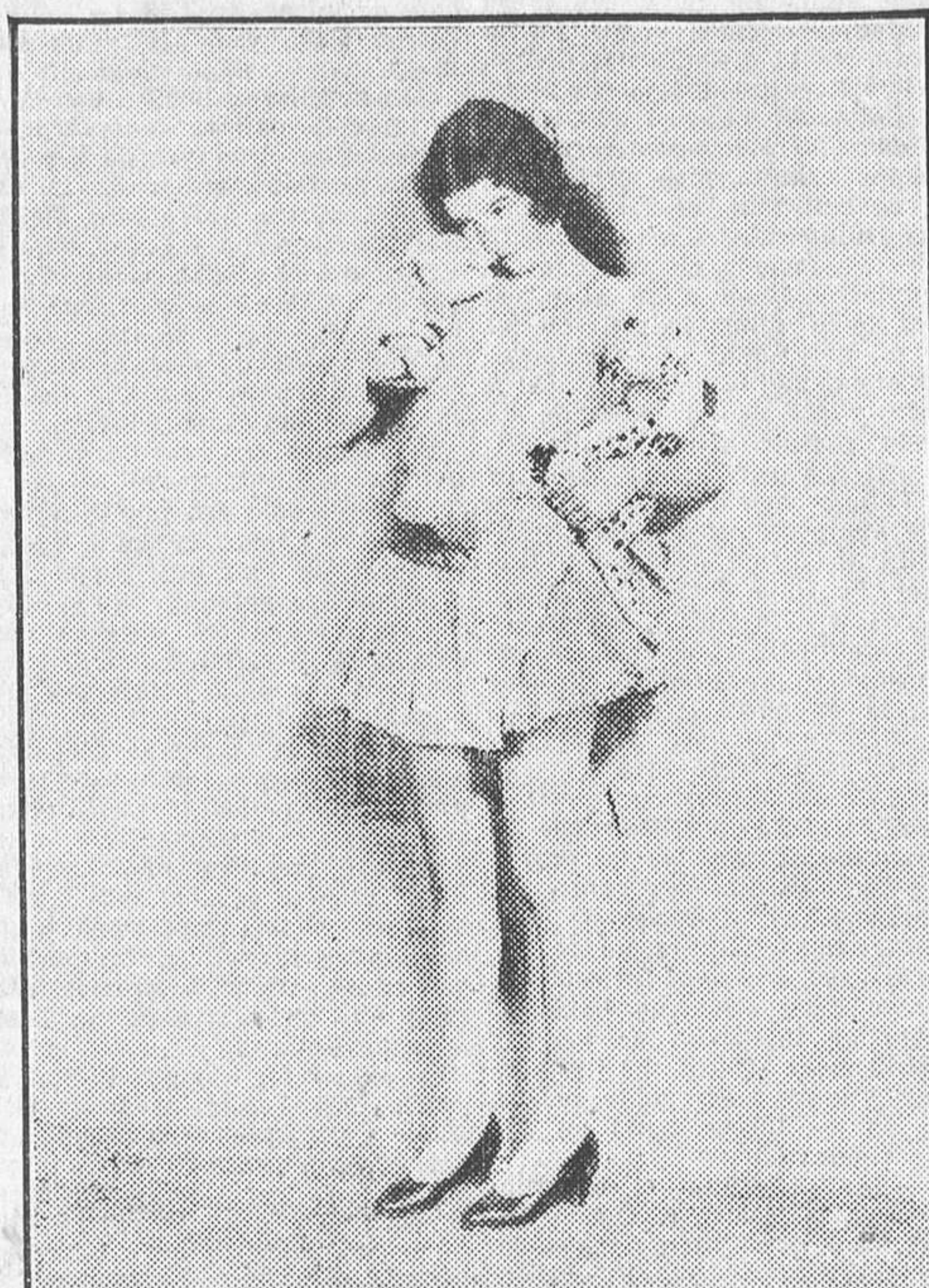
MARCELINE DAY, UNA DE LAS ESTRELLAS MENORES DE LA METRO-GOLDWYN

En cuanto a «L'Etoile de mer», más que una película nos parece