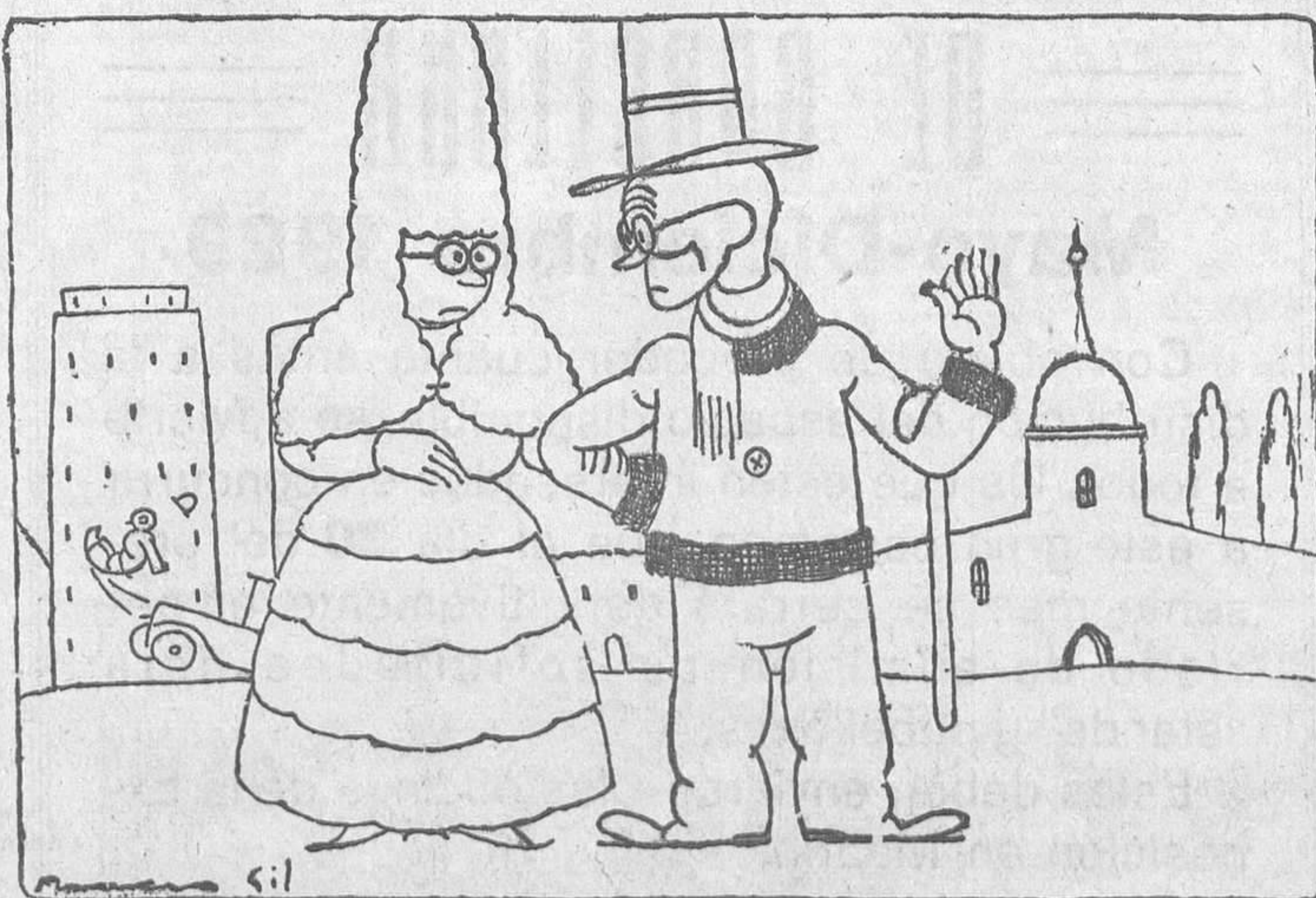
--Dicen los periódicos que en Londres abundan los cortos de vista. --Yo no sé lo que pasará en Londres, pero aquí no vemos más allá de nuestras narices.

La información abierta ha revelado que se distribuyeron importantes sumas entre la Policía, con el pretexto de una tómbola, para advertir con tiempo de las visitas de la Policía a las casas de juego, frecuentadas por el elemento negro. El magistrado que entiende en el asunto ha pedido la dimisión del jefe de la Seguridad, aunque dejando a salvo la honorabilidad de éste.