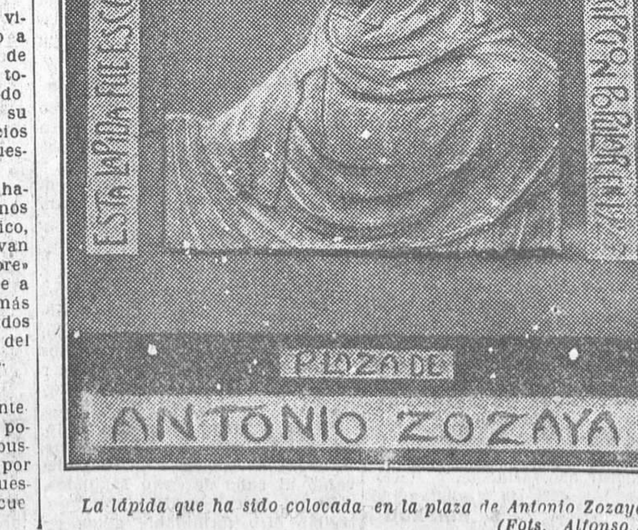
La lápida que ha sido colocada en la plaza de Antonio Zozaya

No pasando mucho tiempo, cuando los árboles, hoy jóvenes, den sombra, y la escalerilla que desde la Cabecera del Rastro da acceso a la plaza desaparezca y en su lugar se construya una ancha escalera de piedra, la nueva vía pública será bellísima.