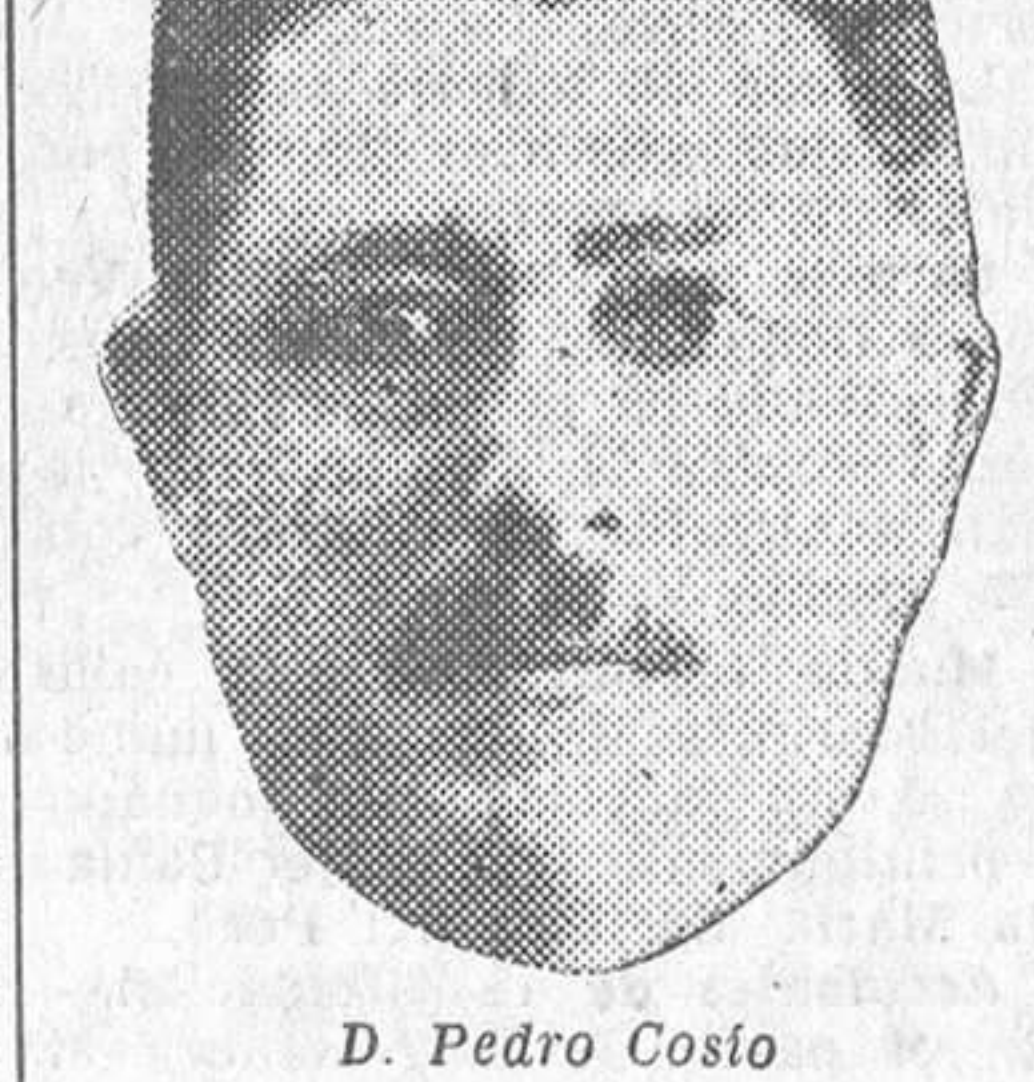
D. Pedro Cosío

Ha llegado a Madrid una distin- guidísima personalidad america- na, figura preeminente del Uru- guay: D. Pedro Cosío, enviado extraordinario y ministro pleni- potenciario de aquella República en Alemania.