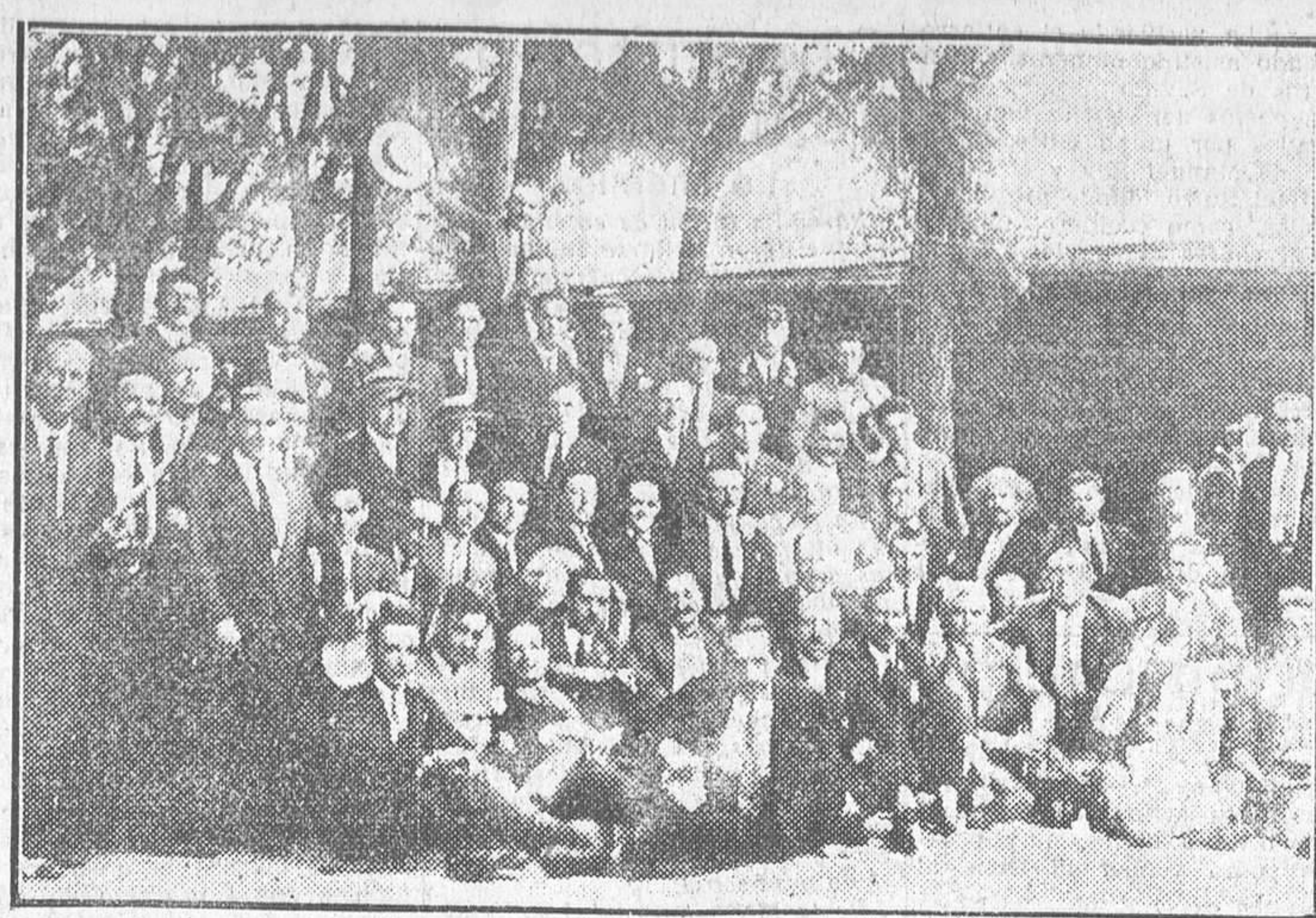
Grupo de asistentes al banquete con que la Sociedad Turismo Madrileño ha celebrado el segundo aniversario de su fundación.