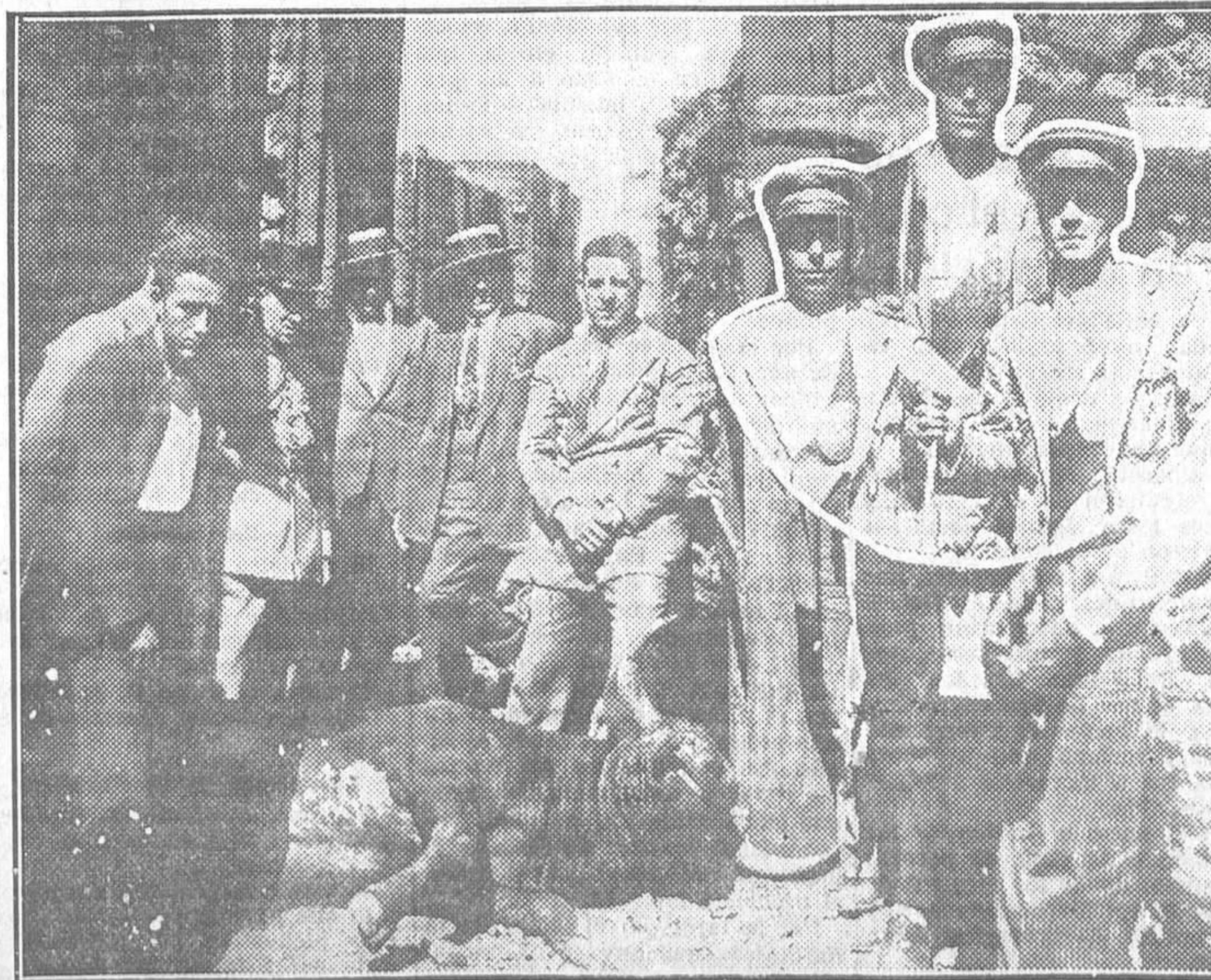
El toro de Yeragua que se escapó ayer en los muelles del Cerro de la Plata y los tres escopeteros de la estación del Mediodía que le dieron muerte

Se acordó igualmente que esta nueva Federación Internacional colabore estrechamente con la Sociedad de Naciones.