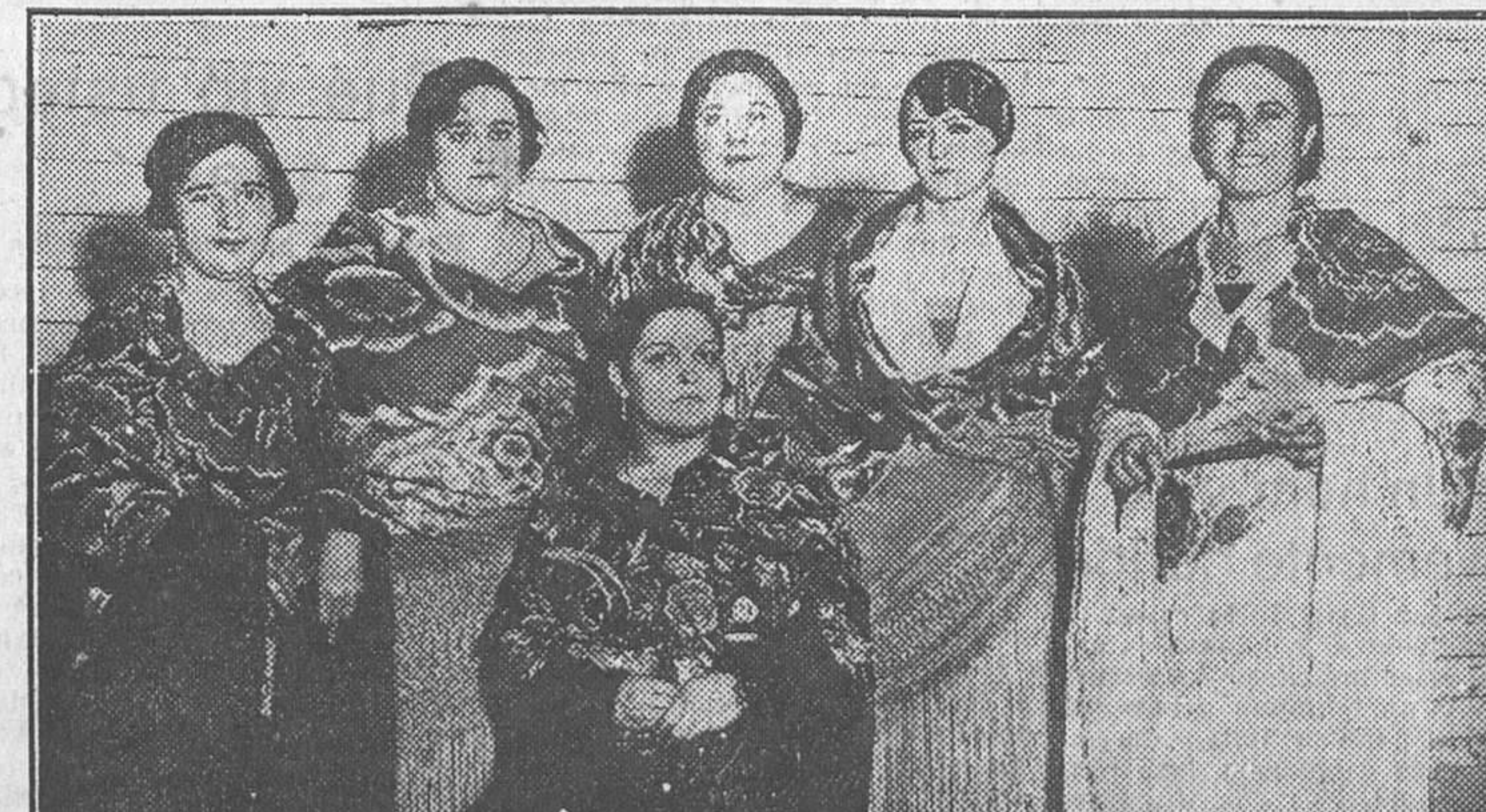
Bellas chamberleras, a quienes se han concedido el premio de honor (en el centro, sentada), y los primeros premios en el concurso de mantones celebrado en la «kermesse» de Chamberl, con motivo de la verbena del Carmen

Obrero carbonizado por un rayo Jaén, 24.—En Los Villares ha descargado una tremenda tormenta. En el transcurso de ella varios trabajadores buscaron refugio en un cortijo denominado