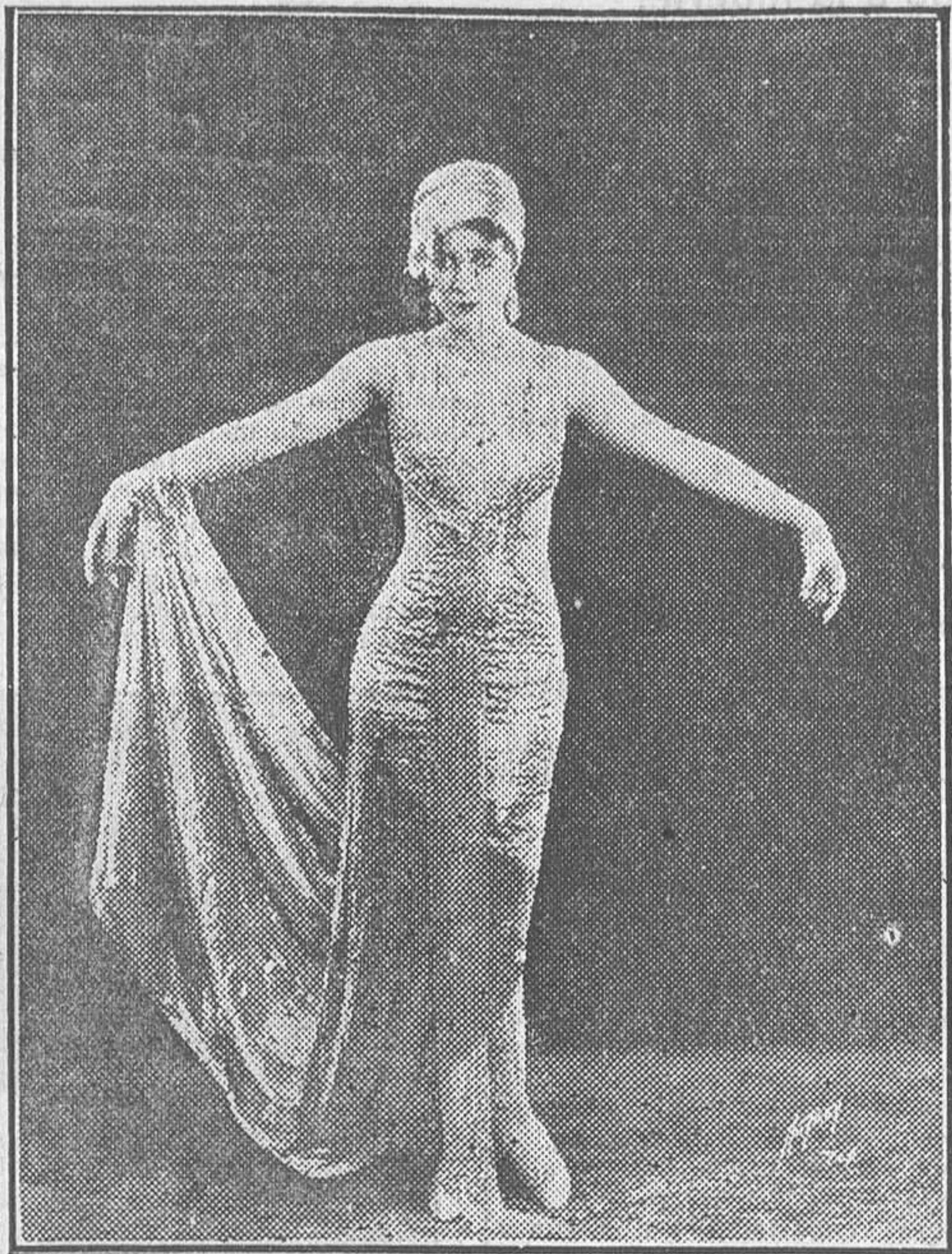
OLIVE BORDEN, LA HERMOSA ESTRELLA AMERICANA, LUCIENDO UNA ESPLENDIDA Y SUGESTIVA «TOILETTE» DE BAILE

Quiere esto decir, que la cinematografía ha alcanzado tan extraordinaria importancia que no puede ser considerada como una