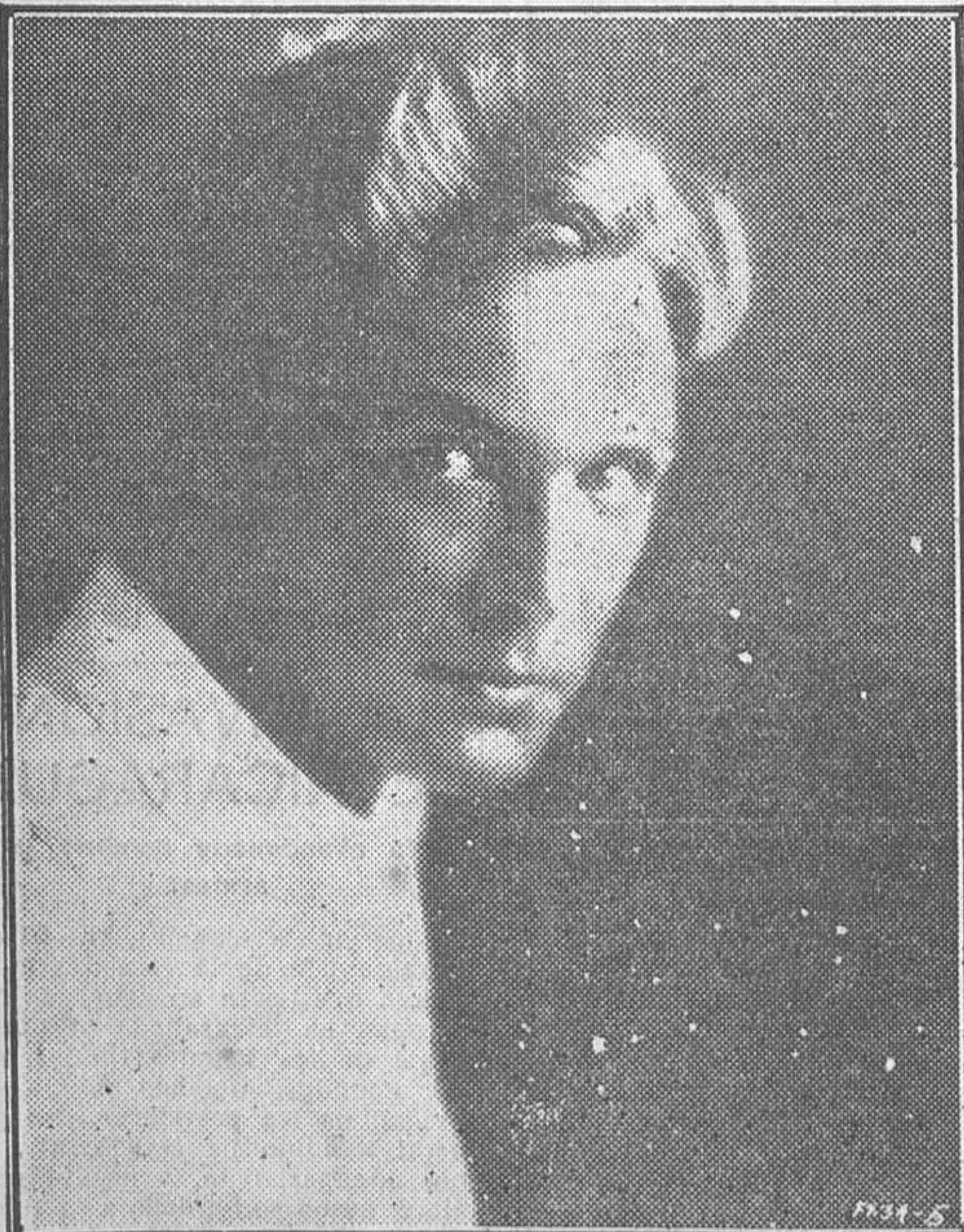
CHARLES MORTON, UNO DE LOS INTERPRETES DE LA GRAN PELICULA DE MURNAU «LOS CUATRO DIABLOS»

Lea usted todos los domingos el suplemento literario de LA LIBERTAD. Se publican en él las novelas más famosas