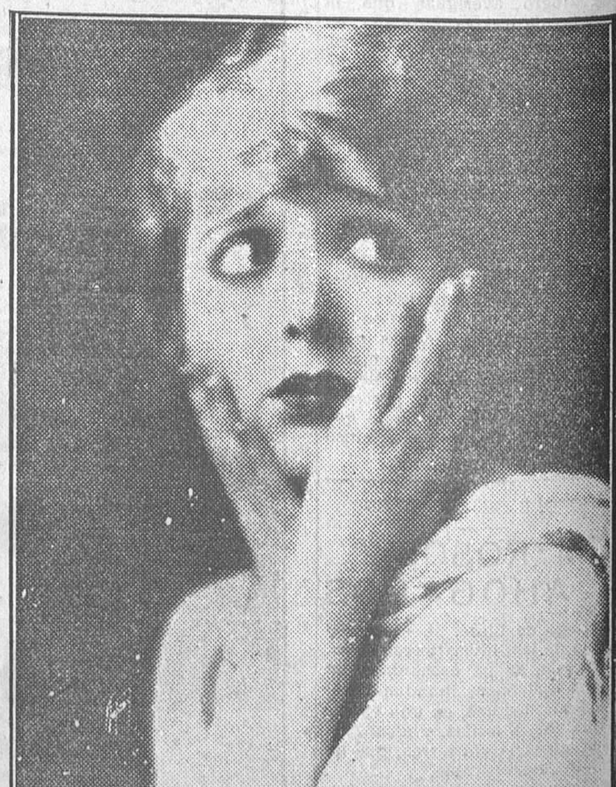
MADGE BELLAMY, ESTRELLA DE PRIMERA MAGNITUD DE LA CONSTELACION «FOX»