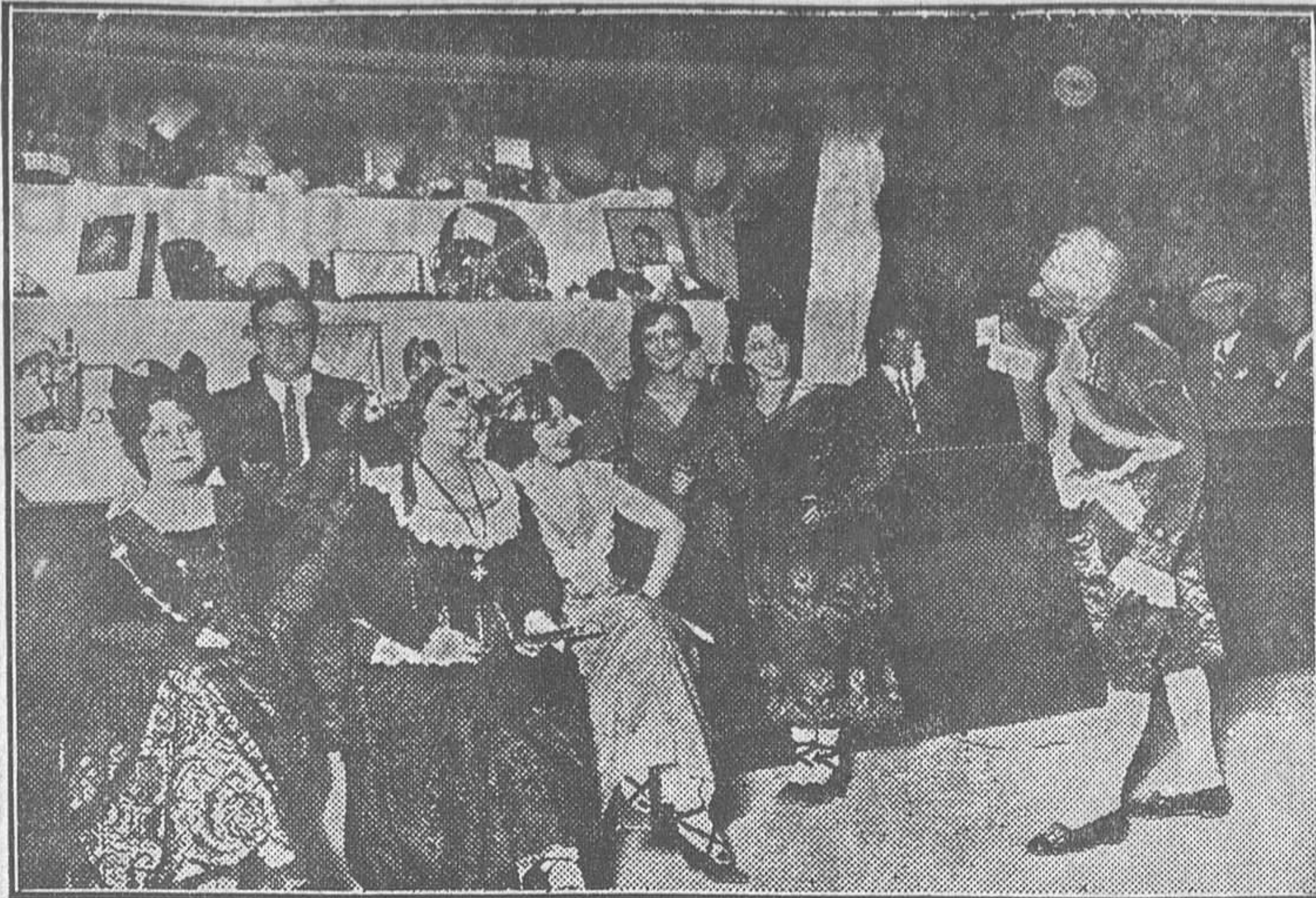
Uno de los puestos, servido por bellas artistas, en la verbena del Montepío de Actores, celebrada en el Retiro

—En El Tiemblo. Novillos de Zaballós, buenos, Saleri II y Dominguín Chico, muy bien en general, siendo aplaudidos. La cuadrilla cómica Charlot Zamorano,