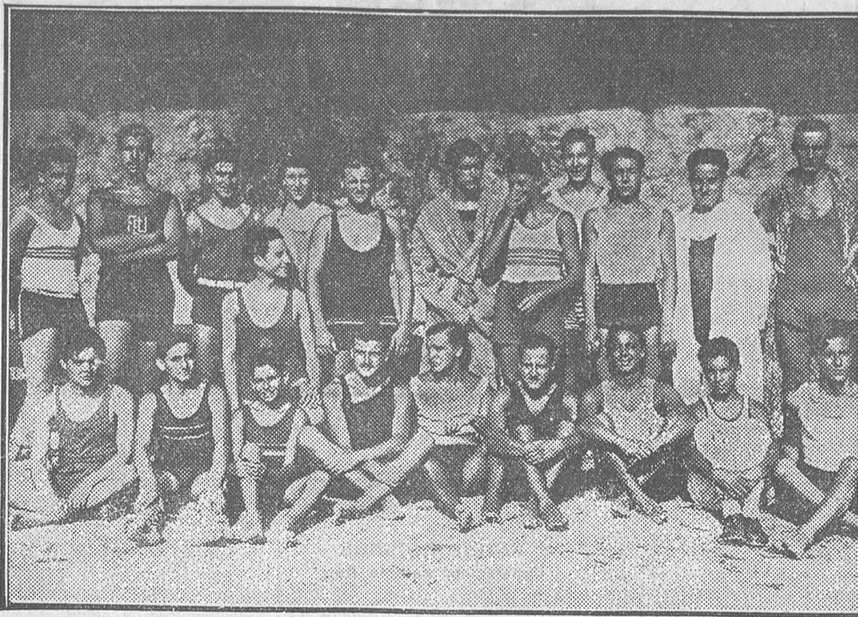
Nadadores que tomaron parte en el concurso de natación celebrado en el Retiro