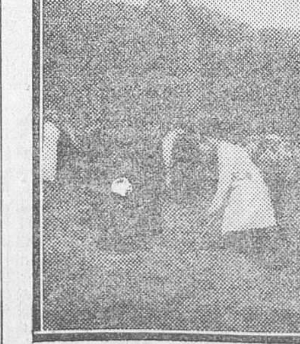
Los alumnos de la Escuela de Ingenieros Agrónomos y de la de Montes haciendo la plantación de los primeros árboles en los terrenos destinados a la Ciudad Universitaria.

La llegada del «Blas de Lezo» ha sido motivada por la necesidad de desembarcar a un oficial de dicho barco que se encuentra gravemente enfermo.