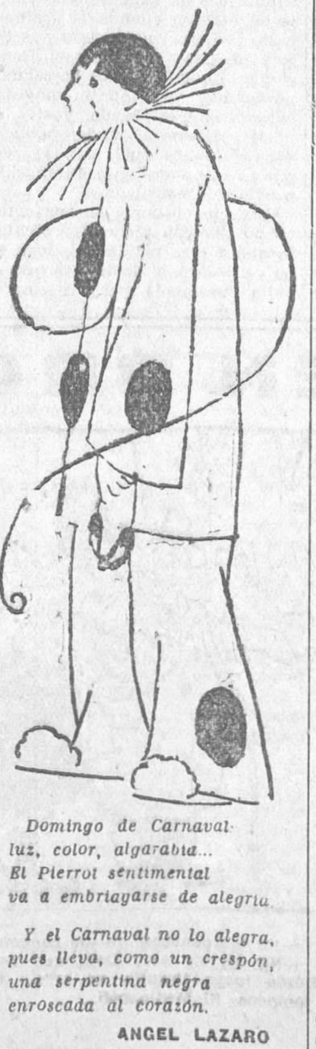
Domingo de Carnaval: luz, color, algarabía... El Pierrot sentimental va a embriagarse de alegría.

La labor del Instituto Cristóforo Colombo es merecedora de todo elogio, y ha de ser altamente beneficiosa para la aproximación intelectual y para la cultura de las dos naciones.