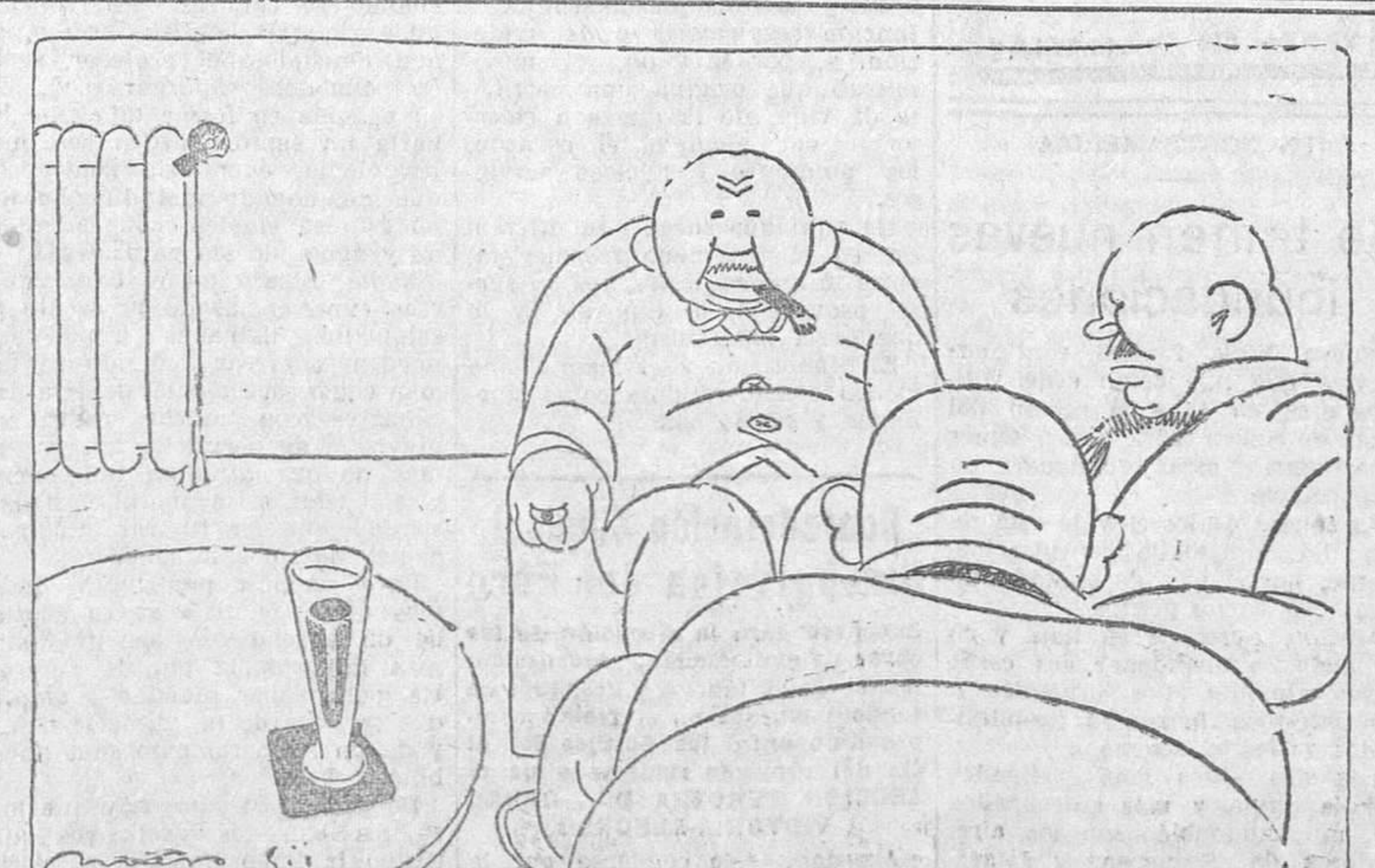
--¡Esos rusos!... ¡Pues no piden el desarme total, absoluto! --¡Qué bárbaros! ¡Qué salvajes!

Es una de las epidemias más fuertes que se han registrado.