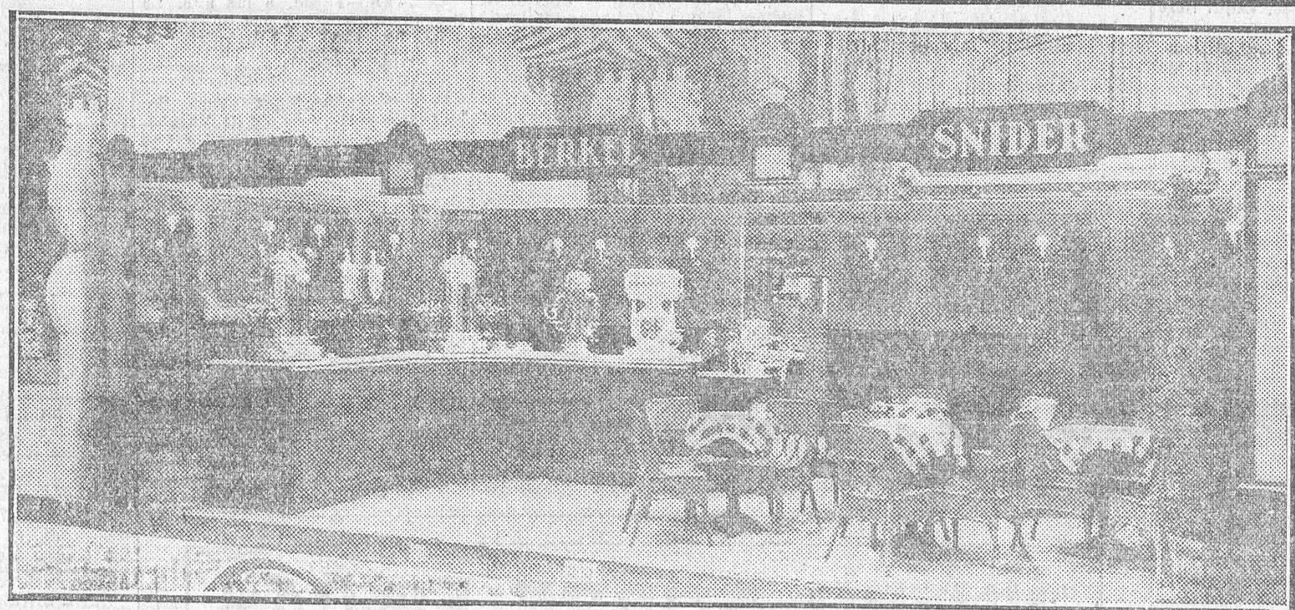
Un detalle de la instalación de la Casa R. OYARZUN Y COMPANIA, en la Exposición de la Industria Hotelera y de la Alimentación, recientemente celebrada en Barcelona