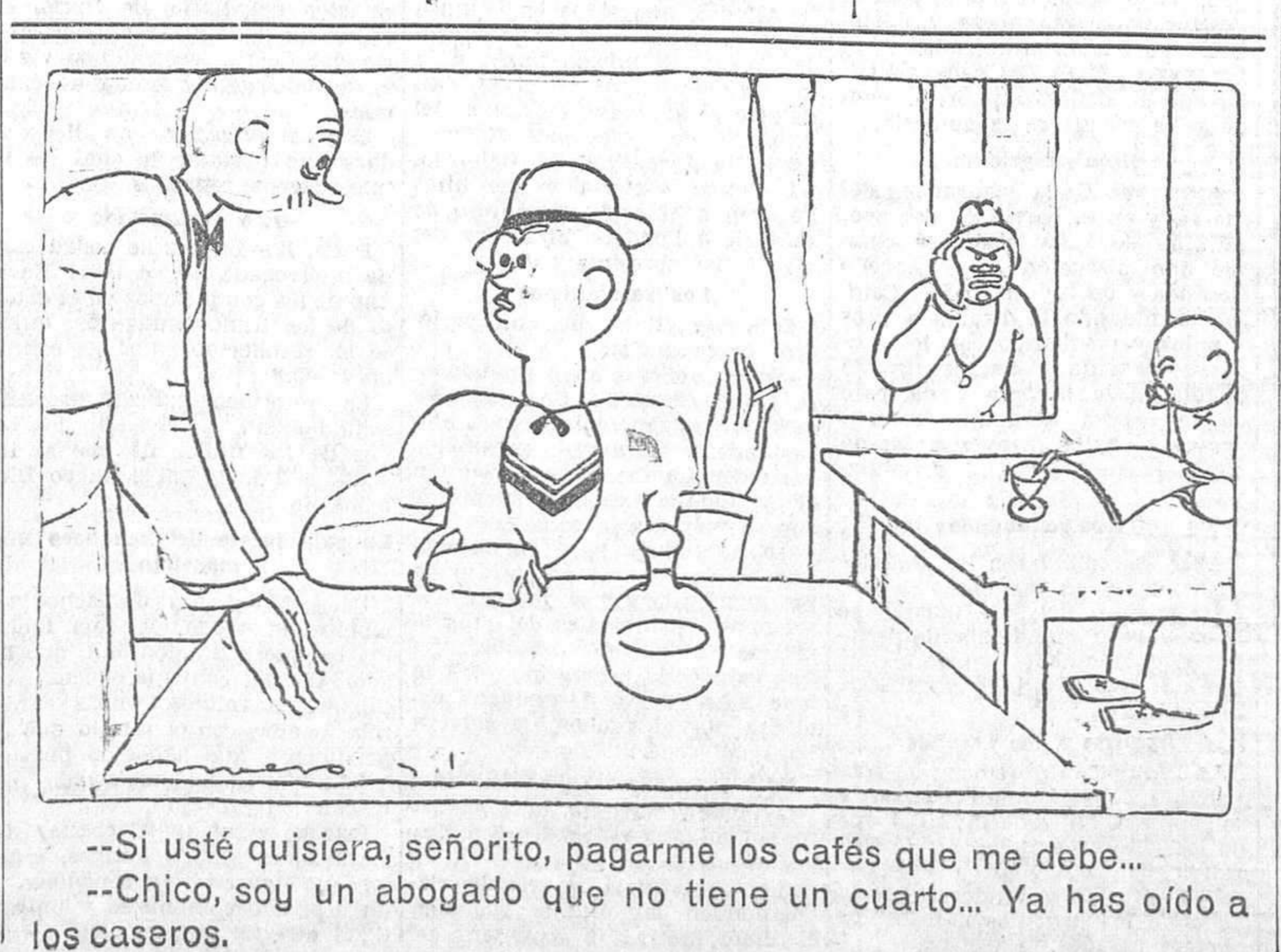
--Si usted quisiera, señorito, pagarme los cafés que me debe... --Chico, soy un abogado que no tiene un cuarto... Ya has oído a los caseros.