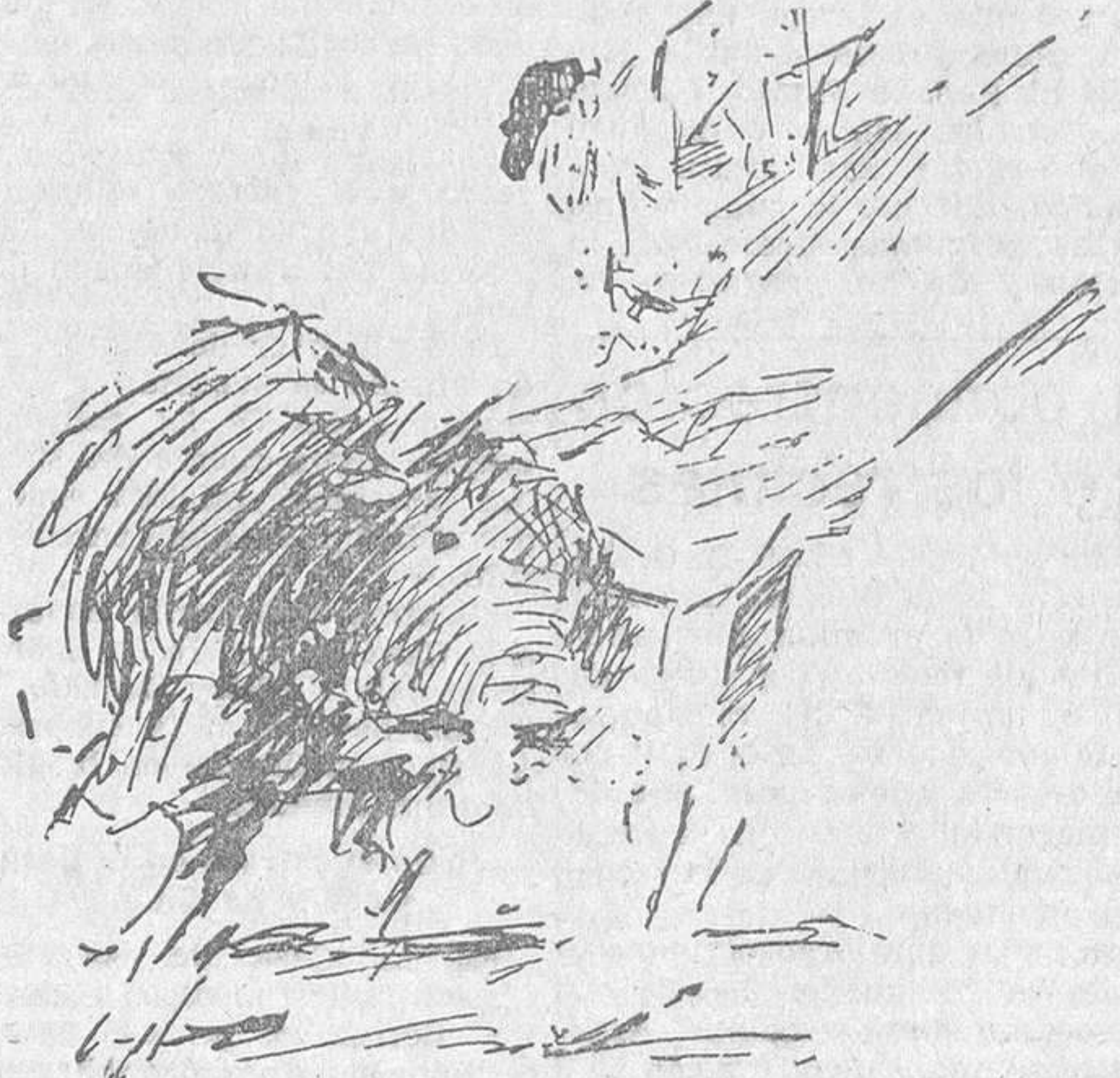
EL DOMINGO, EN MADRID.—Cagancho en media verónica al cuarto toro