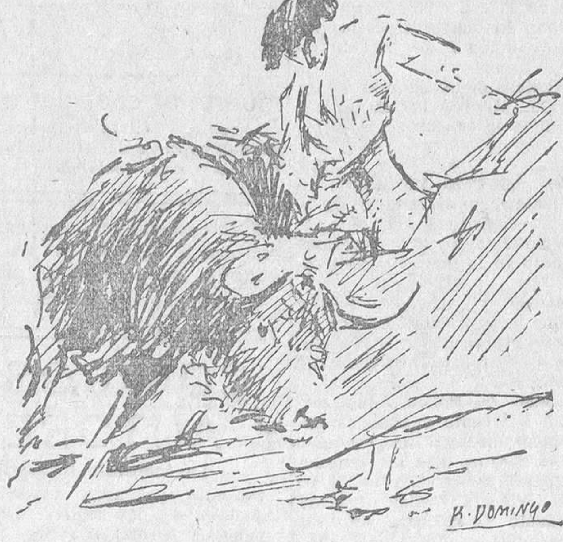
EL DOMINGO, EN MADRID.—Un lance de Rayito en el toro tercero