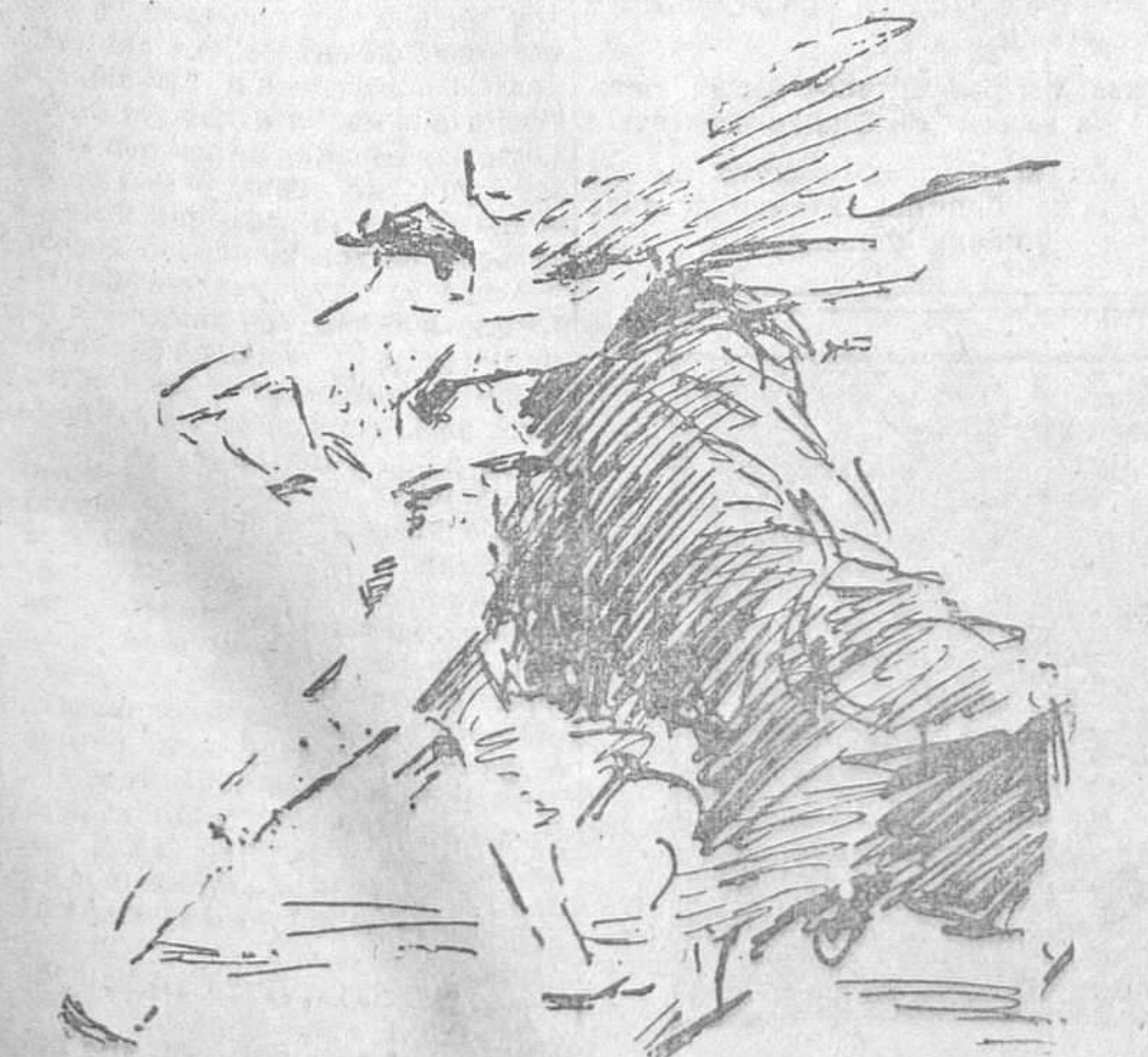
EL DOMINGO, EN MADRID.—Valencia II en un muletazo al quinto toro