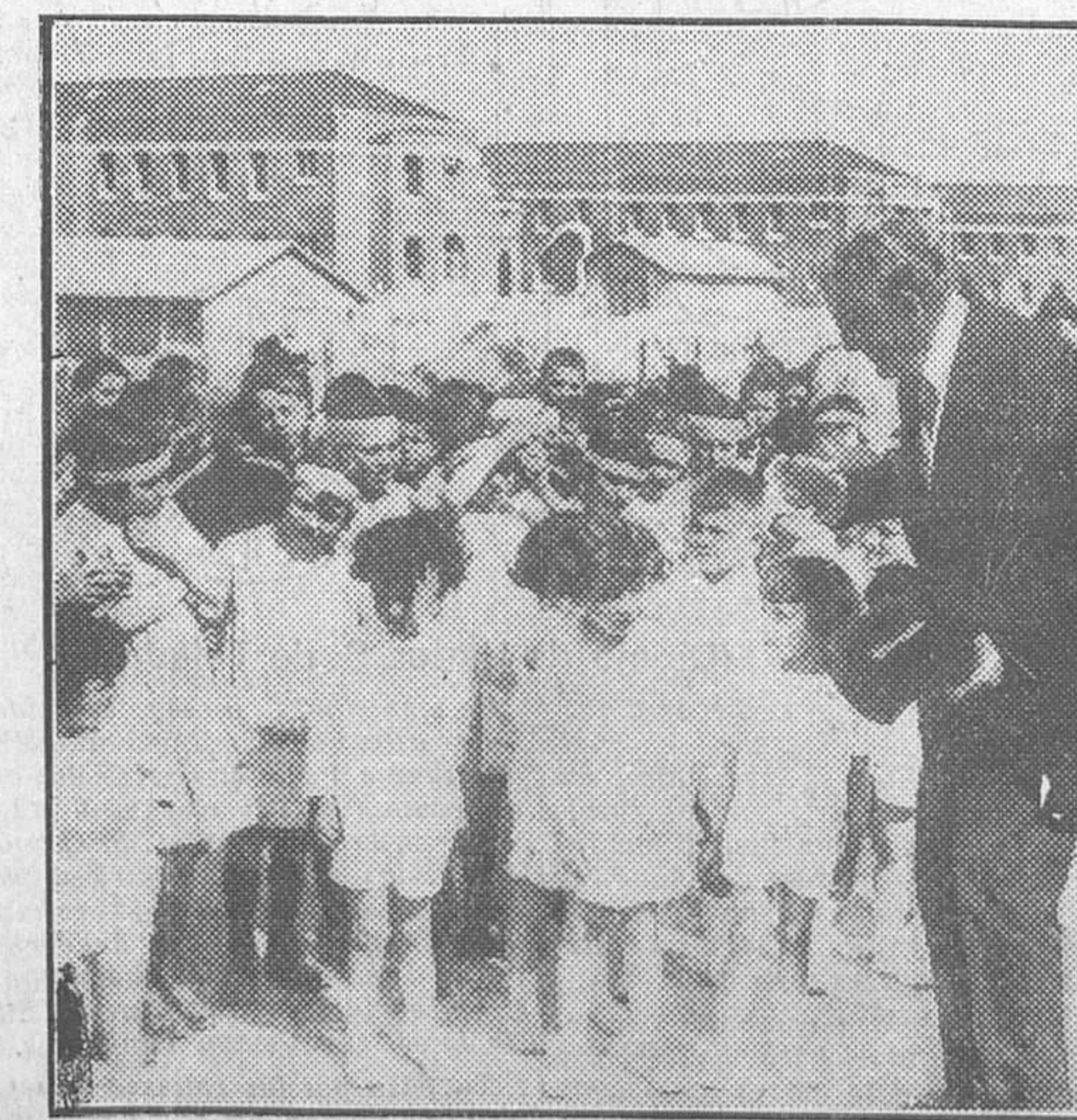
El embajador de los Estados Unidos en Francia, con los niños convalecientes del hospital americano de Reims, reconstruido

se puede llamar a Amsterdam incluso la hermana mayor de la antigua república de la plaza de San Marcos. Pero esto no puede pasar ni siquiera como tópico del turismo ni de los reclamos. Entre Amsterdam y Venecia no hay la menor semejanza, y Amsterdam tiene los suficientes atractivos para ser conocida y visitada sin necesidad de apoyarse en una fama ajena. Tiene rincones Amsterdam, con sus aguas silenciosas y sus árboles que a veces inclinan su cabeza hasta tocar la tranquila superficie de cristal, que son algo único en el mundo. Además, con el mismo motivo que se achaca este parentesco con la ciudad italiana, se podría decir de toda Holanda que era una Venecia de siete millones de habitantes. Porque todo este bello, rico y activo país está surcado de canales, de arroyos, de acequias. Porque, y esto es más importante, en Holanda se está en lucha constante, infatigable y victoriosa contra el agua, que busca su nivel, contra el mar, que busca las naturales expansiones a que cree tener derecho, aunque ya debe mostrarse escéptico ante el dominio de estos colosos de la ingeniería, que llegan a