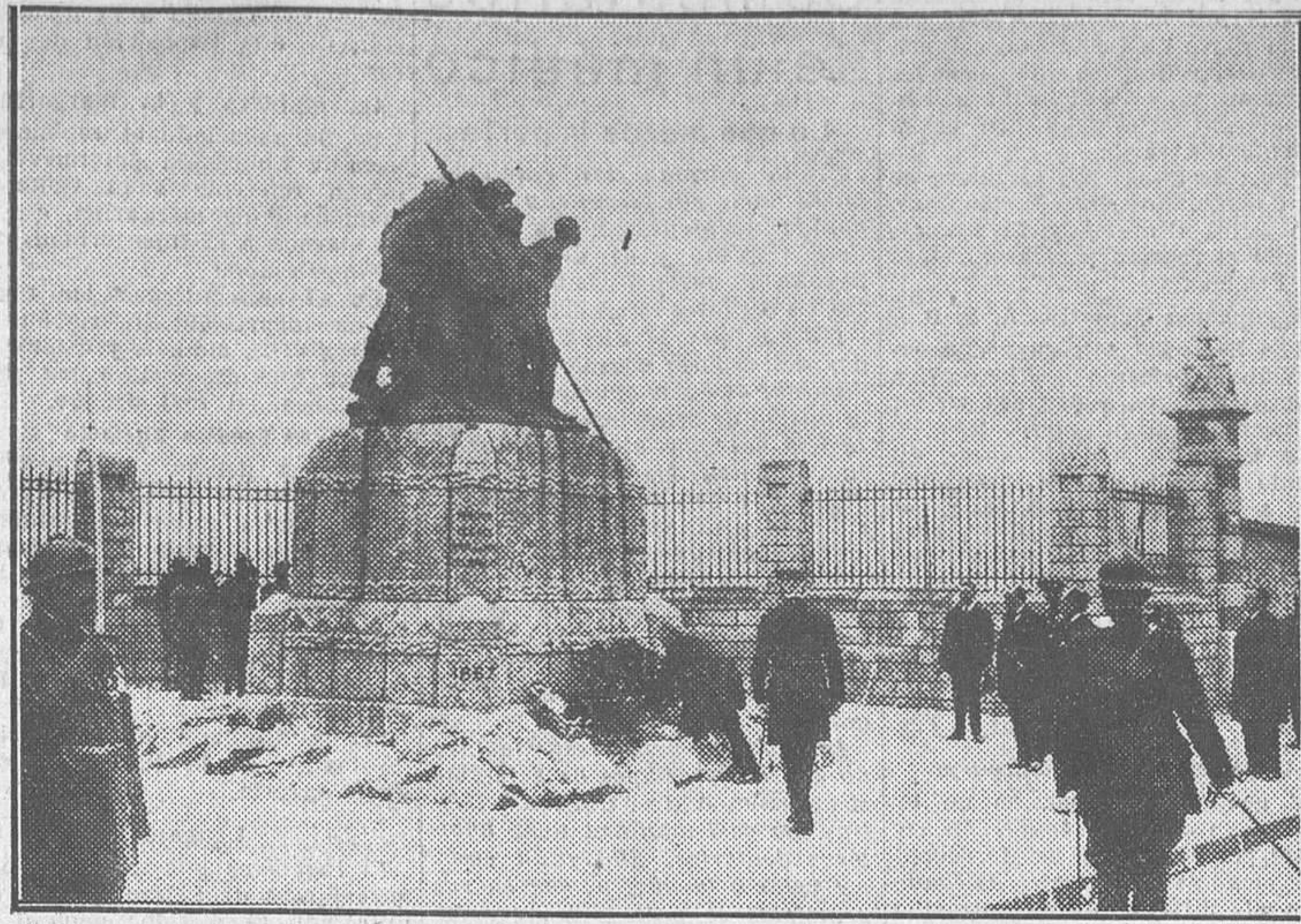
El presidente de la República francesa depositando una palma al pie del monumento erigido en Reims a las tropas negras que combatieron en la gran guerra

Sin embargo, según parece, en alguna provincia los agricultores se muestran reacios a prestar su declaración por haber corrido entre ellos la especie de que de ella se seguirán disposiciones de carácter fiscal. Esta Dirección general se cree en deber de negar todo fundamento a tales rumores, y para demostrar su inverosimilitud le basta recordar que los agricultores y ganaderos no consiguan en su declaración ni el carácter de propietarios del ganado y fincas que explotan o aprovechan, ni el número y situación de éstas; las Juntas locales sólo comunican a las Secciones agronómicas la total extensión sembrada de cada planta cultivada y el número de cabezas de ganado