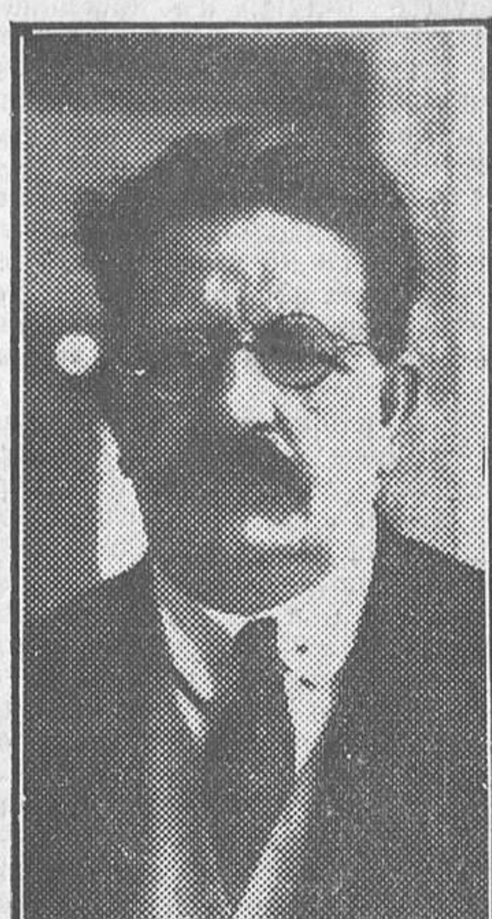
El gran poeta Díaz Mirón, legítima gloria de las letras americanas, que acaba de morir en Méjico

La Sociedad Española de Librería, Ferraz, 21, servirá en el acto cuantos pedidos de ejemplares se le hagan del nuevo libro de Antonio Zozaya, «Ideogramas», el Libro del Homenaje, costado por los lectores de Zozaya. Edición de lujo. Preciosa encuadernación. Cinco pesetas ejemplar.