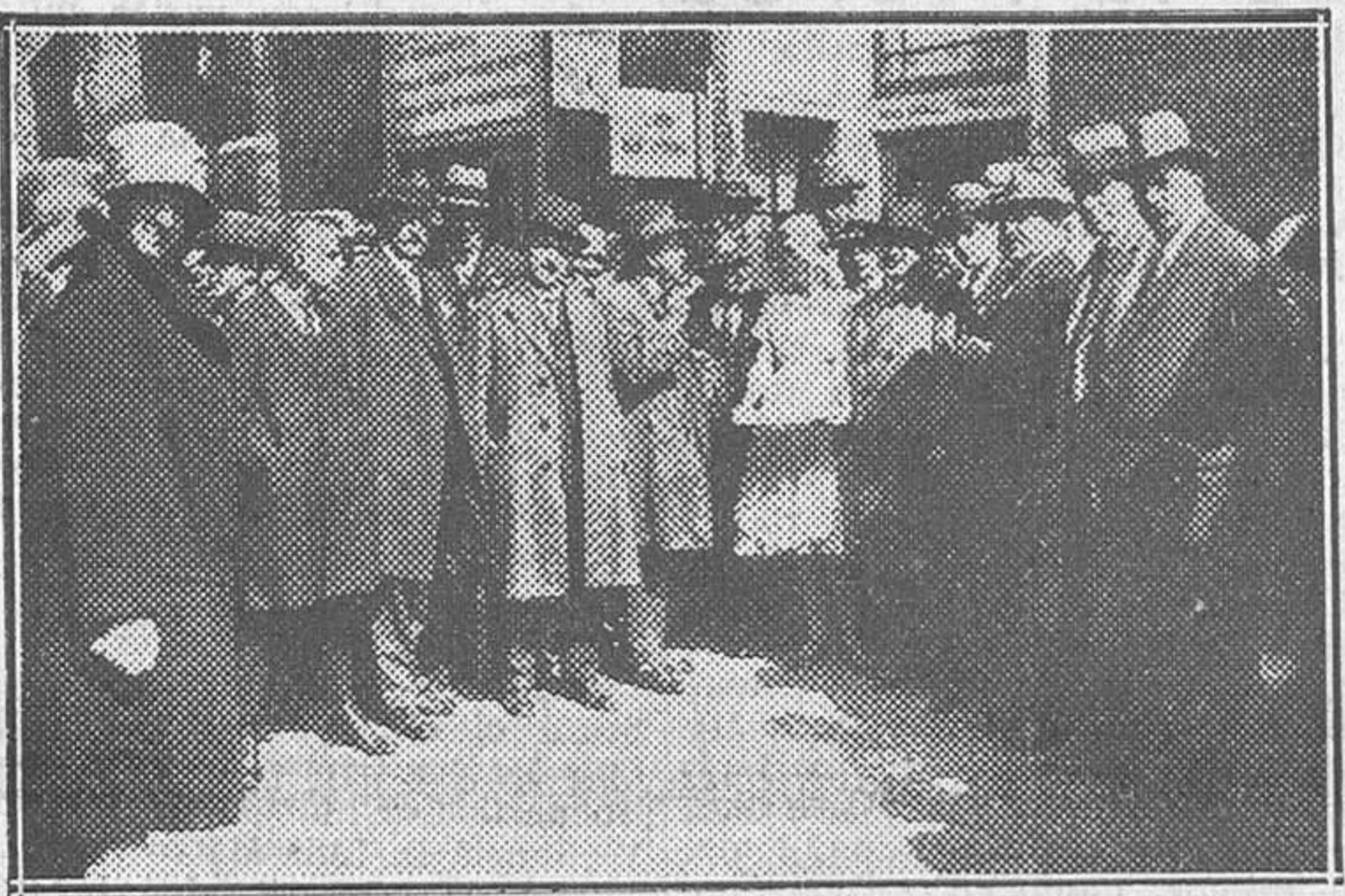
Grupo de escritores y periodistas extranjeros en Amsterdam, invitados por el Sindicato de Turismo y la Prensa holandesa para visitar Holanda

bitantes de la gran ciudad, capital de Holanda, contra lo que creen casi todos, confundiendo la residencia oficial del Gobierno y la reina en La Haya con la capital de la nación—que era la Venecia del Norte. Si en cuanto se ven canales en medio de las calles se va a pensar en la inmortal ciudad edificada sobre las lagunas del Adriático, claro que