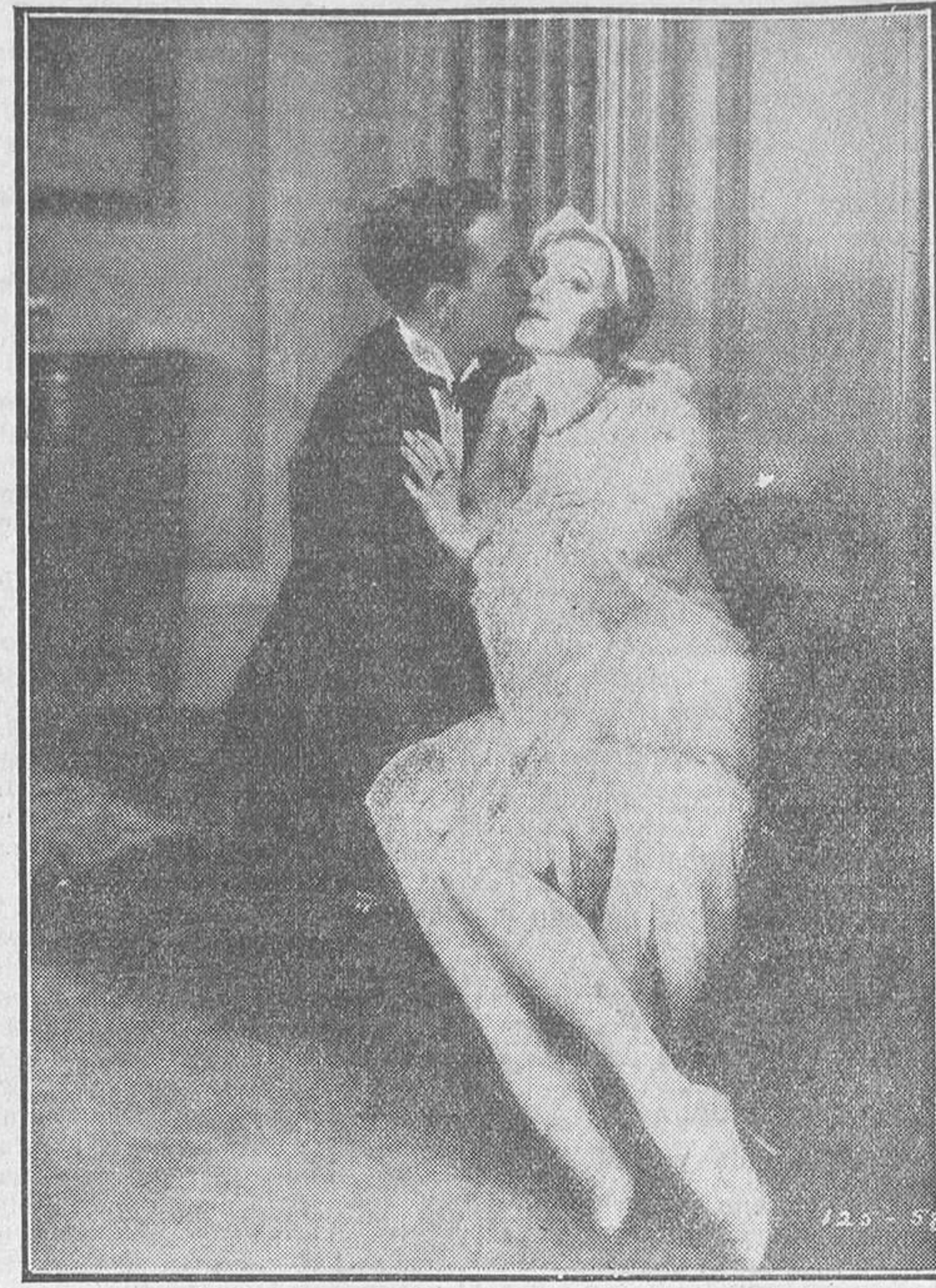
GRETA NISSEN, SUGESTIVA E «INGENUA», ENSAYA CON EL AFORTUNADO JACK MULHALL UNA ESCENA DEMASIADO CINEMATOGRAFICA PARA UNA DE LAS GRANDES PRODUCCIONES QUE ADMIRAREMOS EN LA PRÓXIMA TEMPORADA

Un promedio de 50.000 pesos diarios es lo que se calcula que pagan por demandas de indemniza-