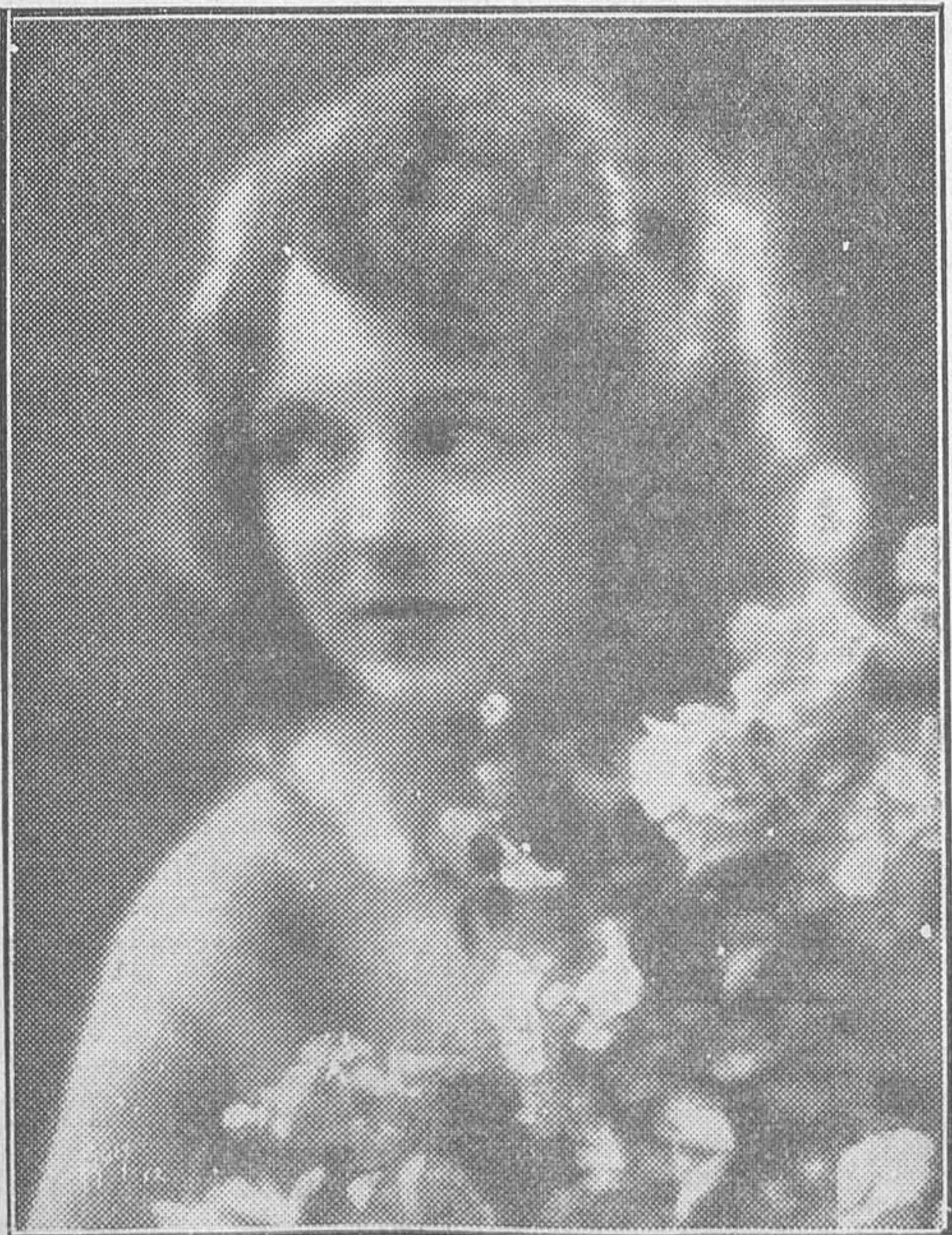
JANET GAYNOR, LA INIMITABLE ESTRELLA DE LA FOX, PROTAGONISTA QUE EN «LOS CUATRO DIABLOS» SUPERA SU ÉXITO DE «AMANECER»

«Pepita Jiménez» es una novela que al desposeerla de la cuidada forma valeriana temíamos que la acción no fuera bastante para mantener vivo el interés de la película, peligrosísima en su adaptación, por ser la obra una novela epistolar. De aquí el éxito de la película al ser adaptada por Carrasco tan acertadamente que, sin perder su forma, ha sabido sustituir todas las bellezas de expresión literaria por la belleza de los fondos e interiores de perfecto sabor de la época y lograr de