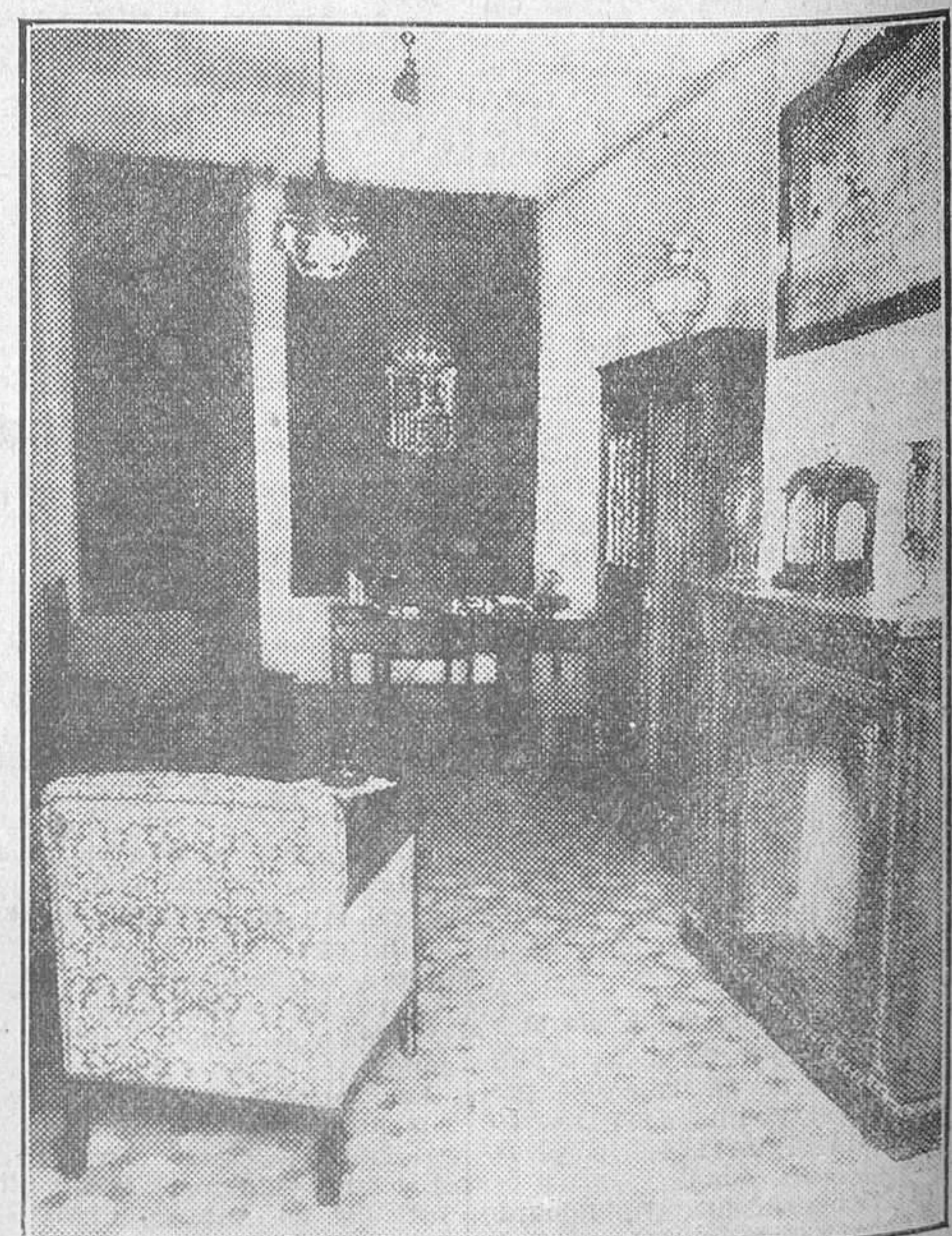
DESPACHO PRESIDENCIAL DE LA UNION GENERAL CINEMATOGRAFICA ESPAÑOLA, EN EL DOMICILIO SOCIAL INAUGURADO RECIENTEMENTE