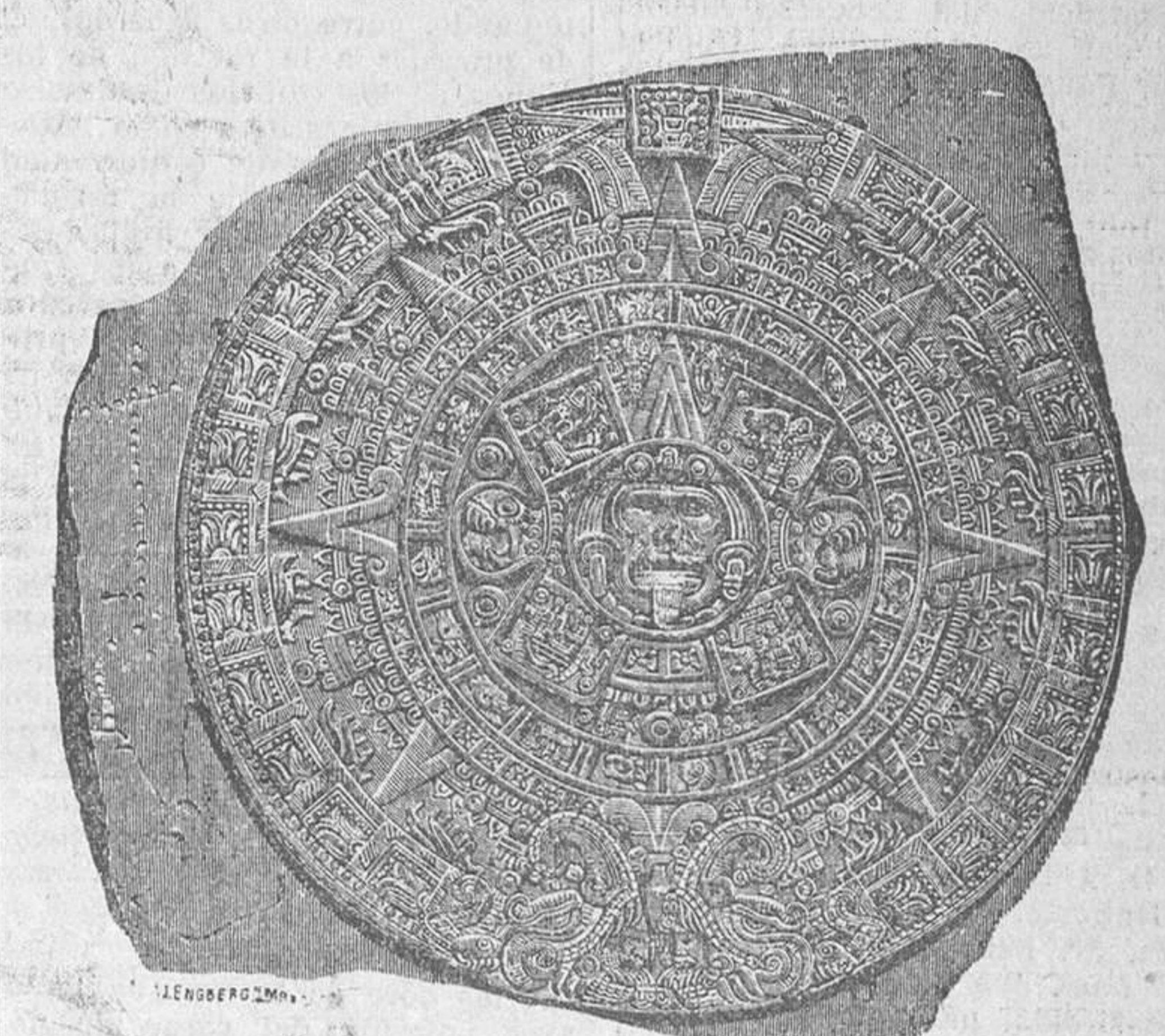
MEJICO.—El calendario Azteca

El pulque es épico, sentimental y agudo. Sin el pulque no se habría hecho la revolución. El pulque, unido al ideal, ha dado una siembra de héroes al Virreinato, al Imperio y a la República. El trabuco del patriotismo y la espada de la libertad le deben al pulque las mejores rosas de oro. El pulque ha echado abajo a Porfirio Díaz, negro patrón cimentador de esclavos. El pulque pone alegría en la tristeza del indio, agudeza en la vaguedad del pensamiento, jocosidad en el rostro petrificado, impenetrable, de nurralla china. El pulque ha hecho florecer el ideal revolucionario. Pancho Villa, el único caudillo enemigo del pulque y del cigarro, no fué nunca un programa. No llevaba dentro la llama nativa. Le faltaba la levadura del pulque. Ya decía él que era como el desierto. Efectivamente. Le faltaba el ensueño, el romanticismo, la exaltación, el pulque. Guerraba por guerrar. Era la astucia. No era la epopeya. No era el arresto. Pueblo sin arresto, pueblo difunto. Como la mujer sin pasión: un maniquí. El pulque es el único peli gro que encuentra la invasión norteamericana. El petróleo es la codicia. El pulque es el terror. Quitadle el pulque al indio, y tendremos en casa la visita del barbero. El pulque ha evitado que el yanqui llegara a la meseta. Si se estacionó en Veracruz, acampando