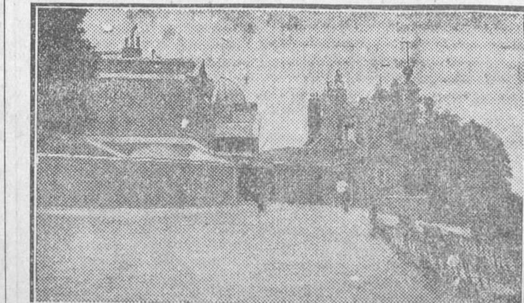
El Observatorio de Greenwich. En su fachada se ve la esfera del reloj cuya hora seguimos en España