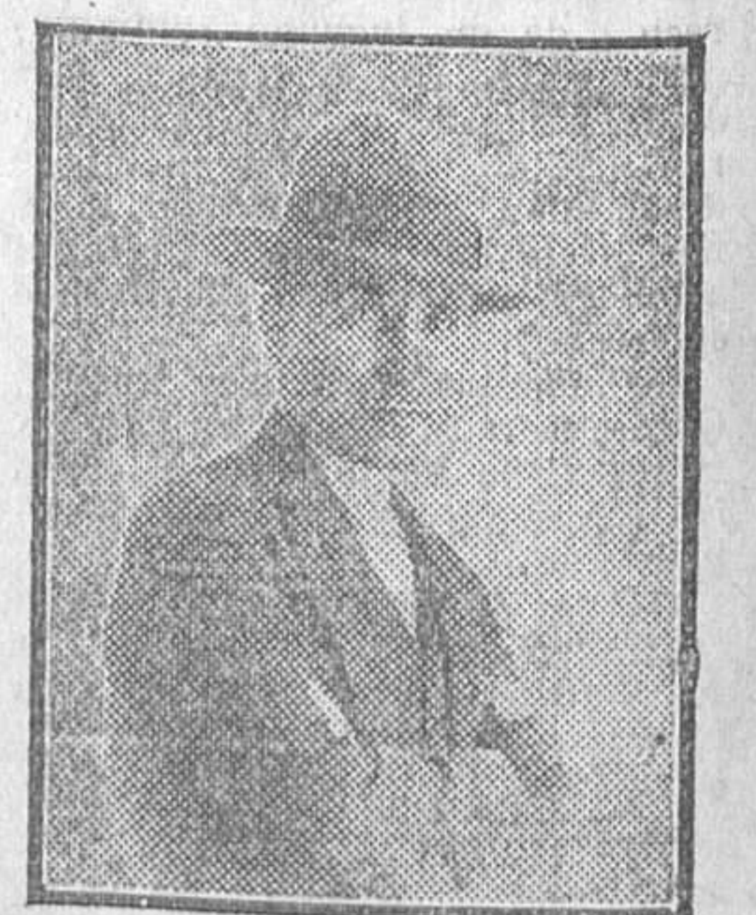
El notable escritor Federico Navas, que acaba de publicar un interesante libro titulado «Las Esfinges de Tala o Encuesta sobre la crisis del Teatro».