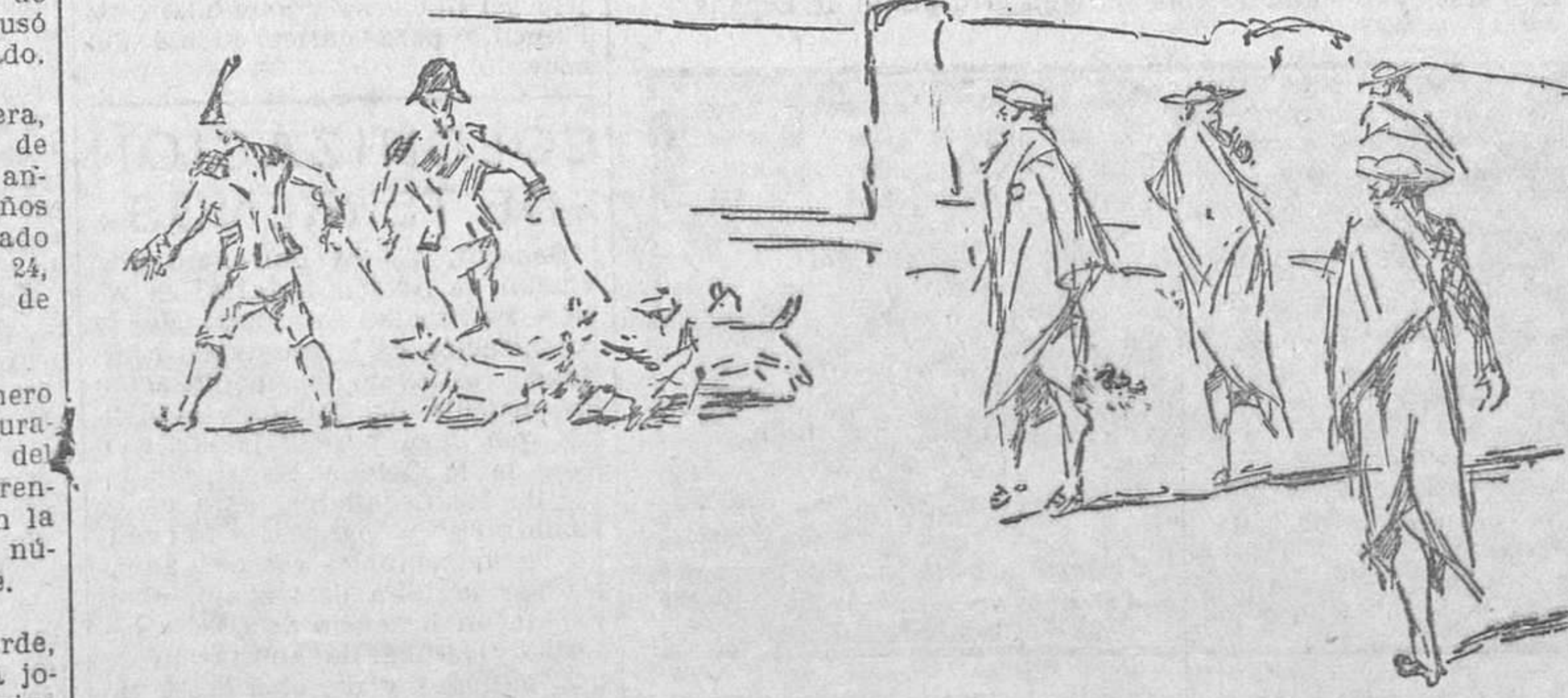
Detalle de uno de los desfiles goyescos en la plaza de toros de Zaragoza (Apuntes de Vigayar)

ANTONIO DE LA VILLA Zaragoza y Abril 1928.