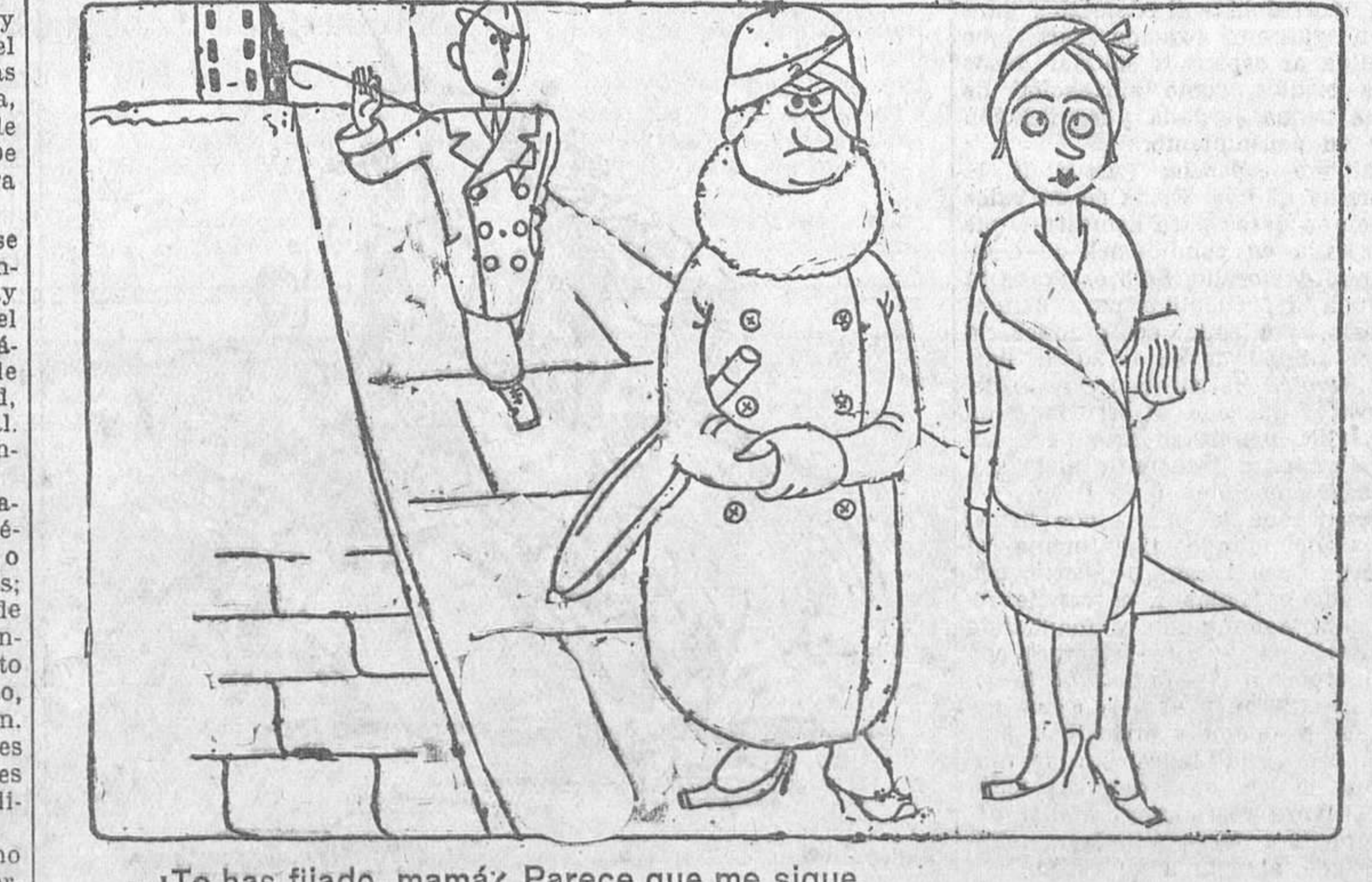
--¿Te has fijado, mamá? Parece que me sigue. --Disimula, niña. Me escama ese «fruta». Bueno, y es que de tanto oír hablar de Goya todos me resultan unos frescos.

Que se supone hay un hecho delictivo? Que lo averigüen, por que medios de identificación se obran, a nuestro juicio. Mas, si no hay bastantes, espe-