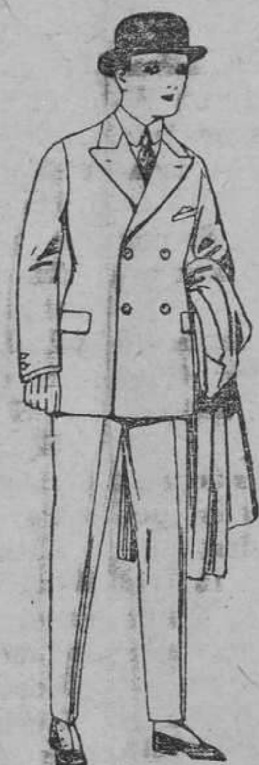
Trajes de patén, vicuña, etc., para niños y jovencitos de 10 á 16 años. De pesetas 32 á 85.