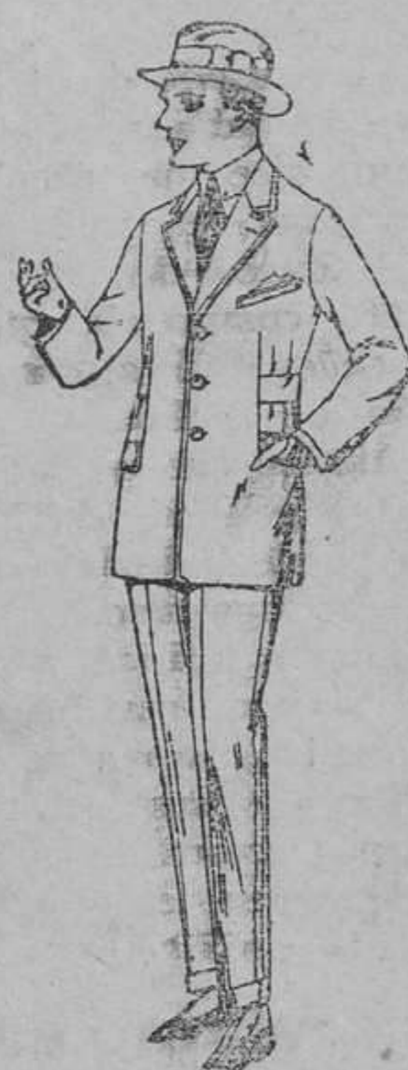
Trajes de patén, vicuña ó jerga, forma sport, para niños y jovencitos de 10 á 16 años. De pesetas 40 á 85.