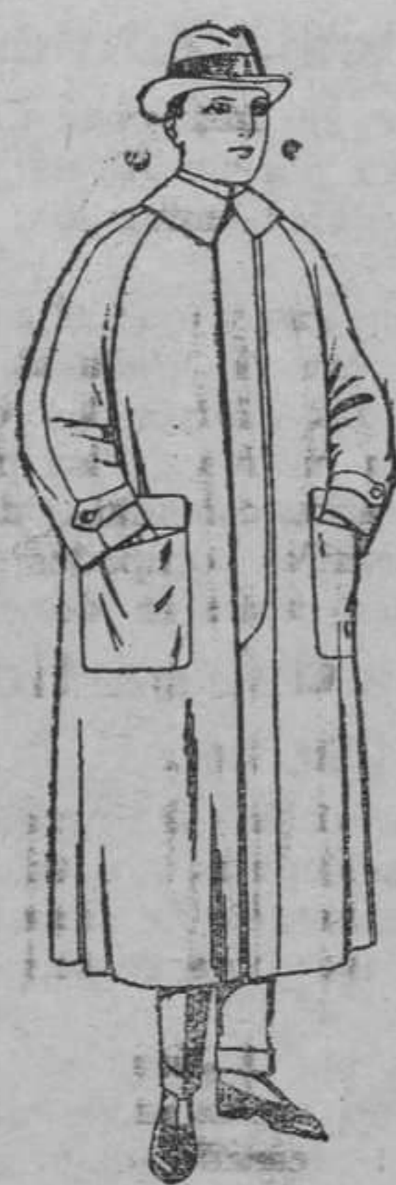
Impermeables raglán, en azul y colores. De pesetas 32 á 270.