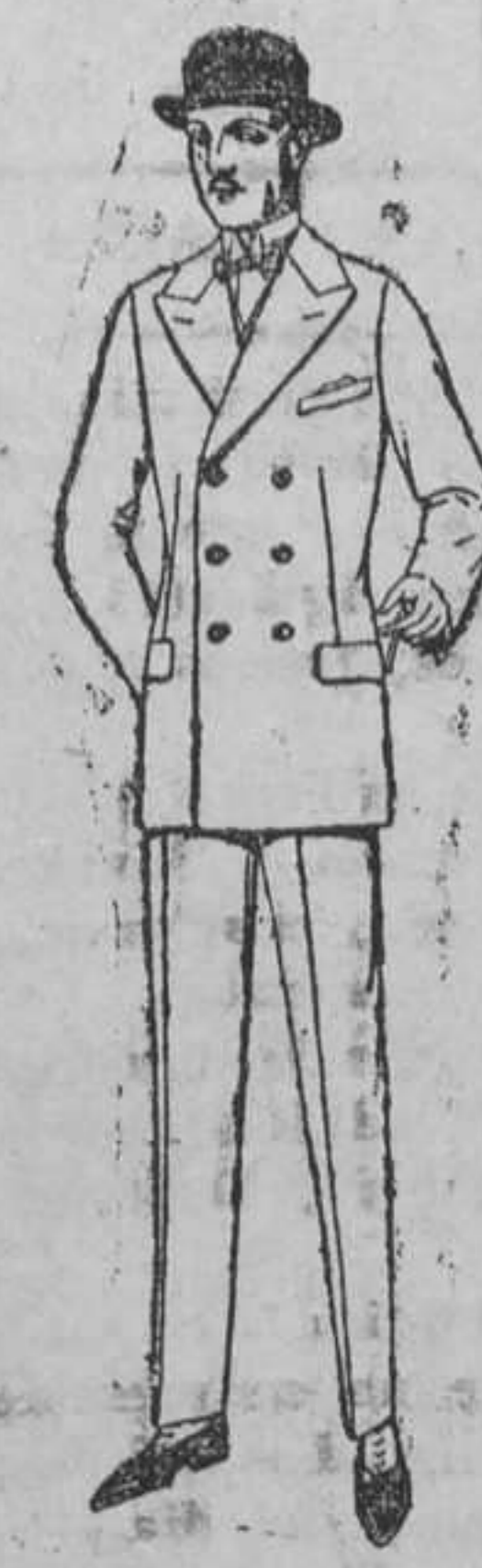
Trajes de melton, cheviot, estambre, vicuña ó jerga. De pesetas 50 á 170.