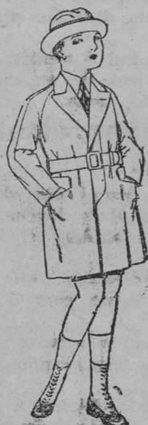
Gabanes de patén, gamuza, etcétera, para niños y jovencitos de 10 á 16 años. De pesetas 30 á 75.

ROPAS confeccionadas para Caballero, Señora, Niño y Niña