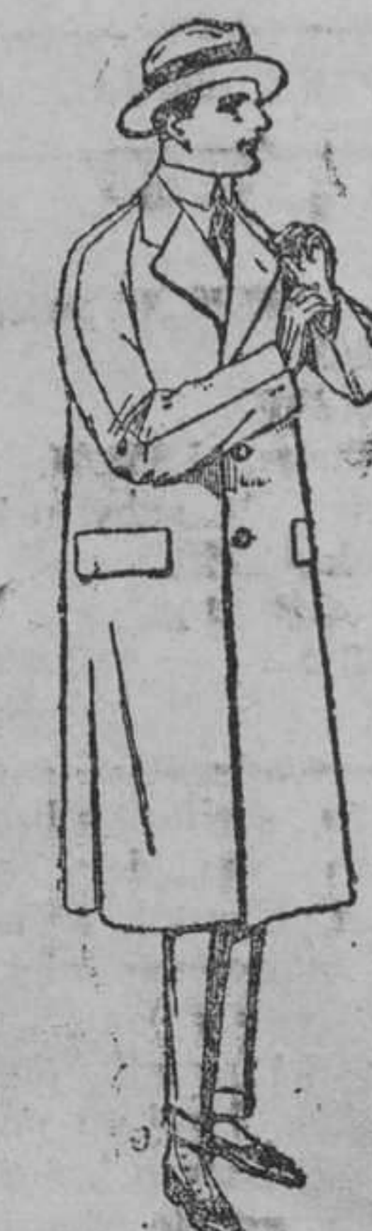
Gabanes raglán, de patén, melton ó cheviot, con forro de seda ó satén.