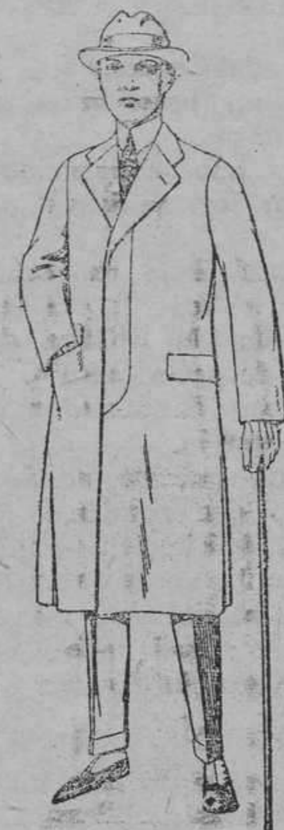
Gabanes de cheviot, gamuza, patén, etc. De pesetas 45 á 140.