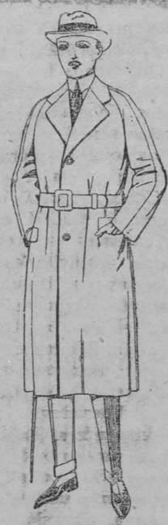
Gabanes raglán de patén, gamuza ó cover. De pesetas 75 á 200.

Sucursales: Madrid, Barcelona, Alicante, Almería, Bilbao, Cádiz, Cartagena, Gijón, Granada, Málaga, Palma de Mallorca, Santander, Sevilla, Valladolid, Zaragoza