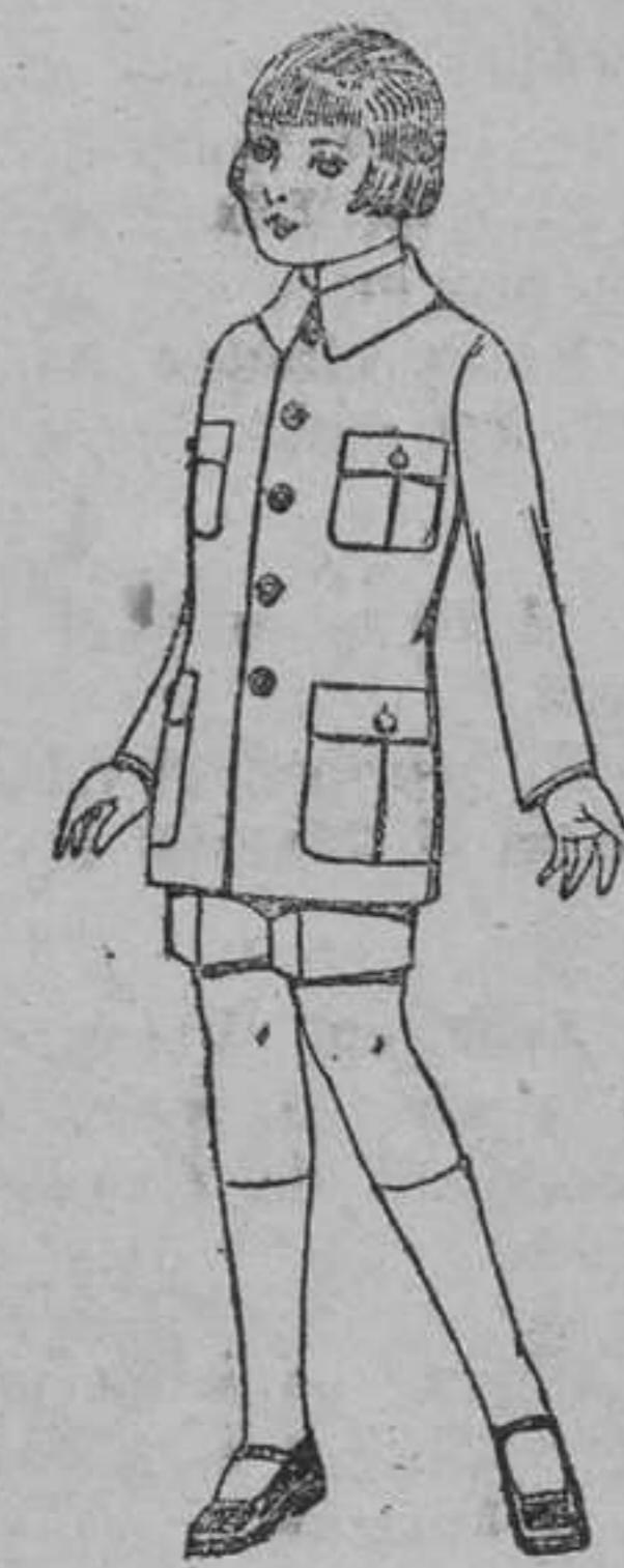
Trajes de patén, modelo sport para niños de 4 á 9 años. De pesetas 22 á 35.

Precio fijo - ( - Pidase catálogo general - ) - ( Ventas al contado