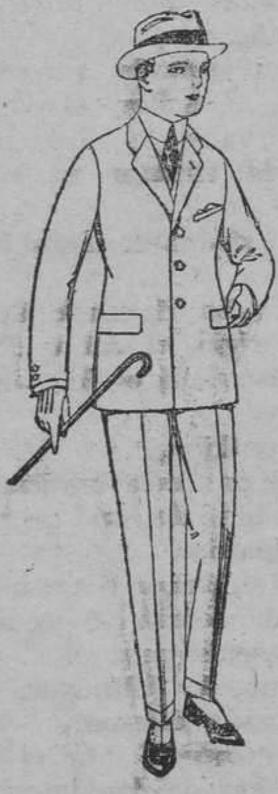
Trajes de patén, vicuña ó jerga, para niños y jovencitos de 10 á 16 años. De pesetas 30 á 85.