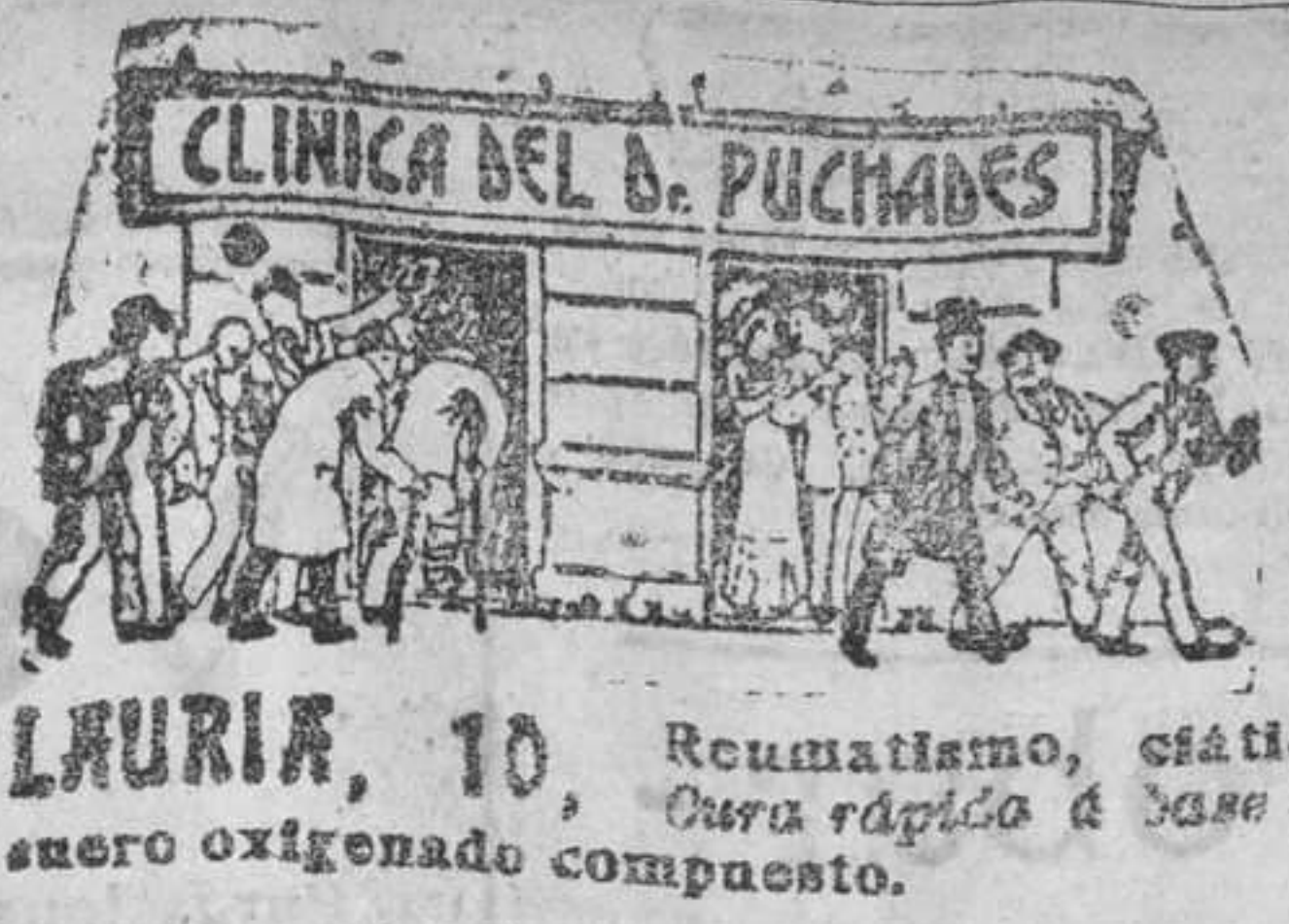
Lauria, 10. Reumatismo, cistitis, cura rápida a base de suero oxigenado compuesto.