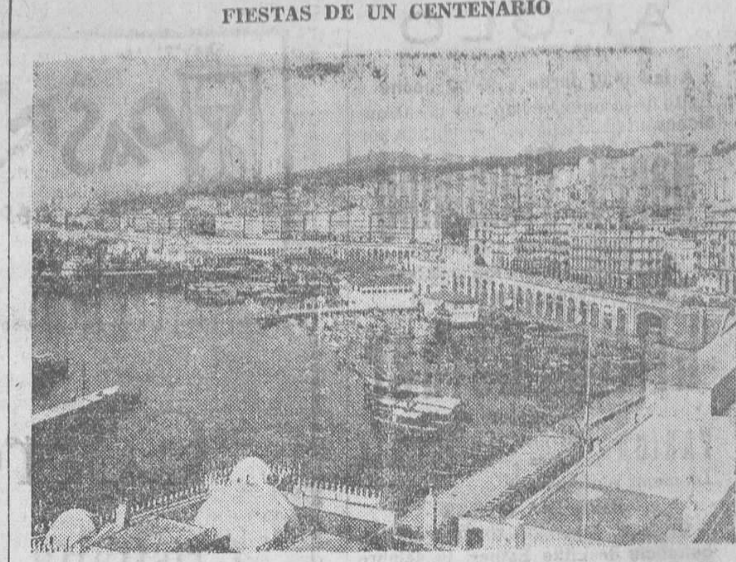
La hermosa ciudad de Alger, se dispone a celebrar con grandes fiestas su Centenario

Pasada la impresión de horror de los primeros instantes, se vio que todos los refugiados estaban heridos. El más animoso, corrió al