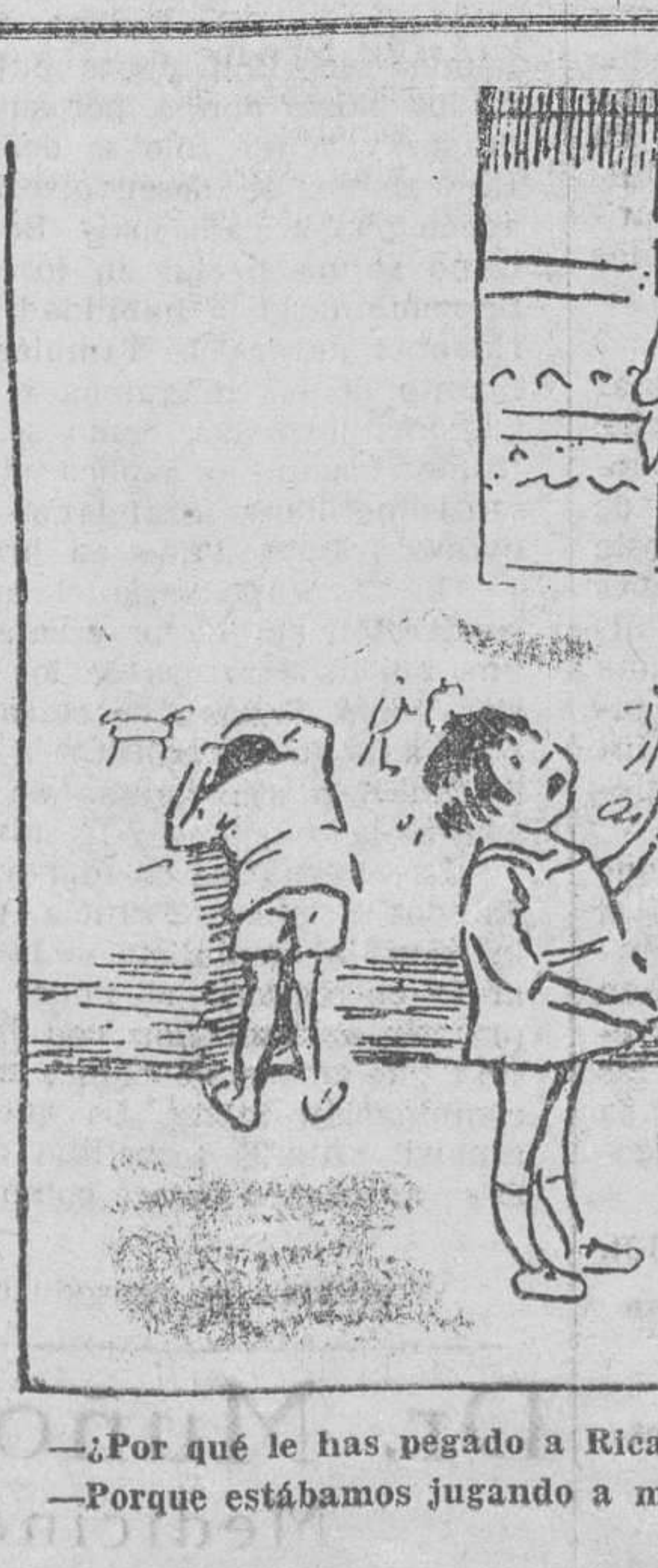
«¿Por qué le has pegado a Ricardito? — Porque estábamos jugando a marido y mujer...»