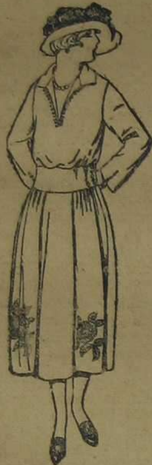
Vestidos de sarga inglesa, estambre, etc., en negro, azul y color, adornos bordados a mano. De ptas. 100 a 140.