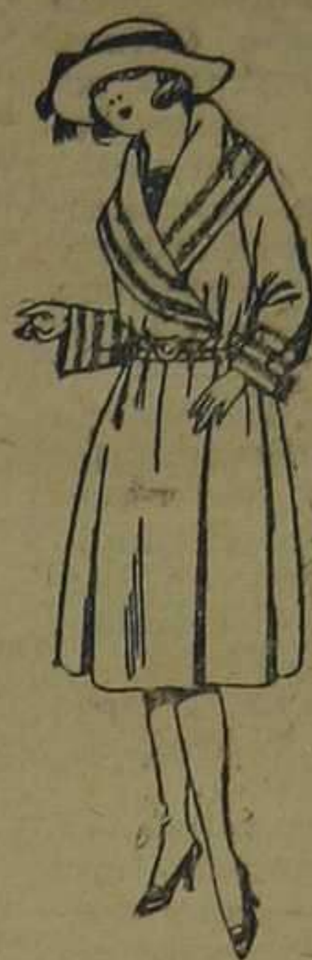
Abrigos de terciopelo de lana, ratina, etc., en negro, azul y color, adornos pespunte seda. De ptas. 55 a 95.