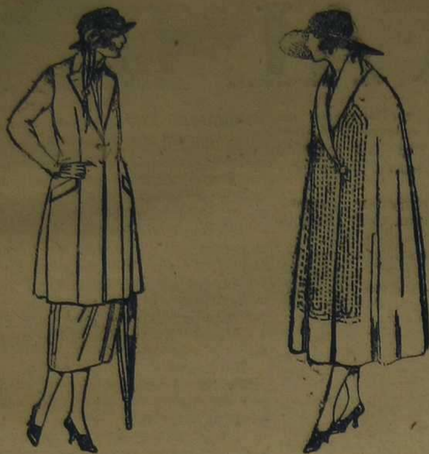
Trajes de sarga inglesa, cheviot, en negro, azul y color. De ptas. 140 a 200.

SUCURSALES: Madrid, Barcelona, Alicante, Almería, Bilbao, Cádiz, Cartagena, Gijón, Granada, Málaga, Palma de Mallorca, Santander, Sevilla, Valladolid y Zaragoza.