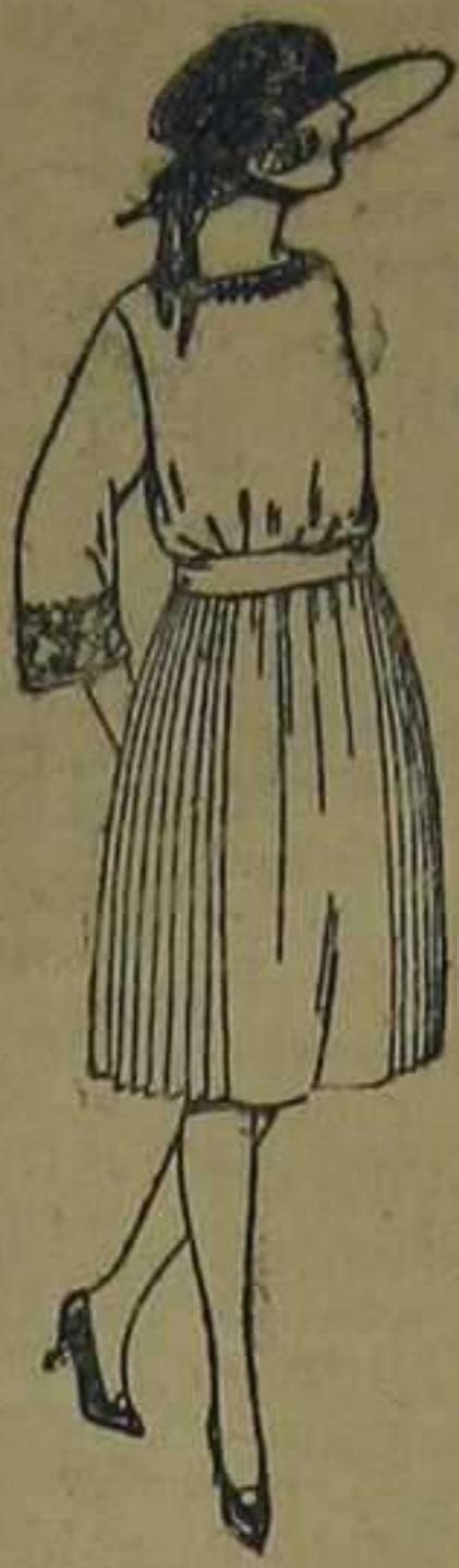
Vestidos estambre, lanilla, etc., en azul y color, adornos bordados. De ptas. 65 a 90.