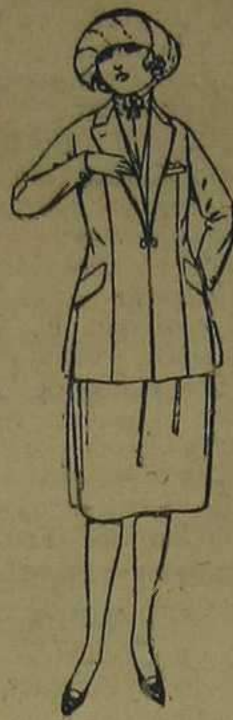
Trajes de sarga inglesa, gabardina, etcétera, en azul y color. De ptas. 85 a 100.