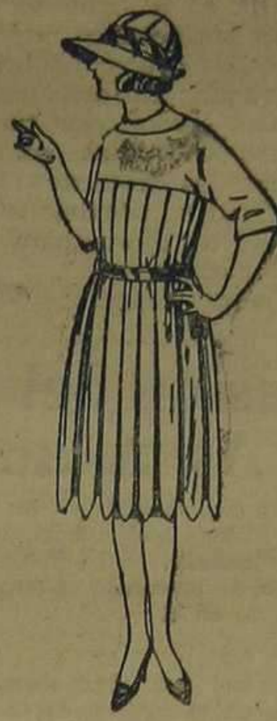
Vestidos de sarga inglesa, gabardina, etcétera, en azul y color. De ptas. 60 a 80.