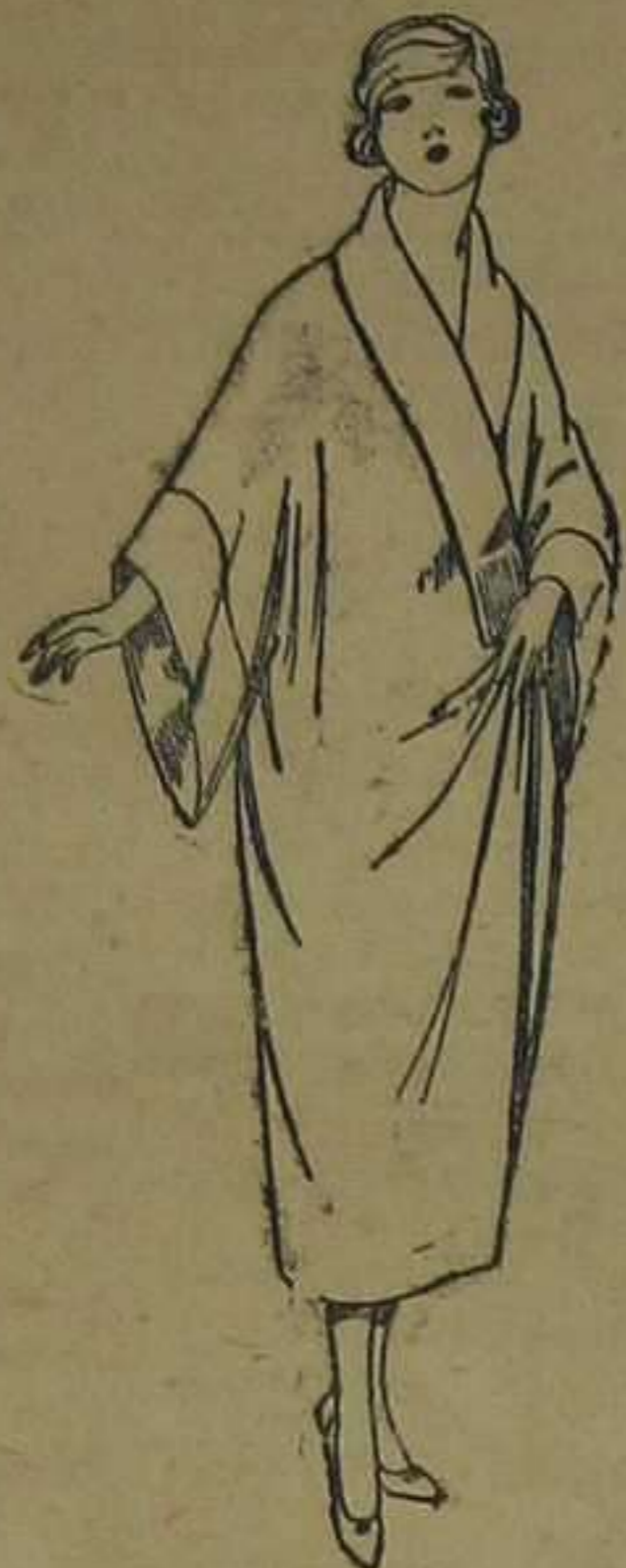
Batas de franela de lana, adornos de diferentes colores. De pesetas 30 a 45.