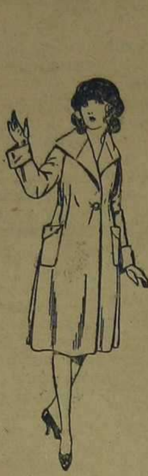
Abrigos de gamuza, ratina, etc., en azul y color, para jovencitas de 12 a 13 años. De ptas. 15 a 50.