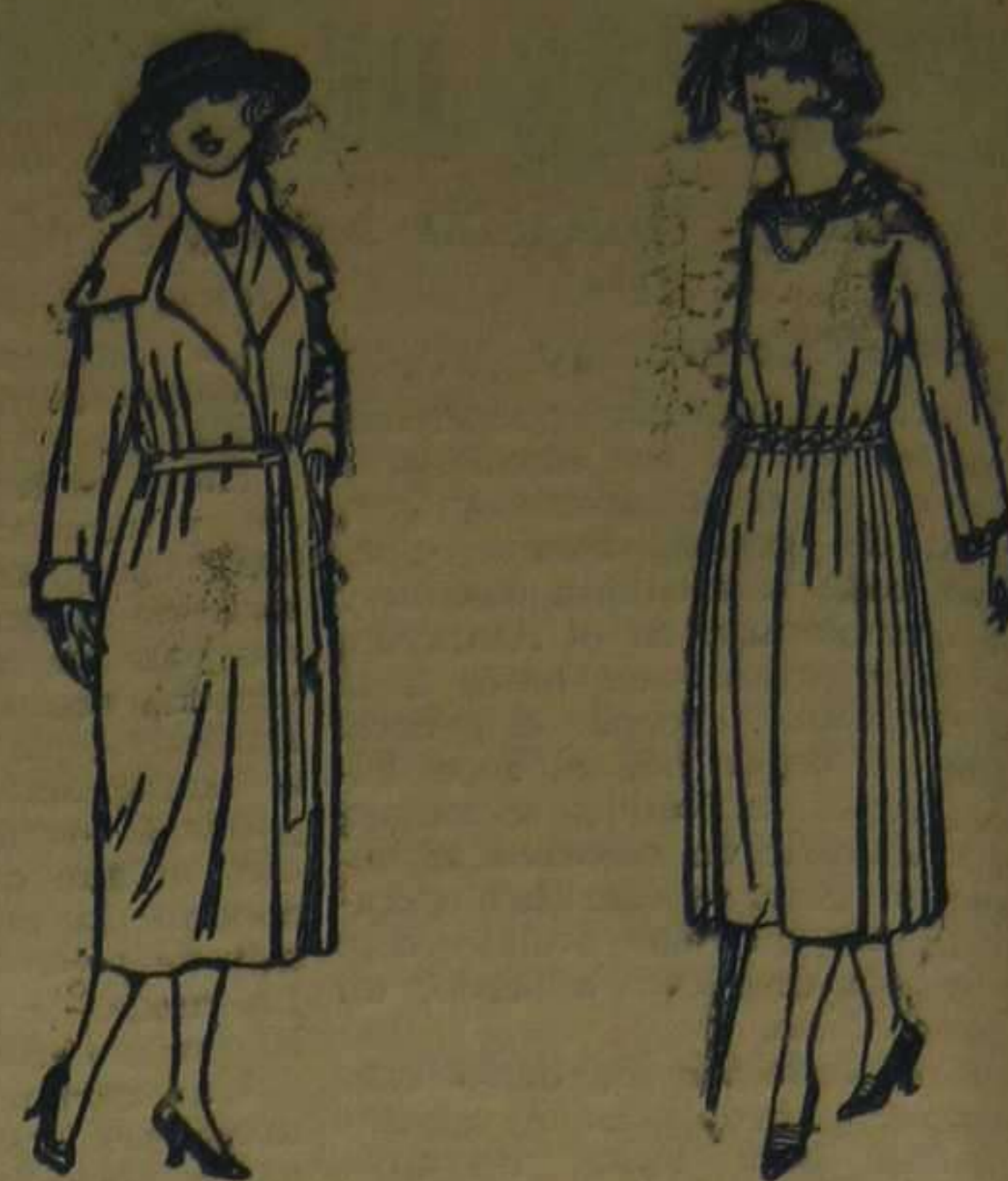
Abrigos de gamuza, cheviot, etc., en negro, azul y color. De ptas. 50 a 100.