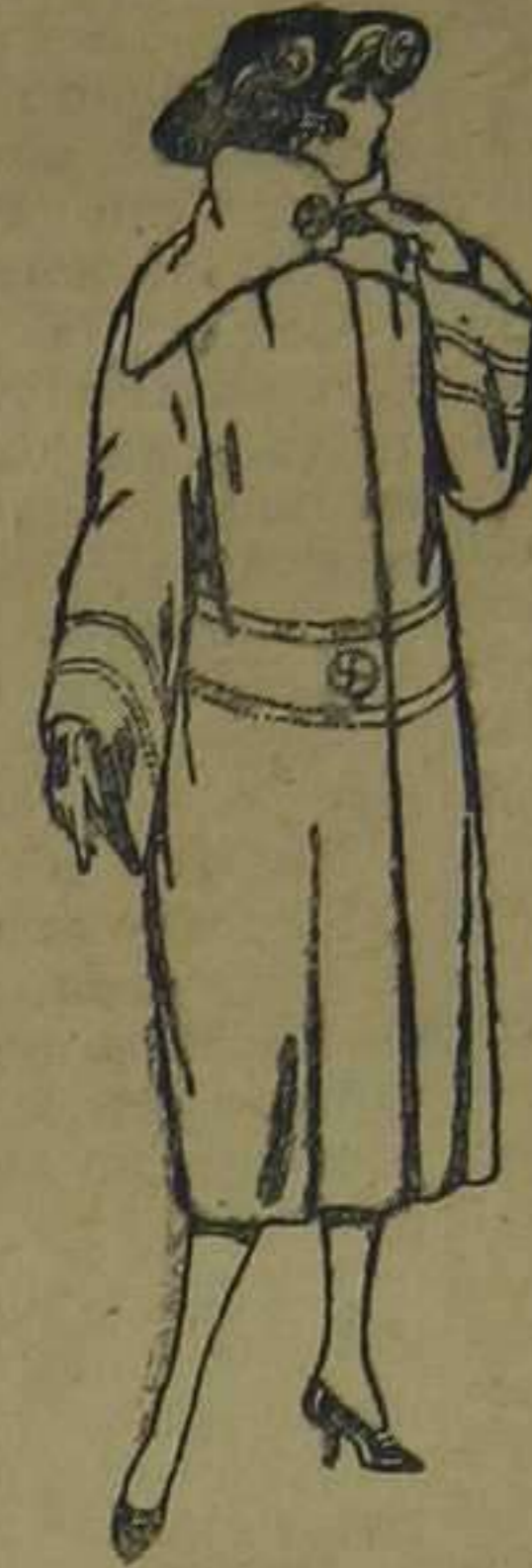
Abrigos de terciopelo de lana, ratina, etc., en negro, azul y color, adornos pespunte seda. De ptas. 110 a 200.