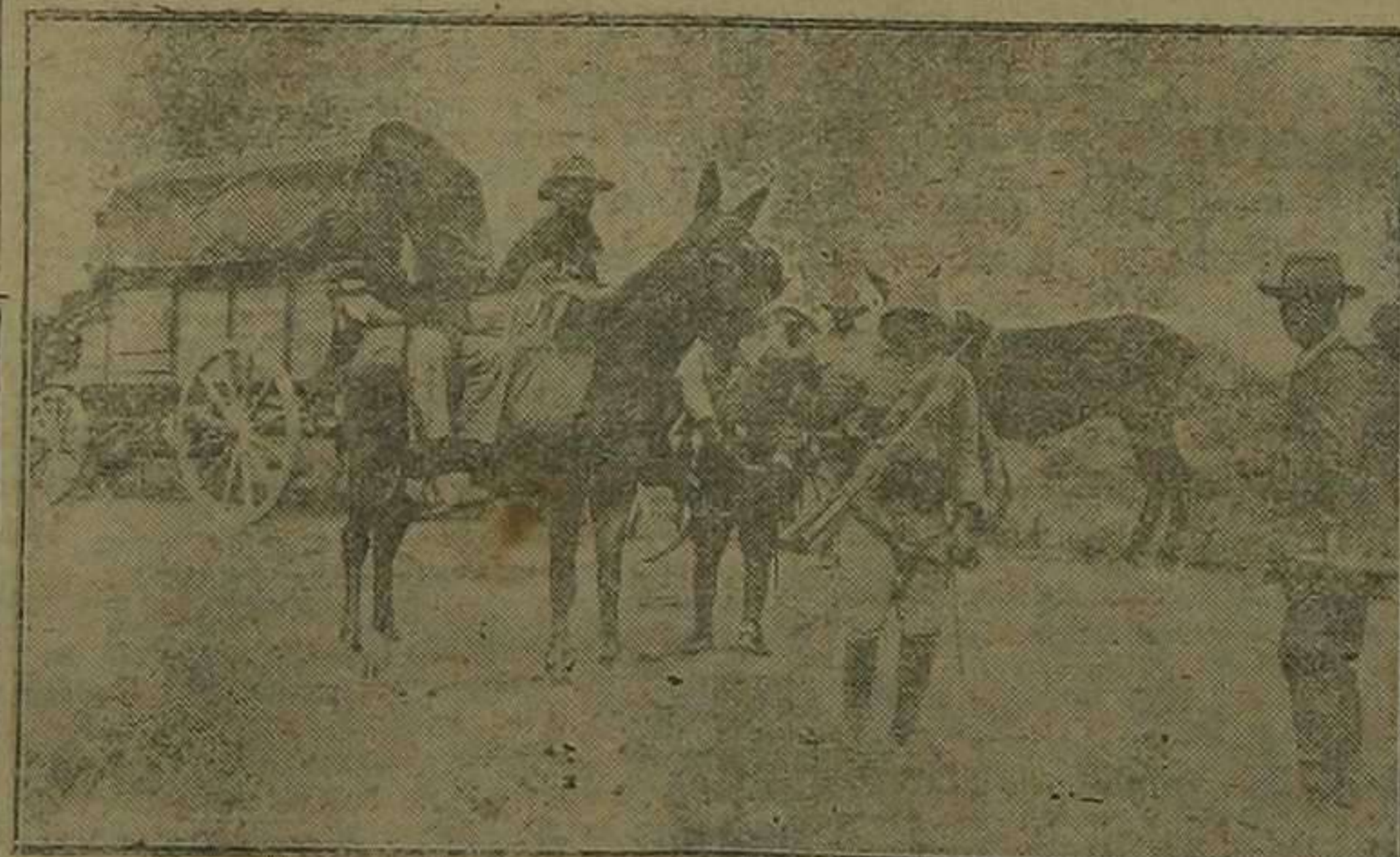
Melilla.—El combate y toma de Sebti. Evacuación de heridos.

Esta iglesia, de estilo moderno, mezcla de gótico y bizantino y de reciente construcción, ha sido enriquecida con verdadero gusto y sentido práctico con las principales Patronas de las regiones españolas, razón por la cual los militares, según la