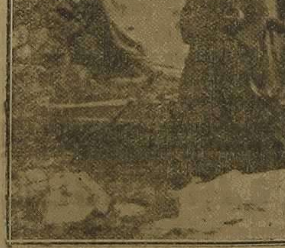
Melilla.—Uno de los cañones Schneider que tenían los moros emplazados en las Tetas de Nador, con el que cañoneaban la posición Sidi-Amad el Hech. Ahora en poder de nuestras tropas indígenas, que fueron las primeras en quitarlo a los moros.

Puedo decir a usted que la mayor manifestación de simpatía que yo he recibido en Barcelona, y la que más me ha agradado, ha sido la que recibí en los teatros Principal y Bohème días atrás, con motivo de una función a beneficio de los soldados de Africa. No creo haber oído ovación semejante en mi vida. Allí estaban los obreros de las barridas de Sans y del Paralelo. ¡No estaré yo tan distanciado de los obreros!