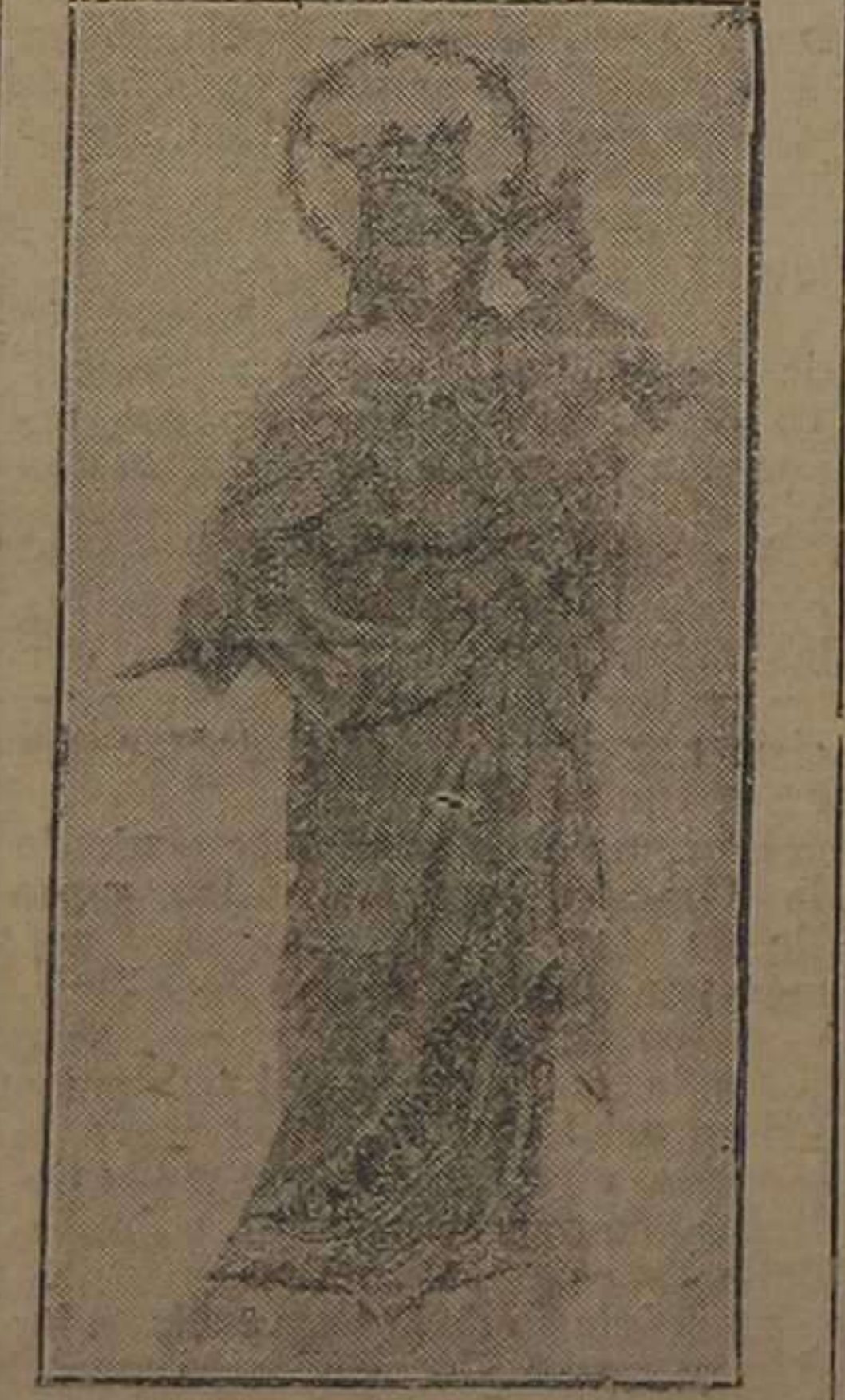
Imagen de María Auxiliadora, a quien dedican hoy grandioso homenaje de adoración y amor, en las Escuelas Salesianas, miles y miles de peregrinos de diversos pueblos, y entusiastas y numerosos devotos de esta capital.

Los actos principales del programa, son: La llegada y recibimiento de los peregrinos, de siete a ocho. La Misa de Comunión, a las ocho y media.