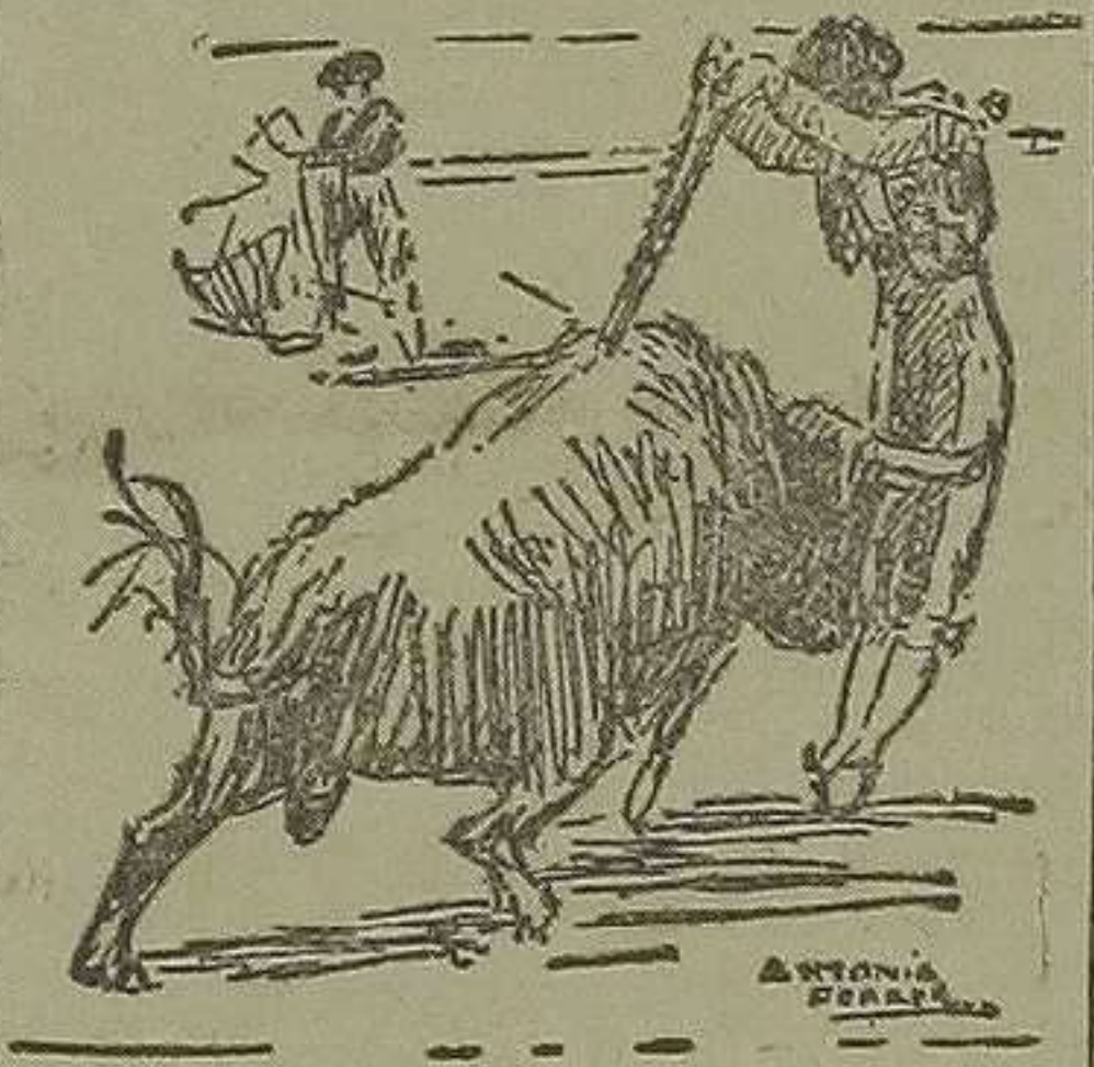
El segundo par de Sánchez Mejías

Y como los gustos y costumbres sociales, ha cambiado el toreo. Por eso la corrida de San Jaime de ayer, primera de feria, fué una especie de ensalada rusa por lo fresca, y un insulto a la verdadera afición (que, por fortuna para muchos, ya casi no existe), por lo mal que actuaron en ella todos sus componentes.