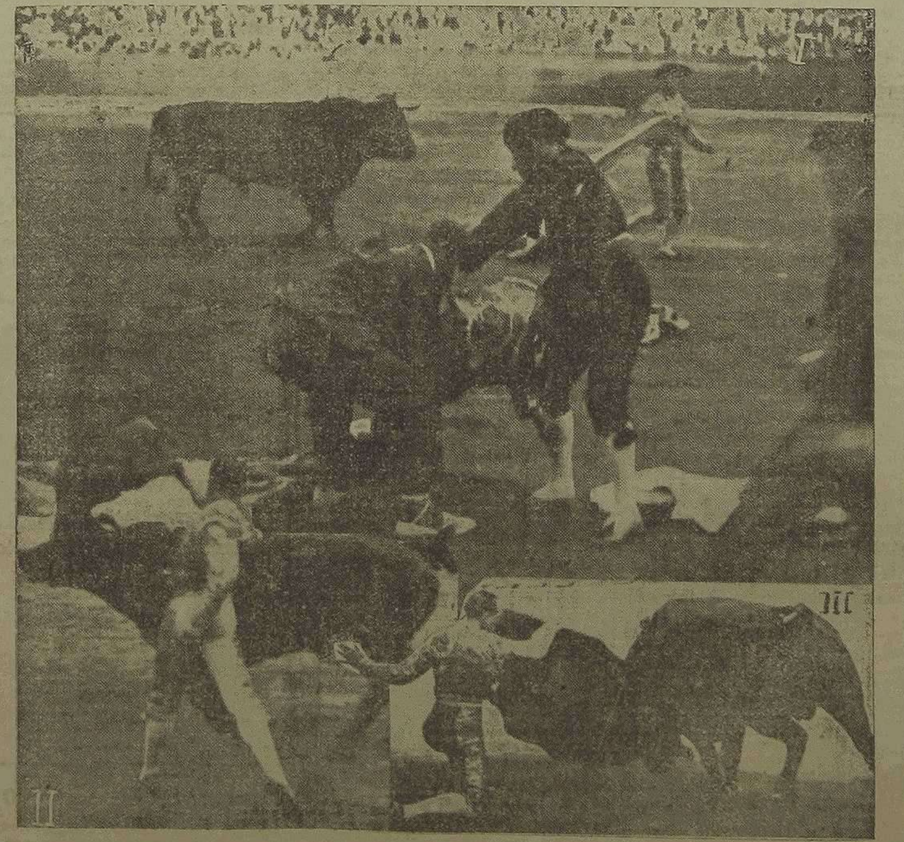
I. Cogida de Montes.—II. Olmos en su primero.—III. Mejías en su segundo.

Acostumbrados durante la temporada a ver novilleros que lo hacen todo y lo dan todo por corto estúpido, no era posible que el público ayer, pagando muy caro, saliera satisfecho del espectáculo. Me consta que el ganado de Ga-