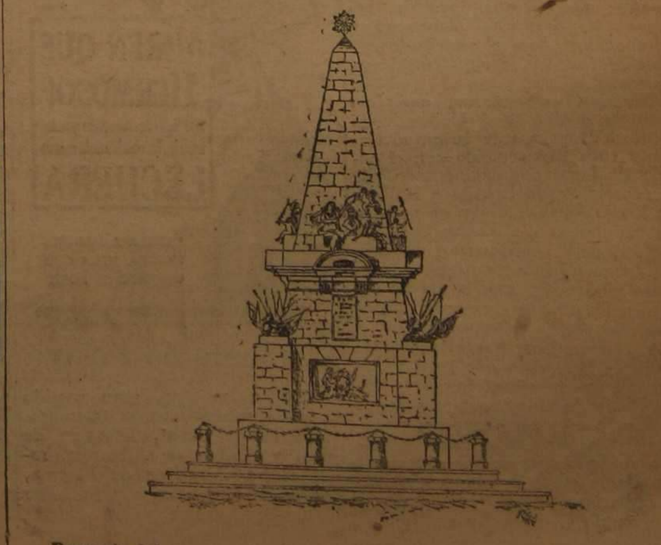
Proyecto del monumento al general Elio, que debió erigirse en 1826