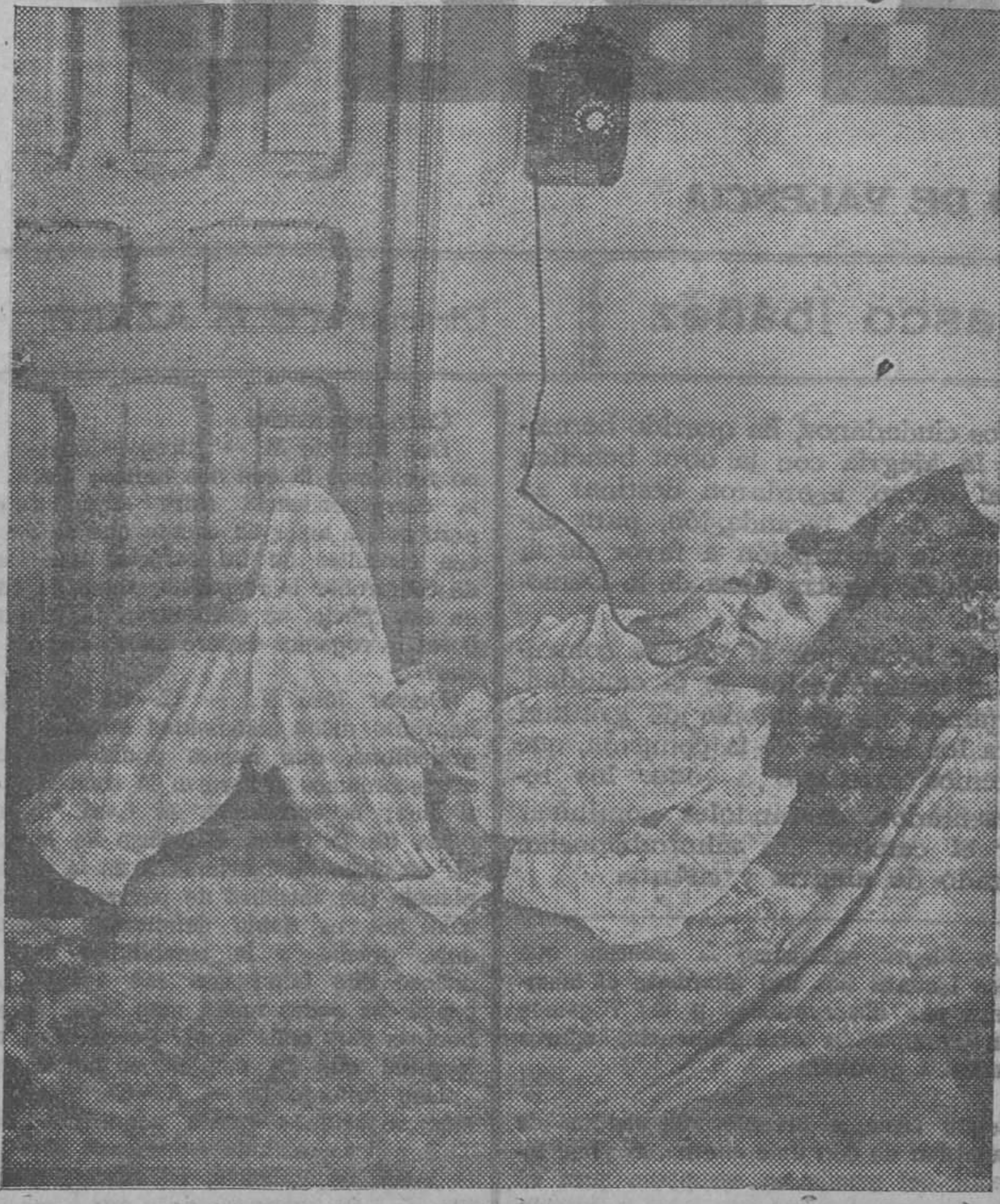
El famoso diestro Gitanillo, que convalece aún de su gravísima cogida, oyendo por teléfono en Madrid, el concierto con que le obsecularon desde Ricla sus paisanos. La conferencia interurbana duró una hora y Gitanillo se mostró altamente satisfecho de lo perfecto de la audición