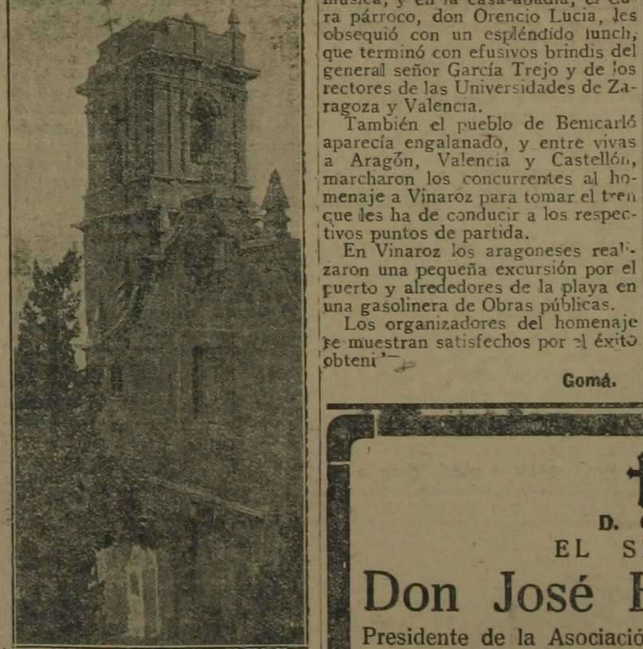
Peñíscola.—Iglesia donde nació el Papa Benedicto XIII (Pedro de Luna).