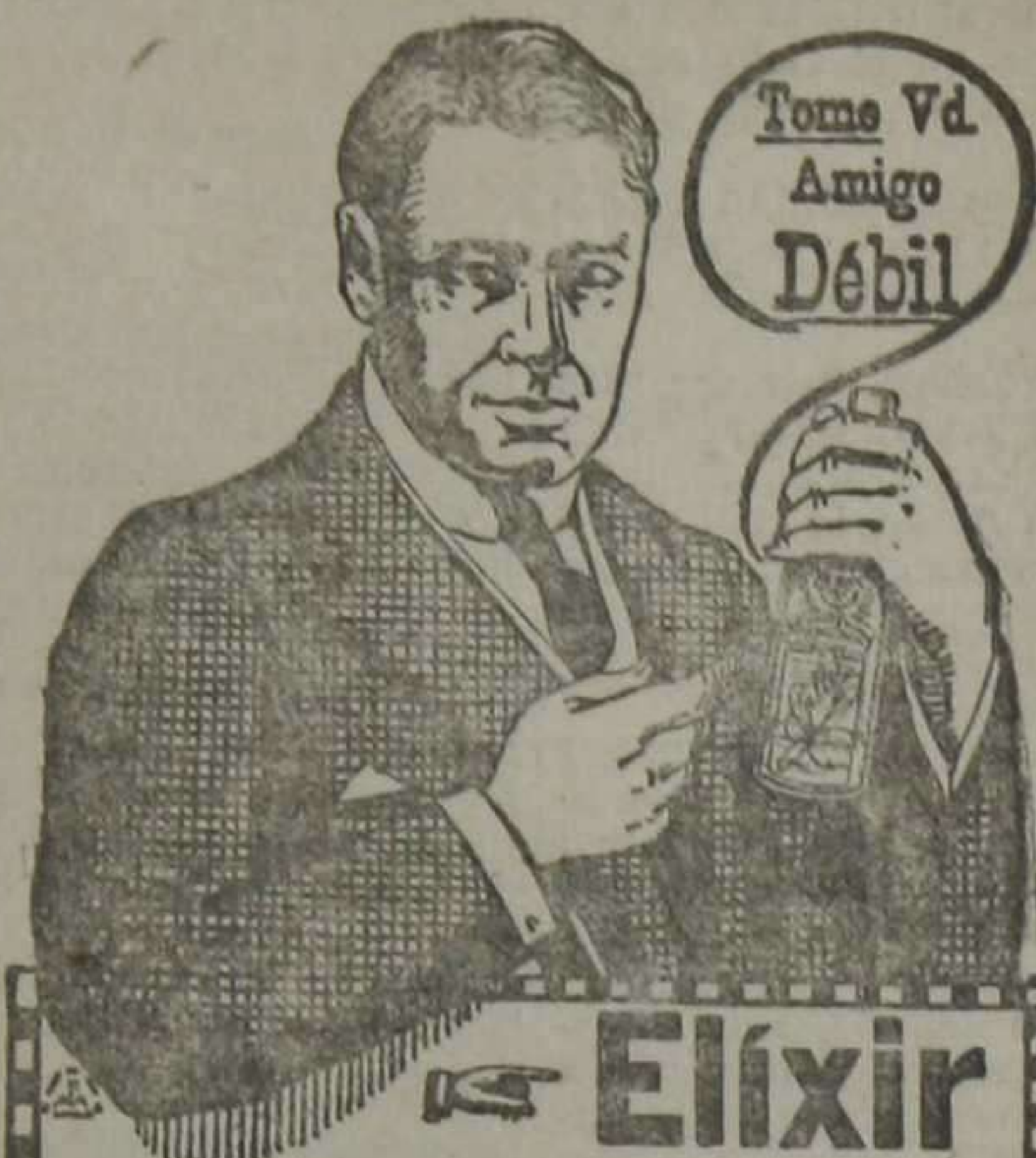
Tome Vd. Amigo Débil