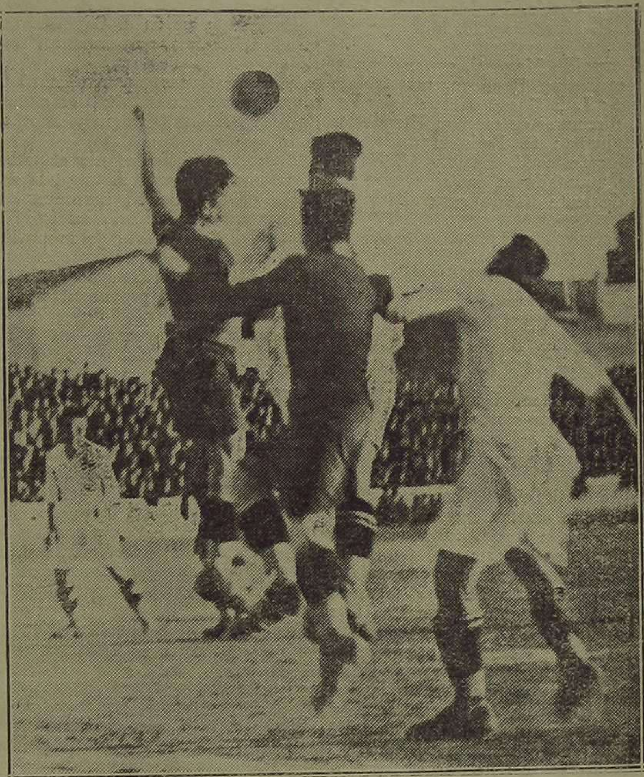
putaúsimo ante la puerta del Gimnástico

Cuando el público abandonaba el domingo el campo de Vallejo, se oían por muchas partes conversaciones y comentarios de la «comedia» que acababan de presenciarse.