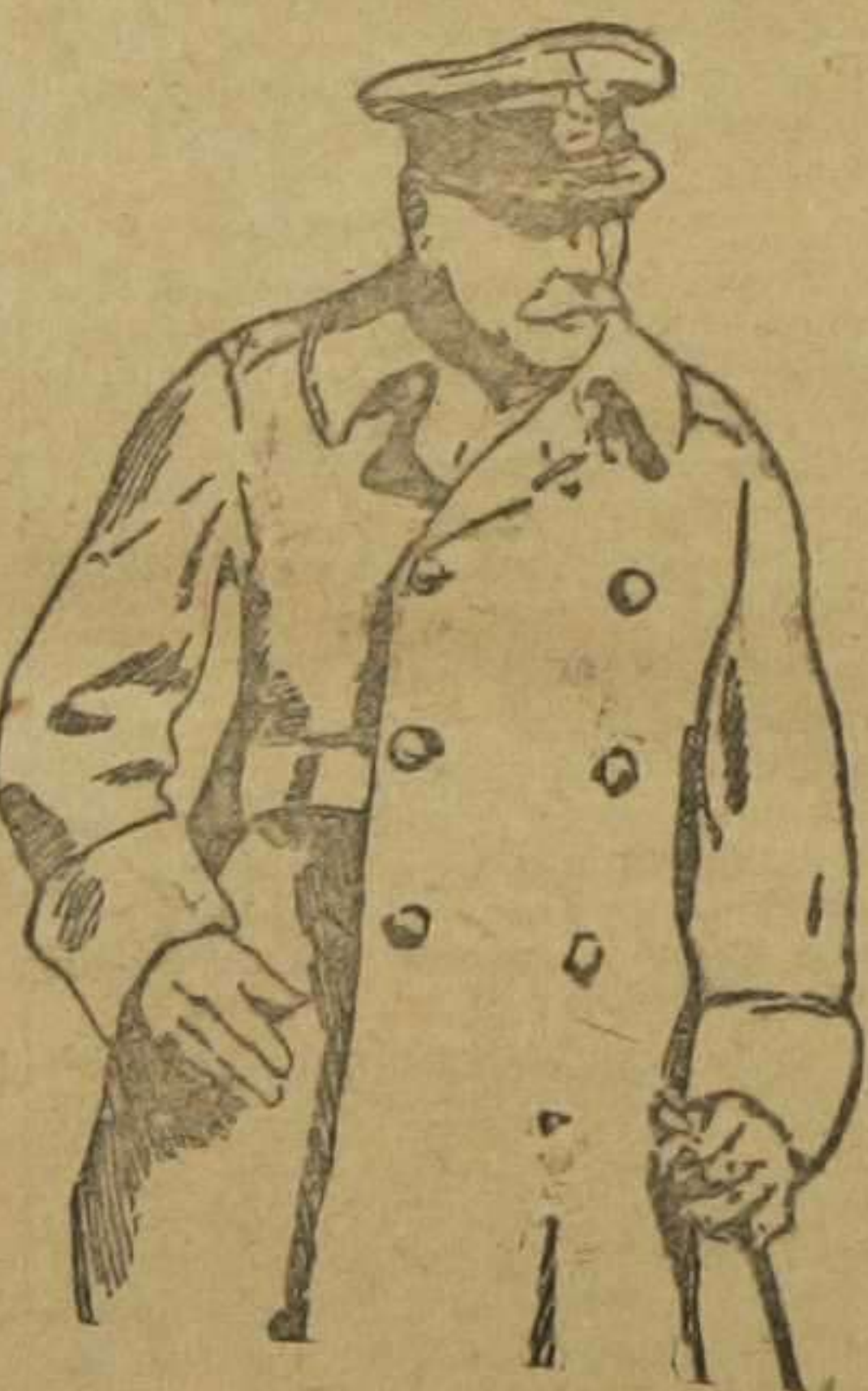
General Douglas Haig

comandante en jefe del ejército inglés del frente occidental, promovido a mariscal por el Gobierno británico.