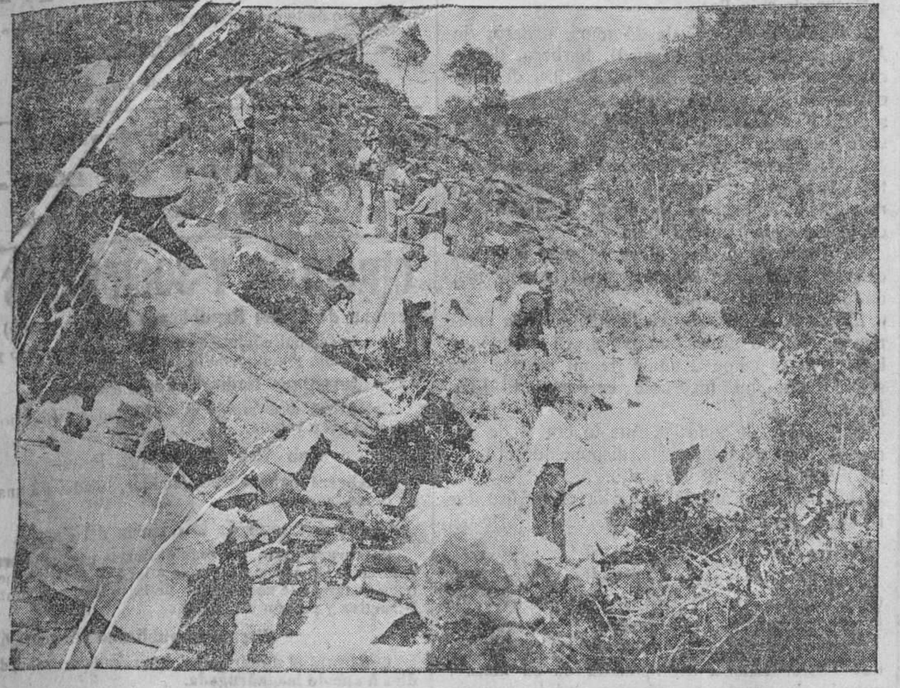
Construyendo la carretera para sacar los pinos

Porque nosotros no entenderemos de asuntos forestales, pero el sentido común aconseja que