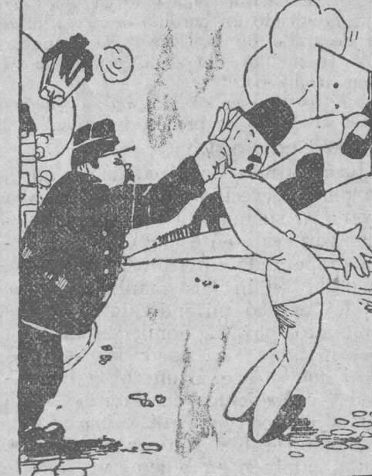
- Bueno, guardia, bueno: no empuje más. ¡Si caeré solo!