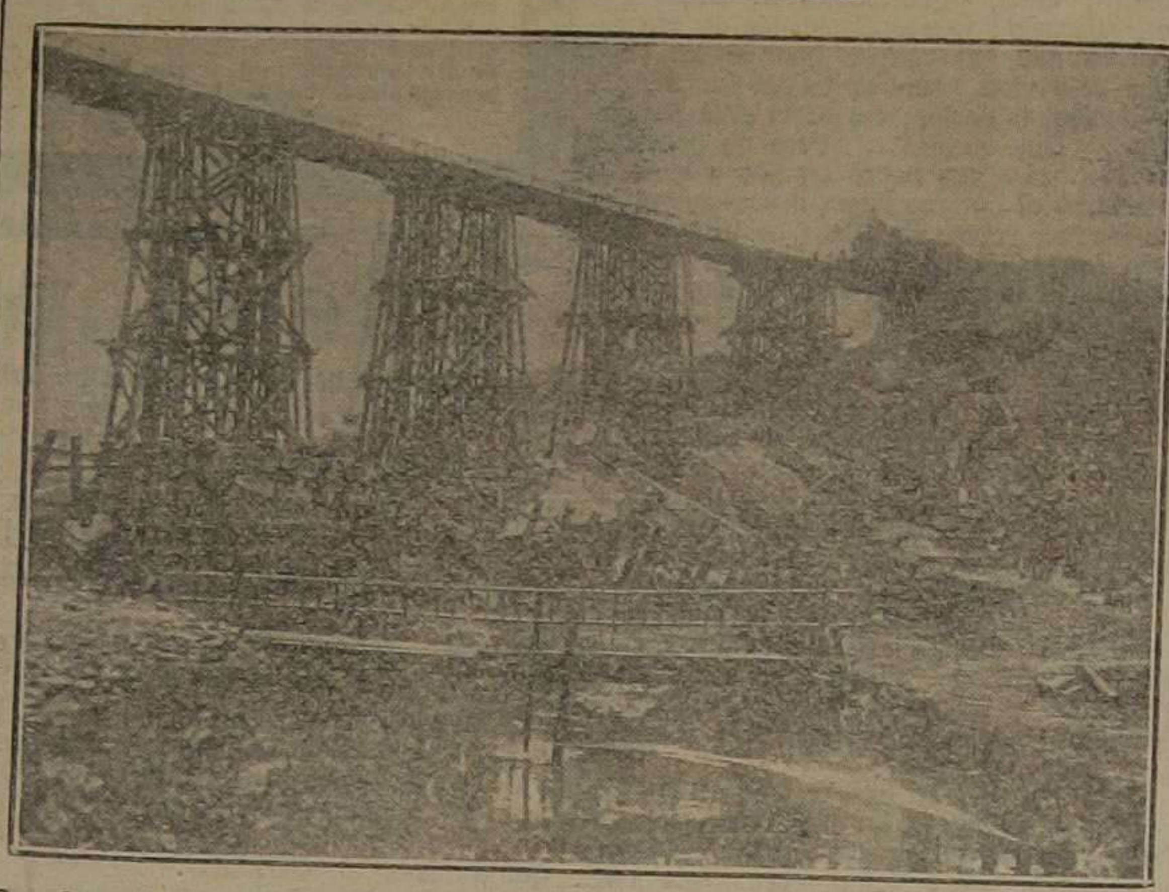
Pruebas de resistencia de un viaducto construido por los alemanes en el Norte de Francia. Un tren atraviesa el viaducto hecho todo de madera

25 días. En todo ese tiempo no he comido nada. Respecto a la manada, cada bando tiene la suya, y anula la del contrario. Ahora los carrancistas van a retirar su moneda, y al canjerla drán un peso por cada cinco. Esto demuestra las grandes privaciones y penalidades que nuestros compatriotas han sufrido en Méjico.