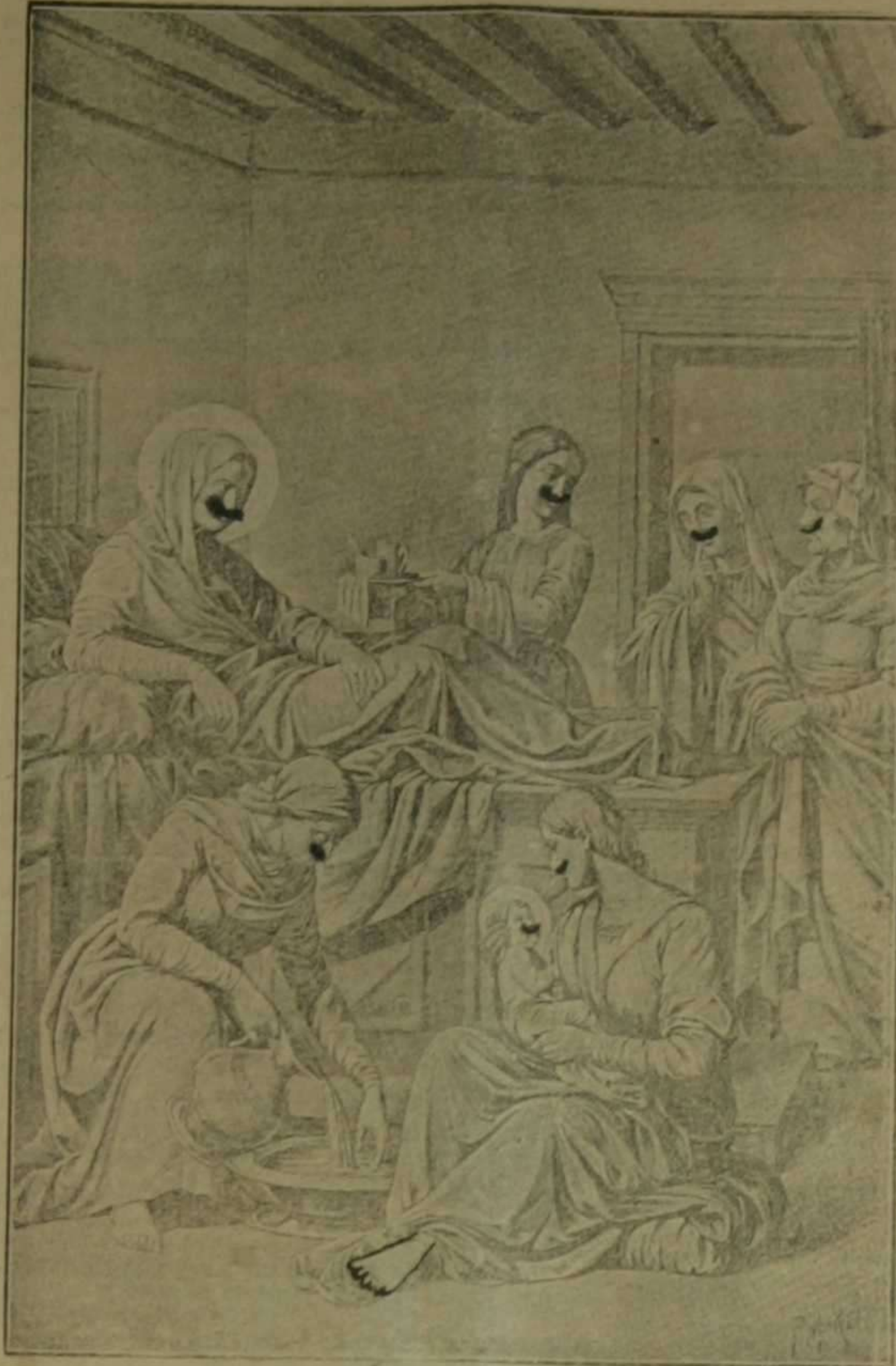
E Nacimiento de la Santísima Virgen

Pero el protestantismo primero, la revolución después, tomada esta palabra en su más amplio sentido, la masonería enemiga de Cristo y de su Iglesia siempre, y el laicismo modernista ahora, alejaron poco a poco, pero sistemáticamente, al Derecho Internacional del espiritualismo cristiano, y por ende de su legítimo representante en la tierra el Romano Pontífice, presidente nato de la Confederación espiritual que debían componer las naciones europeas, y aunque a última hora, hasta la furiosamente antipapista Inglaterra, han querido agru-