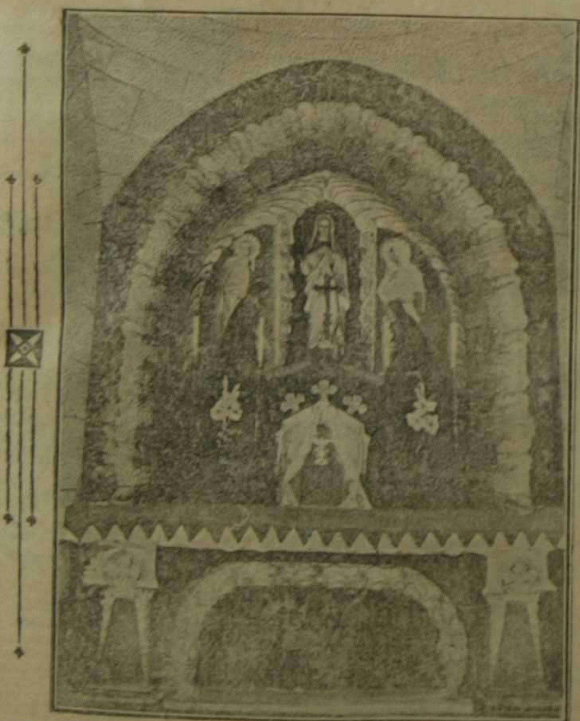
Altar de la cripta de la Natividad, en el lugar mismo del nacimiento de Nuestra Señora en la iglesia de Santa Ana, en Jerusalén

parse en torno del Papa las naciones, asustadas de su propia obra, ya era tarde. Confirmación de esta verdad son las siguientes palabras de Novikov: «Soy libre-pensador hasta la médula—dice—pero si el Papa quisiera constituir la Federación de Europa, yo le ayudaría con todas mis fuerzas, y desde este punto de vista yo me convertiría en el primero de los más fervientes devotos de la Iglesia.»