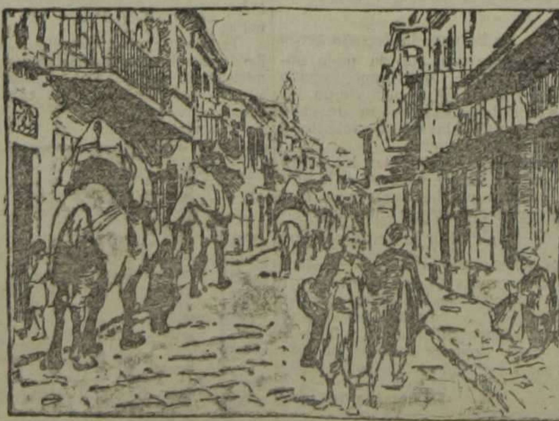
De la guerra.—Una calle de Smirna

Sombreros de segar y de eclesiástico CORREJERIA, 6 VALENCIA