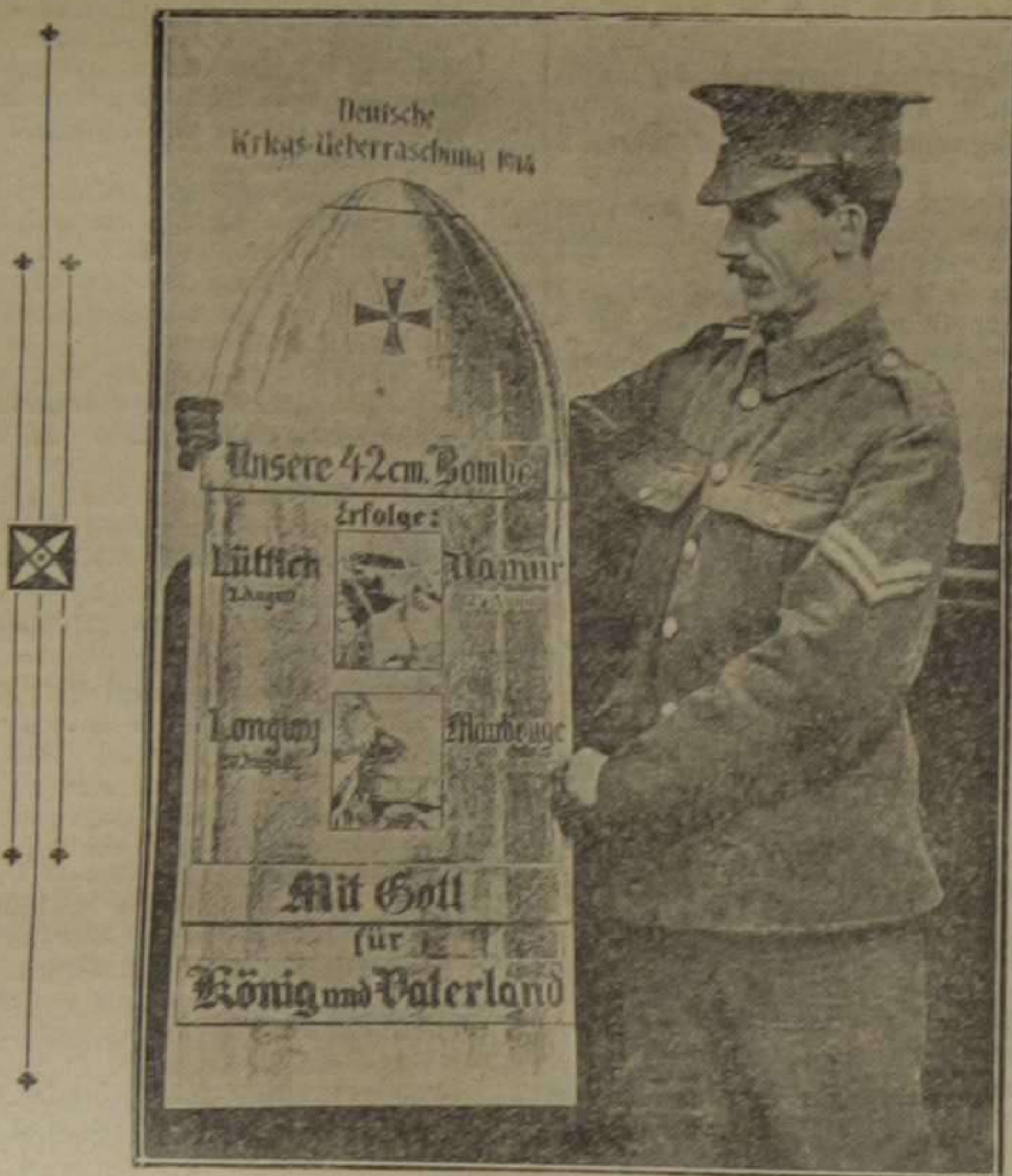
La sorpresa que los alemanes prepararon a sus "amigos" los ingleses en la actual guerra. Un soldado inglés sosteniendo el grabado que reproduce el proyectil de 42 cm., que tan buenos éxitos ha alcanzado en la rendición de Lieja, Longwy, Namur y Maubeuge