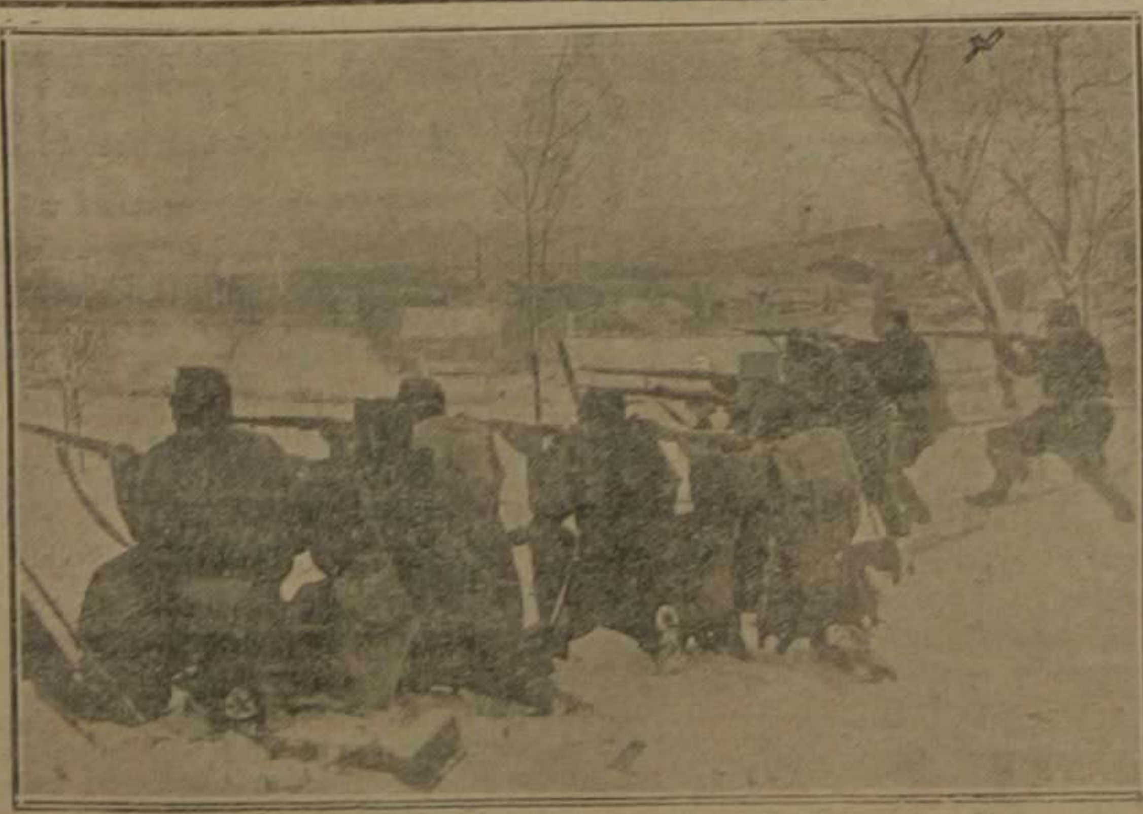
Combates de la infantería austriaca en la Bukovina