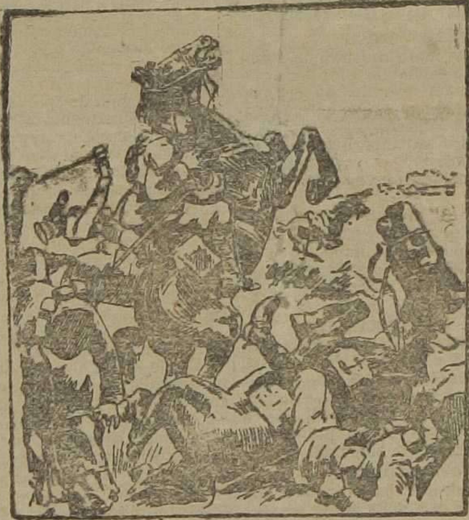
Caballería inglesa detenida durante una carga por el fuego de las ametralladoras alemanas

Por eso no sentían la necesidad que sentimos hoy nosotros, que hemos perdido todos aquellos auxilios, y nos encontramos más solos y más abandonados a nuestras propias fuerzas. Si la hubieran sentido, lo hubieran hecho. Imitémoslos, hagámoslo nosotros. Conservémoslos de la Cofradía lo que tiene de tradicional y de bueno: el culto al Santo; pero sin los arrequives de los jolgorios costosos, que no es cosa heredada, que es un poco de mixtificación nuestra.