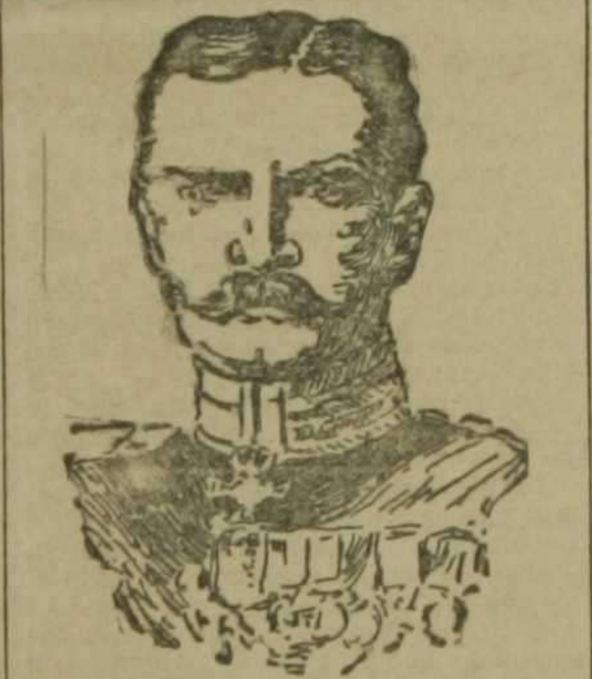
General von Makensen, comandante de uno de los ejércitos alemanes de Polonia y conquistador de Lodz

Se levanta la sesión a las dos para reanudarla esta tarde a las tres.