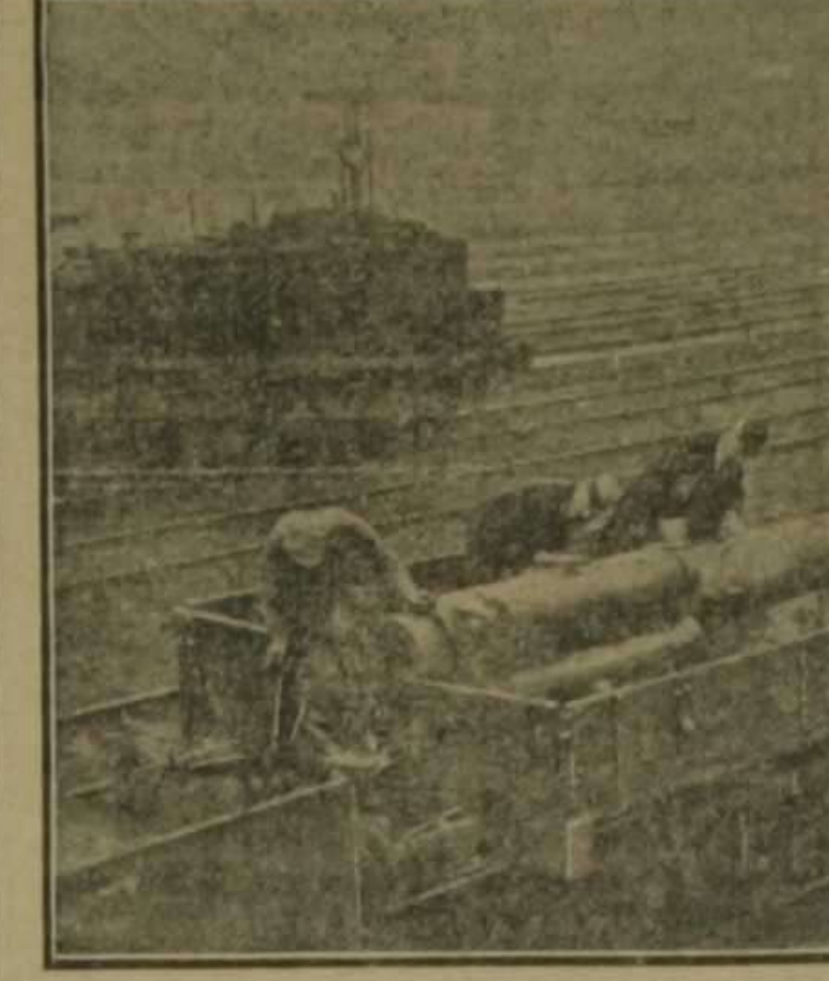
Un cañón de 18 m, usado por los ingleses en la defensa de Amberes. Los alemanes lo transportan como botín de guerra a Alemania