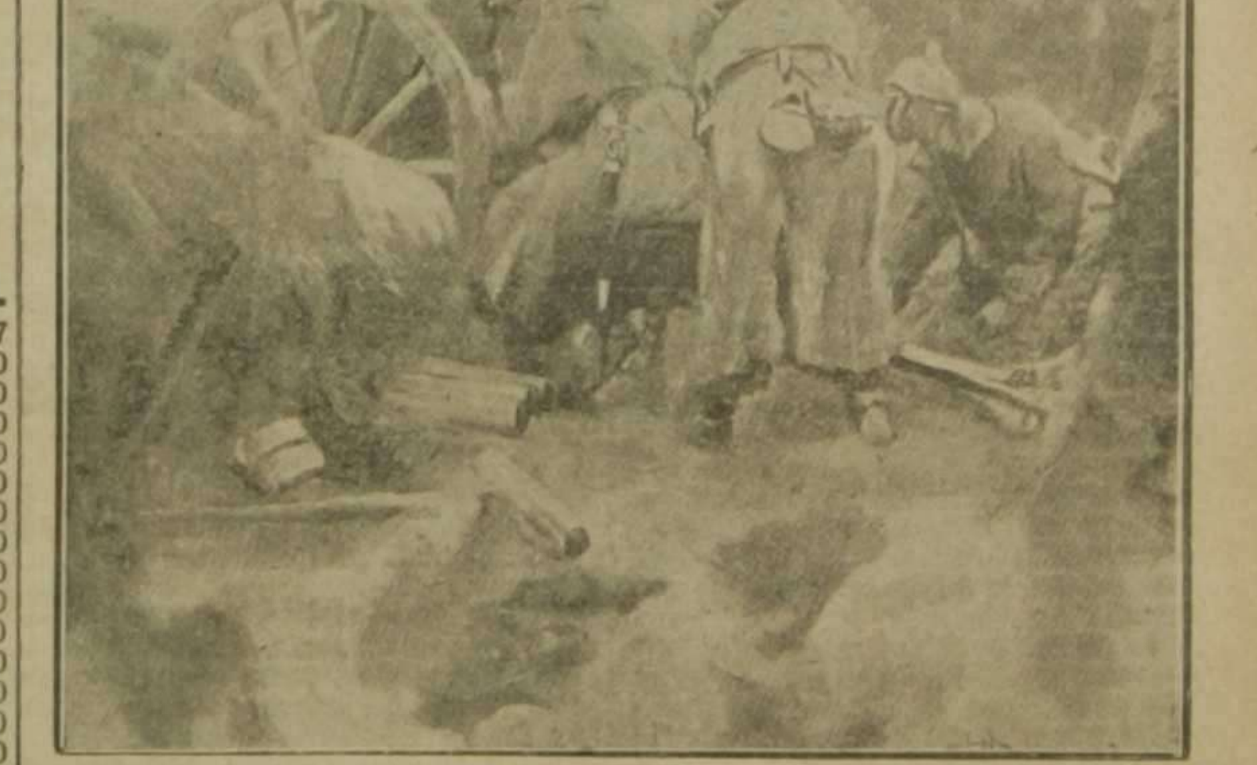
Artilleros alemanes poniendo en posición una pieza de campaña