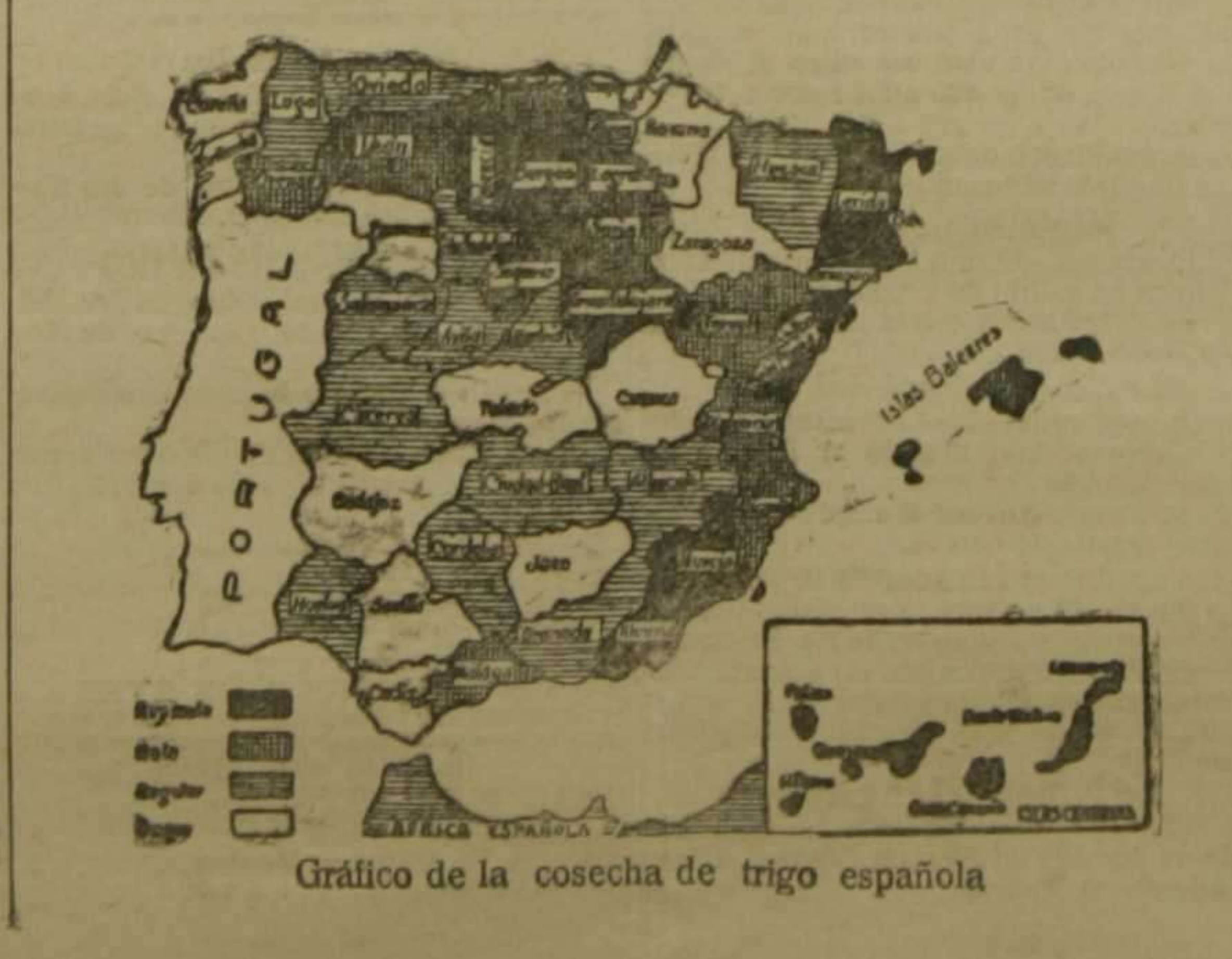
Gráfico de la cosecha de trigo española