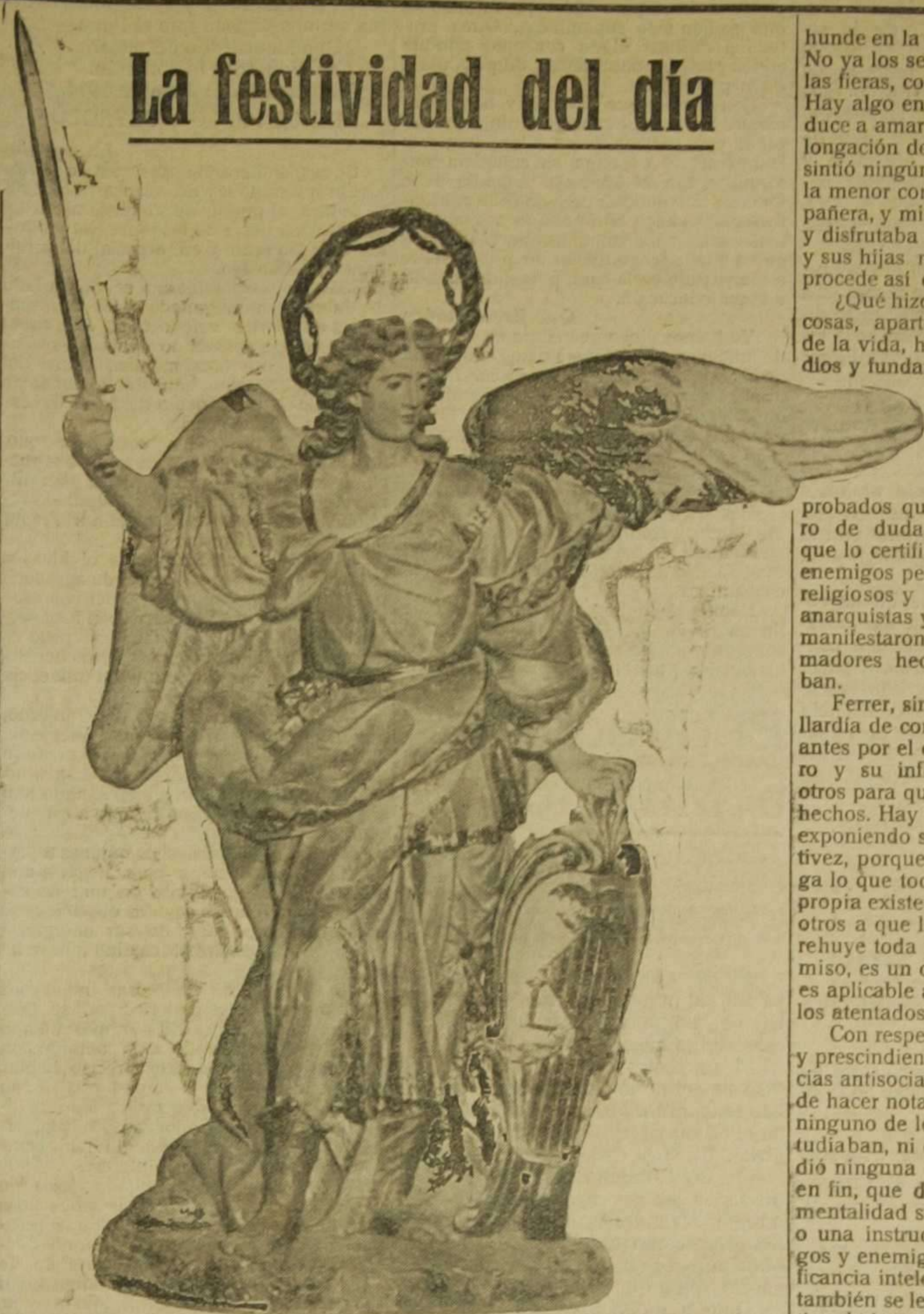
El Santo Angel Custodio de la ciudad de Valencia

En los primeros siglos del Cristianismo la Iglesia no permitió el culto externo de los ángeles para evitar que el vulgo lo confundiese con el culto pagano a los genios, aunque desde tiempo inmemorial era familiar la devoción al Santo Angel de la Guardia y a los demás espíritus angélicos.