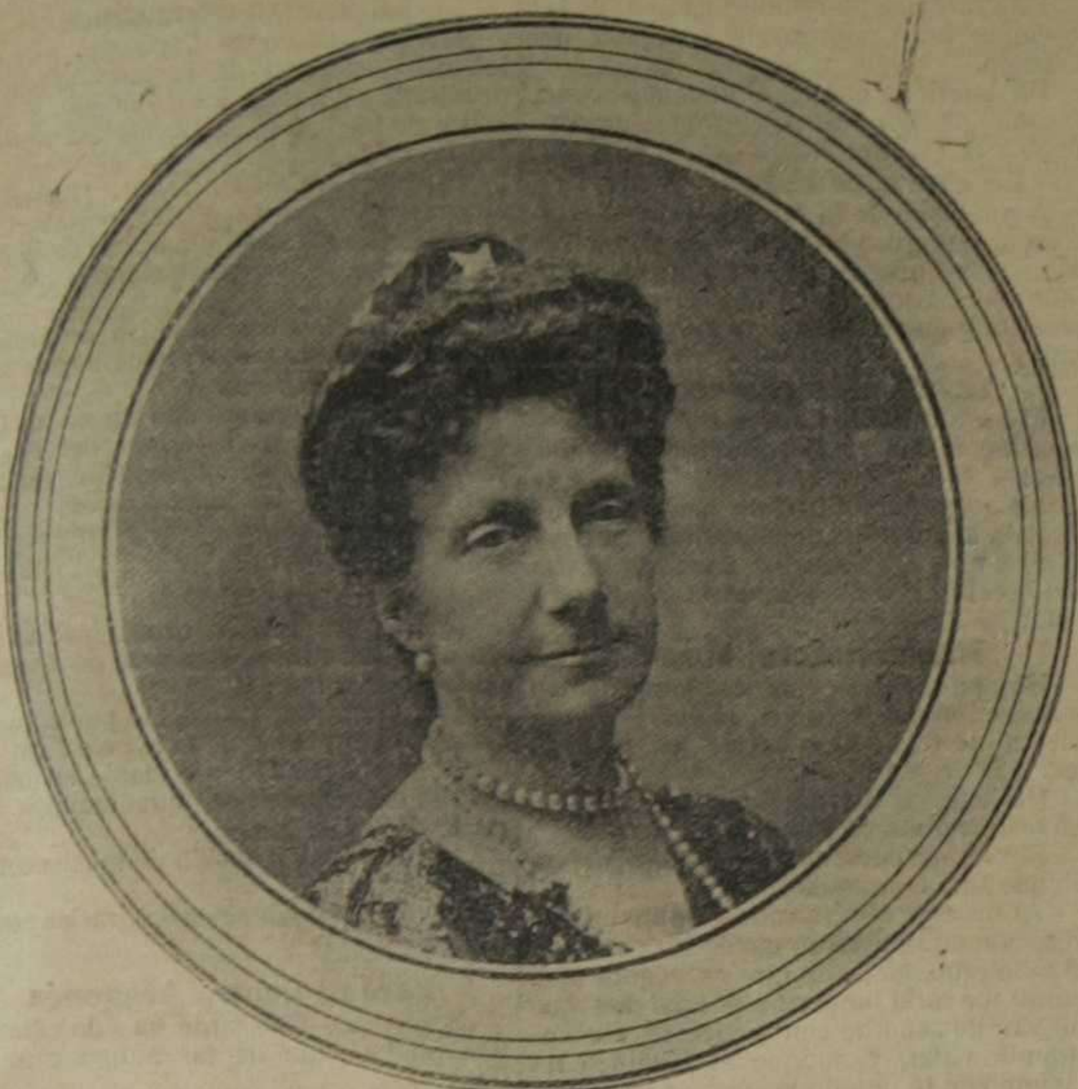
Su Alteza Real la Princesa de Baviera, doña Paz de Borbón, infanta de España