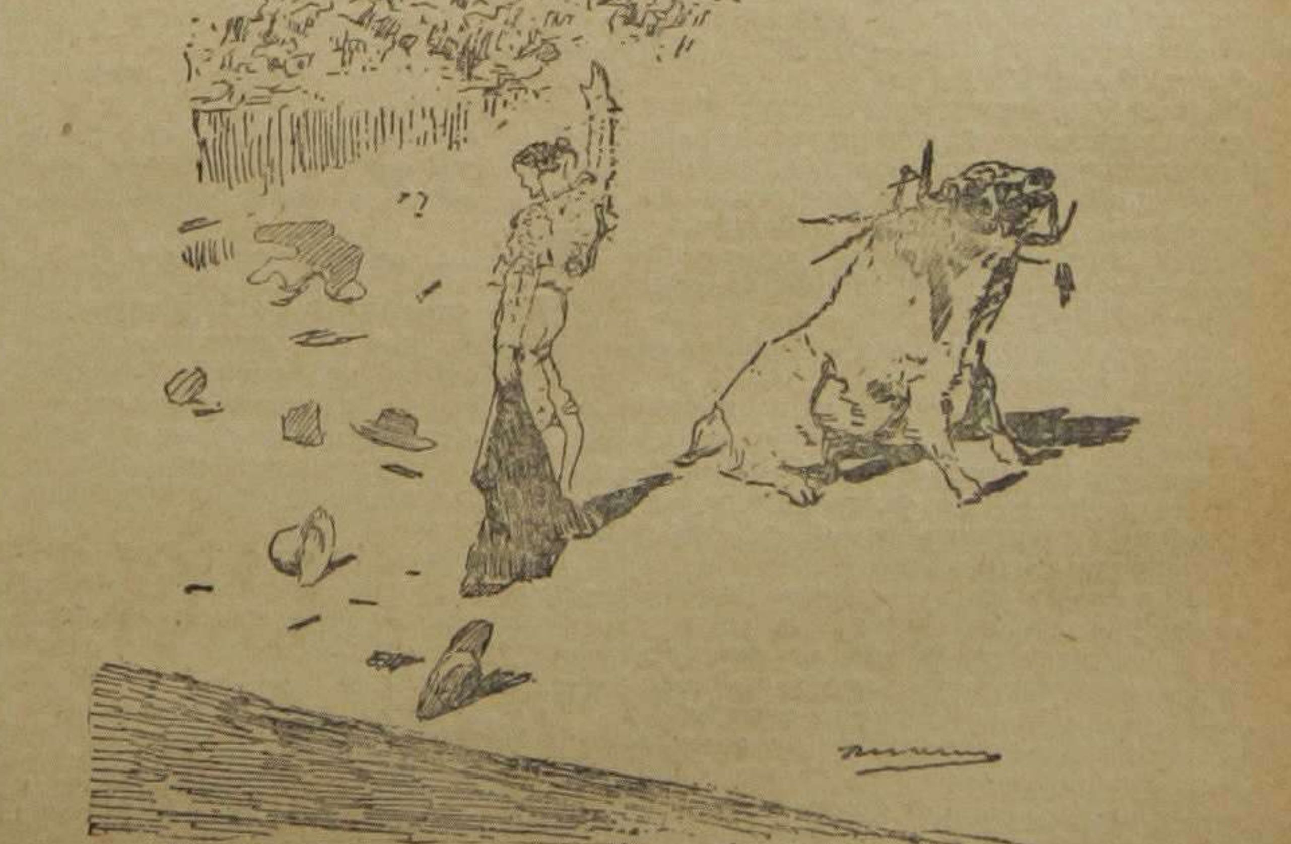
Bombita después de una estocada.—(Dibujo de R. Marin)

DIGESTOL ESCOBAR No alivia; cura siempre y para siempre VENTA EN FARMACIAS