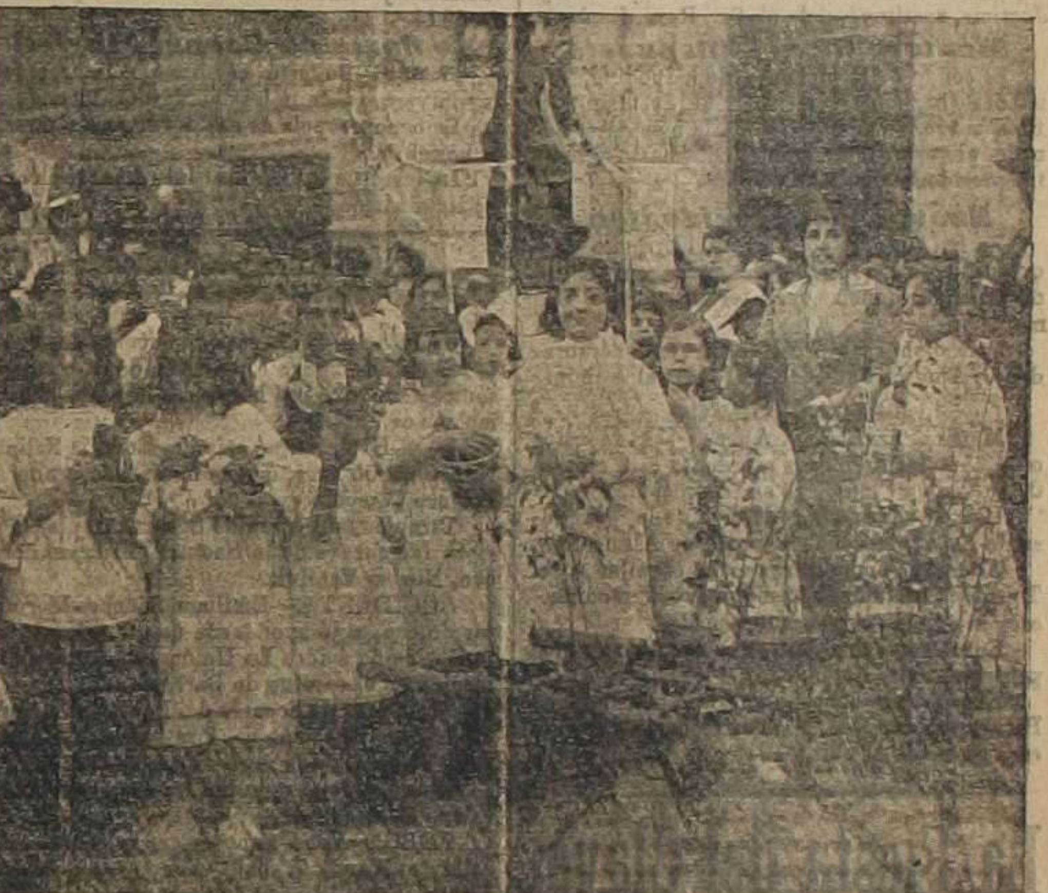
Grupo de niñas en la Fiesta del Rosal.—(Foto Vidal)