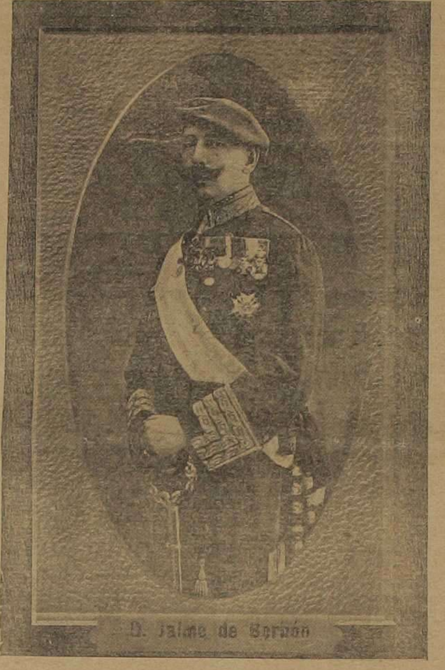
Don Jaime de Borbón

A S. S. el Papa Pio X Beatísimo Padre: El director y redactores del DIARIO DE VALENCIA reiteran su filial adhesión a la Santa Sede e impetran humildemente la Bendición Apostólica