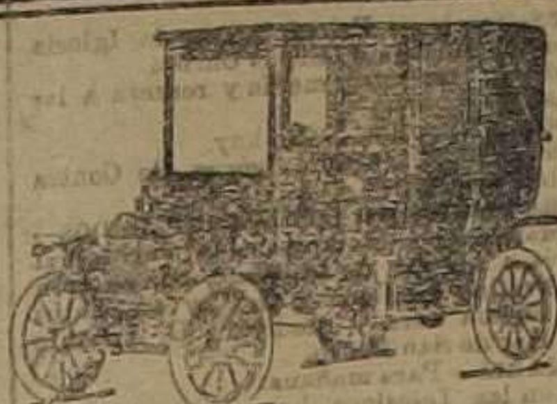
LANDEULET 6 ASIENTOS