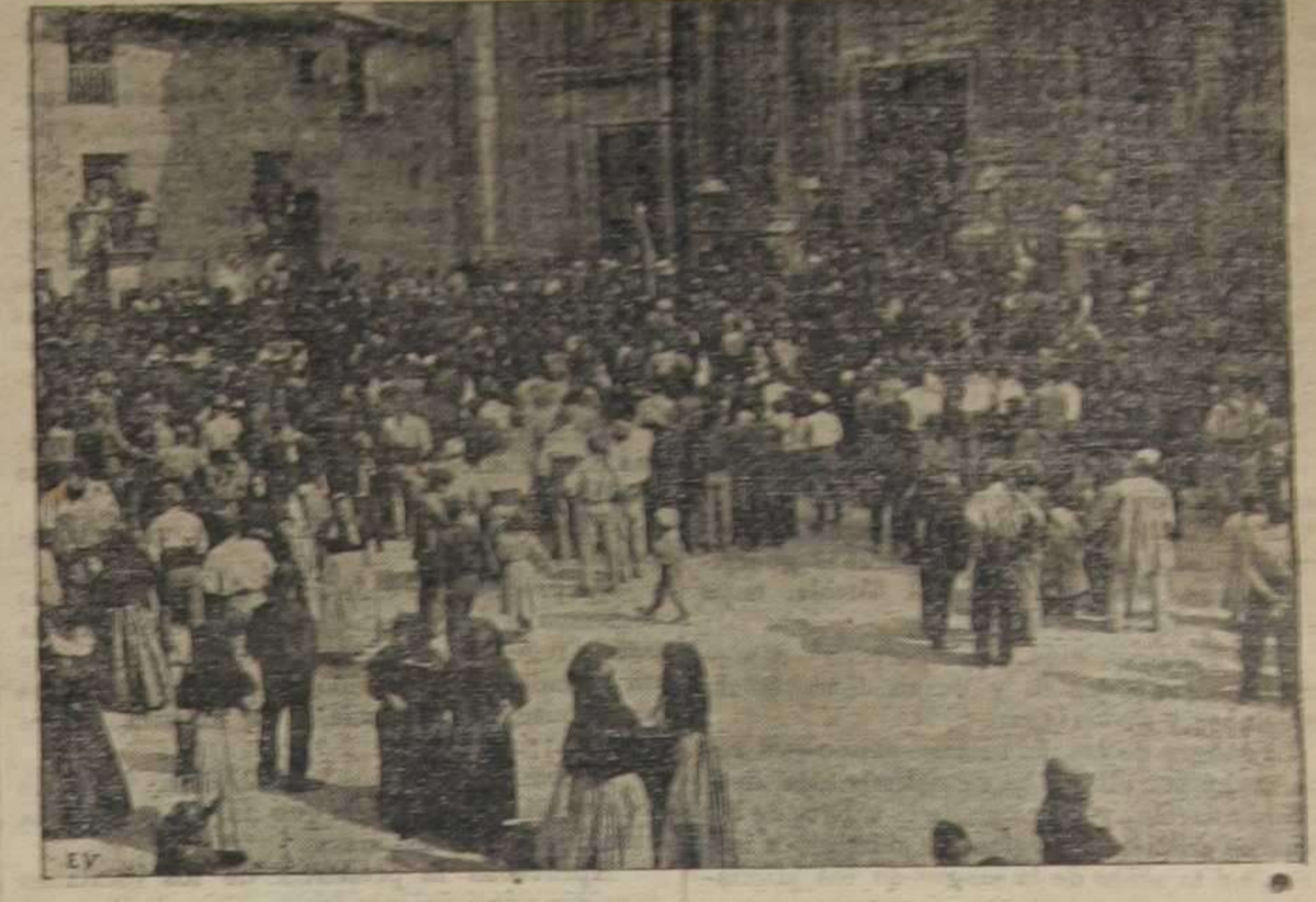
Salida de la iglesia parroquial después de la bendición de la bandera