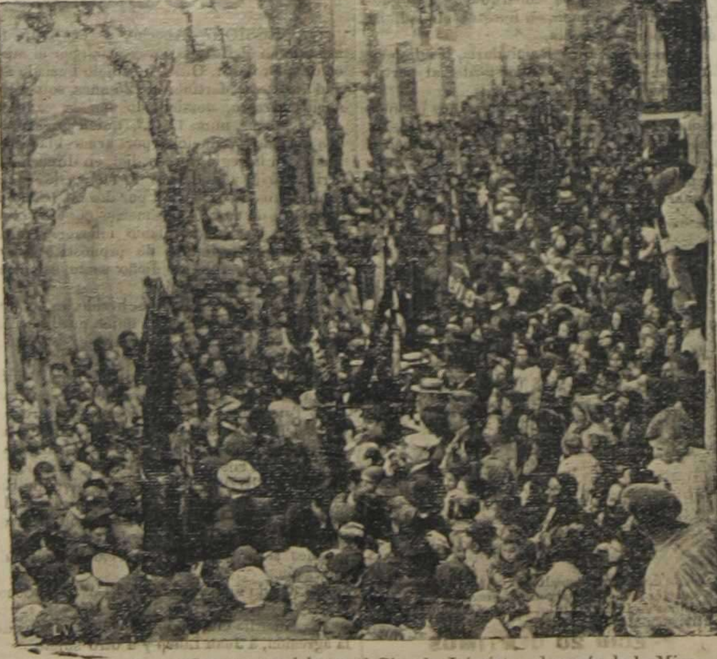
Llegada de las banderas y comisiones al Círculo Jaimista, después de la Misa