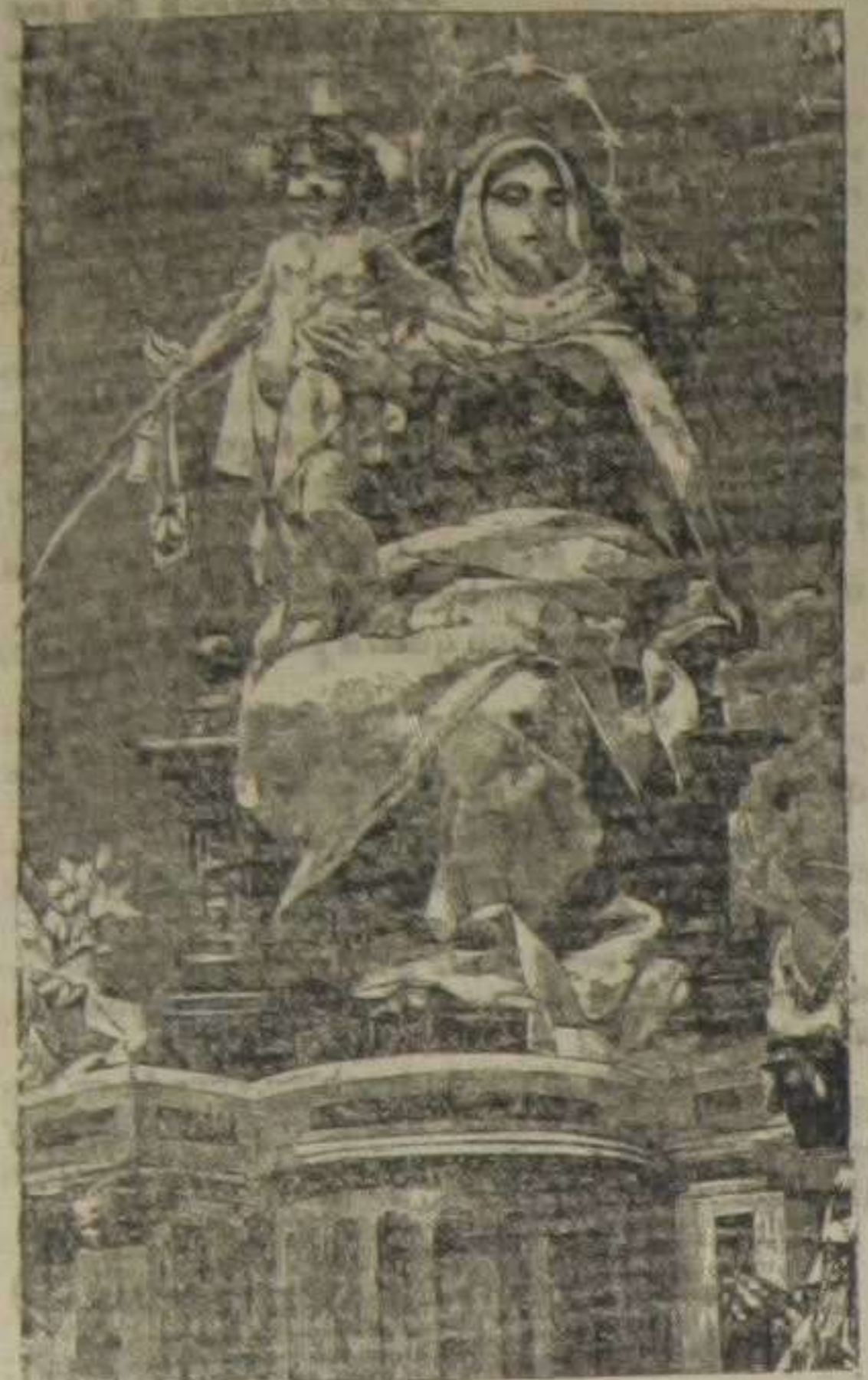
Fragmento del celebrado cuadro de Manuel Domínguez que se conserva en la Iglesia de San Francisco el Grande, en Madrid, capilla llamada de Carlos III