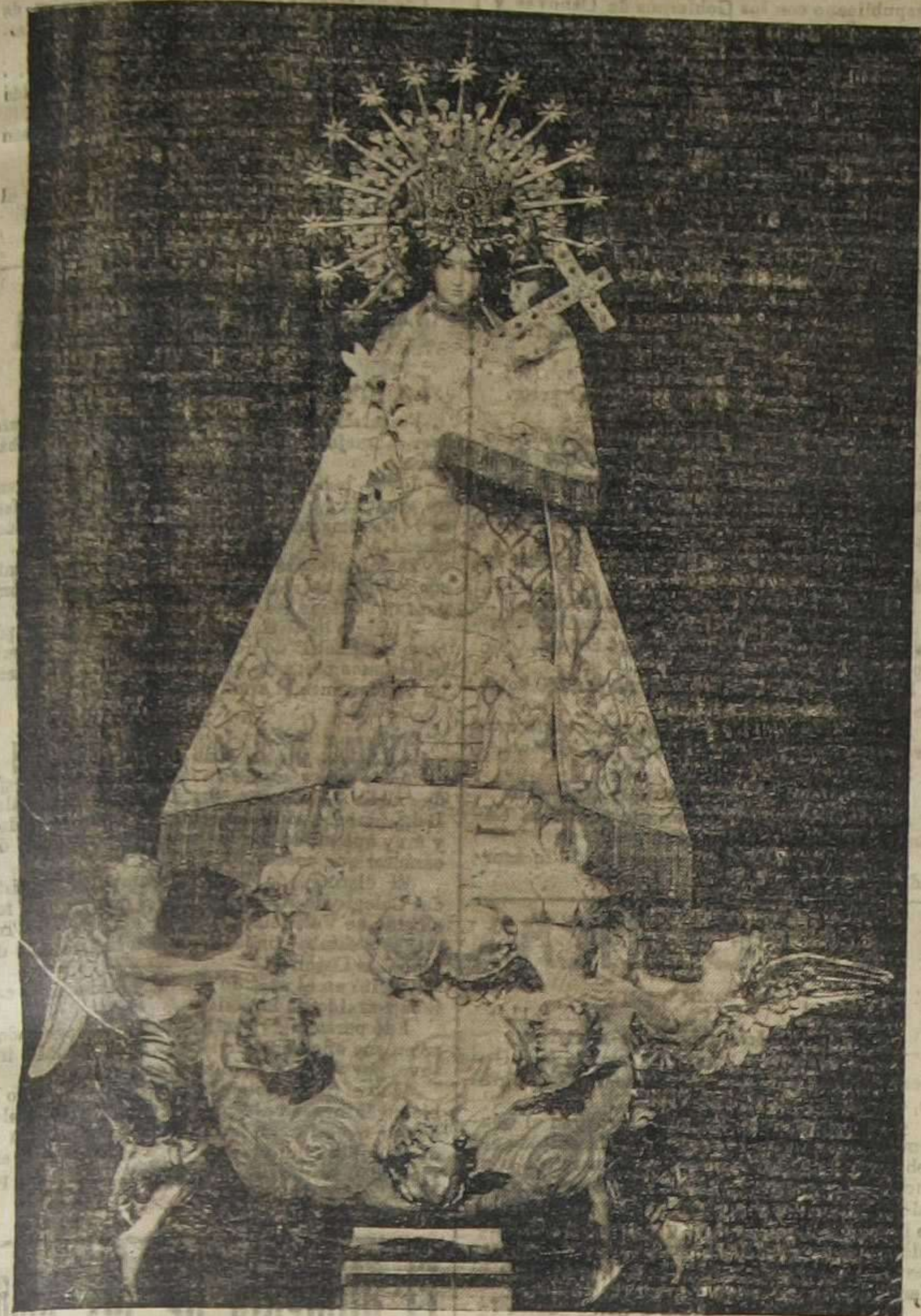
La Virgen de los Desamparados

Artística imagen labrada por el notable escultor catalán D. Domingo Peris por encargo de la Real Cofradía que para dar culto a nuestra Excelenta Patrona acaba de establecer la colonia valenciana de la ciudad condal.