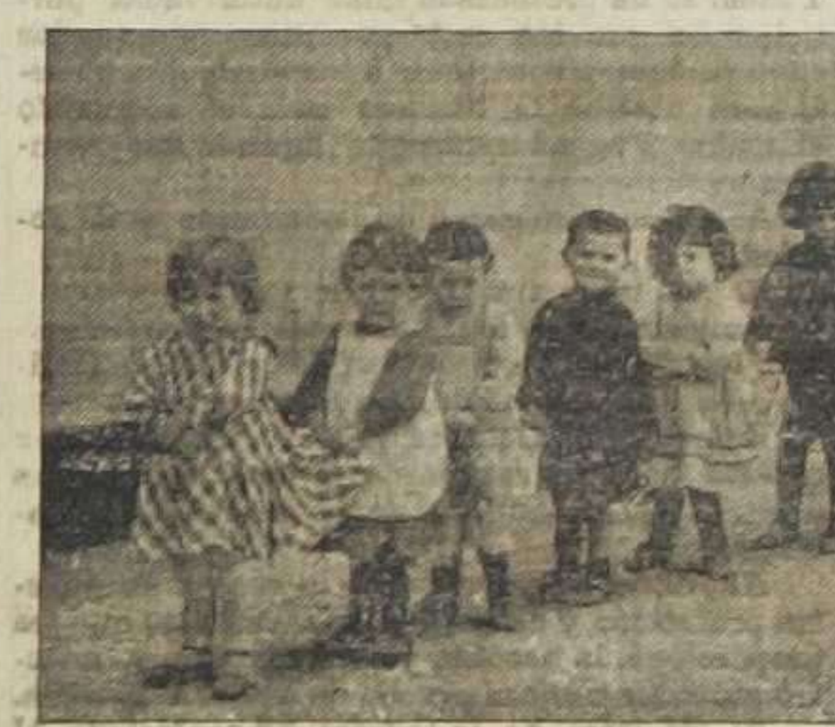
Tomando turno para cumplir una alta función fisiológica

Las niñas gastan cinco céntimos cada día y las labores que ejecutan son para ellas.