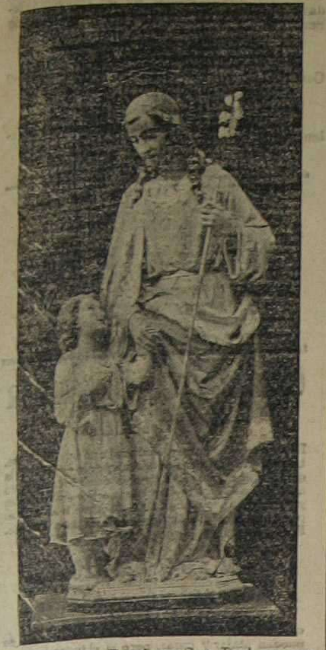
El glorioso Patriarca San José, esposo de Nuestra Señora, Patrón de la Iglesia Universal.